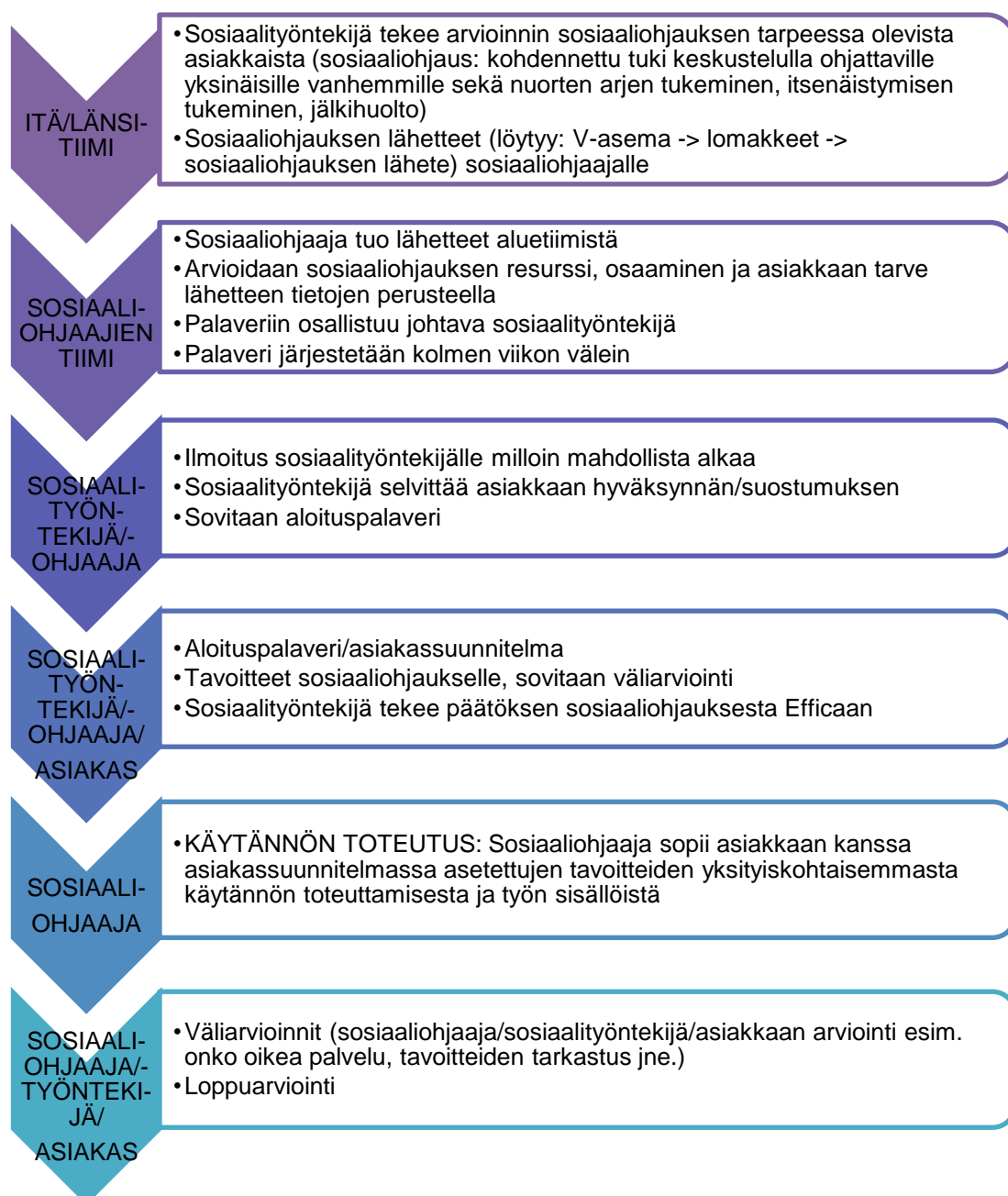
Kuvio 2. Sosiaaliohjauksen prosessi