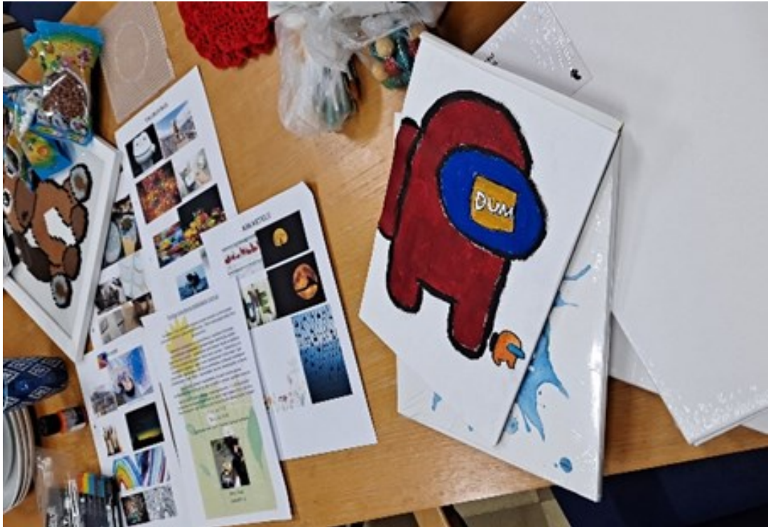
Kuva 1. Kuva otettu ideointipajan pöydästä.

työstön materiaalit ja työvälinetoiveet nousivat esiin osallistujien toiveista ideointivaiheen aikana.