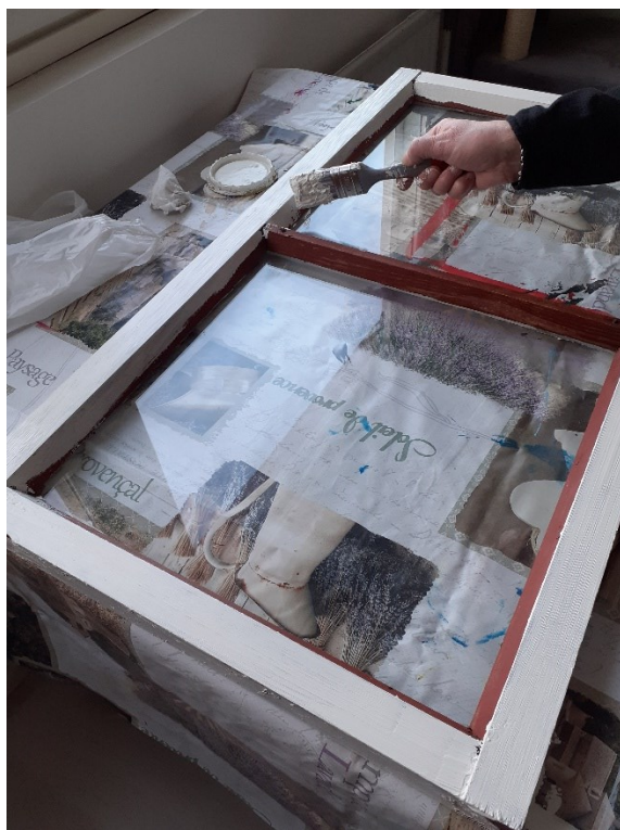
Kuva 2 Taidepajalla valmistumassa oleva kehys osallistujan ottamille valokuville.

Kulttuuripalveluita on kehitetty yhdessä kansalaisten kanssa. Taidelähtöisten menetelmien käytössä hyvinvointia edistettäessä, pyrkimyksenä voi olla itseymmärryksen kasvu, toisen kohtaaminen tai yksilön vaikutusmahdollisuuksien parantuminen taiteen keinoin. (von Brandenburg 2014, 243–244.) Tärkeää on, että hoitolaitoksessa asuvalla on mahdollisuus passiivisuuden sijaan olla mukana aktiivisesti suunnittelemassa ja valitsemassa omia kulttuuri- ja taidepalveluitaan. Oman taidekokemuksen äärelle on oikeus päästä myös hoitolaitoksessa. (Strandman-Suontausta 2013, 209.) Toipujan aktiivinen osallistuminen suunnitteluun ja toteutukseen taideteoksen osalta oli tärkeää, kuten myös kiireetön kohtaaminen ja toipujien taiteen esille tuominen. Kuva 2 on yhdeltä kodin taidepajoista. Huolehdin taidetarvikkeiden lisäksi mukaan aina tarvittavat suojamateriaalit.