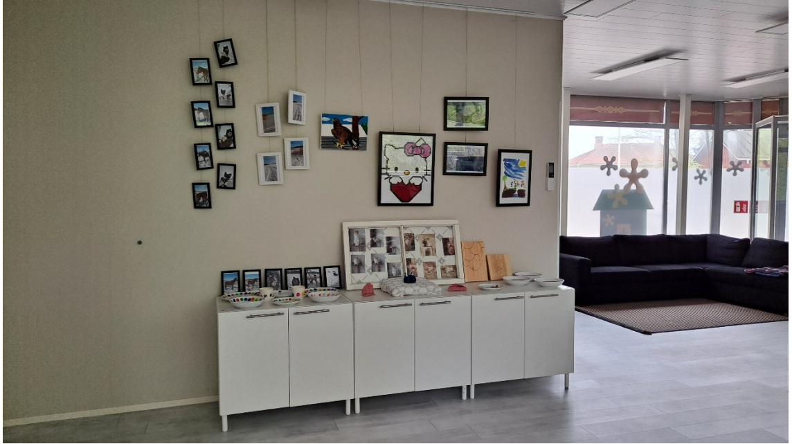
Kuva 3 Näyttely V-S Hoitopalvelut Oy:n ryhmättilassa.