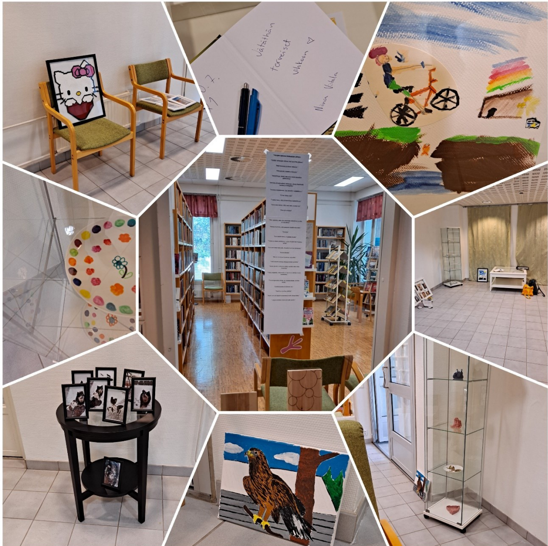
Kuva 8, Kuvia Mynämäen kirjaston näyttelytilan kokoamisesta, näyttelystä ja taideteoksista heinäkuussa 2021. Lisäksi keskimmäisessä kuvassa osallistuneiden ajatuksia ja kokemuksia taidepajakonseptista.

Vaikka muutama koki, ettei oma taideteos onnistunut, niin sen tekeminen oli kuitenkin ollut mukavaa. Kokemus hyvinvoinnista sisältää muutakin kuin lopputuotoksen, tavoitteen saavuttamisen sijaan hyvinvointia tuottaa jo toiminta kohti lopputuotosta (Raijas 2011, 263).