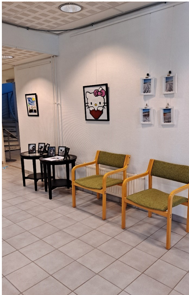
Kuva 4 Kuva näyttelystä Mynämäen kirjastosta.