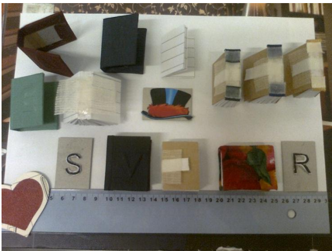
KUVA 2: Kierrätysmateriaaleista tehtyjä minikirjoja

Ryhmän tarvitsemat materiaalit ohjaaja tilaa tukuista tai hakee itse kaupoista, mutta materiaaleja saadaan myös lahjoituksina. Kirjoja ja kortteja tehdään paljon kierrätysmateriaaleista ja matonkuteita revitään muun muassa vanhoista lakanoista. Kaikki tuotteet tehdään myyntiin ja muun muassa erilaiset firmat sekä urheiluseurat tekevät paitatilauksia vankilalle. Valtaosan tuotteista ostavat kuitenkin vangit itse ja myös henkilökunnasta on tullut vankka asiakasryhmä. Kädentaitoryhmä ei kuitenkaan tuota voittoa, sillä tarvikkulujen lisäksi ryhmässä työskenteleville vangeille maksetaan toimintarahaa 4,90 euroa päivässä. Näin ollen kädentaitoryhmä on kuntouttavaa työtoimintaa. (Salmi 2012.)