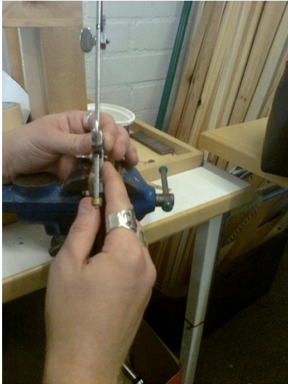
KUVA 1: Hopeakorun tekoa Kutomolla

Ryhmän tarvitsemat materiaalit ohjaaja tilaa tukuista tai hakee itse kaupoista, mutta materiaaleja saadaan myös lahjoituksina. Kirjoja ja kortteja tehdään paljon kierrätysmateriaaleista ja matonkuteita revitään muun muassa vanhoista lakanoista. Kaikki tuotteet tehdään myyntiin ja muun muassa erilaiset firmat sekä urheiluseurat tekevät paitatilauksia vankilalle. Valtaosan tuotteista ostavat kuitenkin vangit itse ja myös henkilökunnasta on tullut vankka asiakasryhmä. Kädentaitoryhmä ei kuitenkaan tuota voittoa, sillä tarvikkulujen lisäksi ryhmässä työskenteleville vangeille maksetaan toimintarahaa 4,90 euroa päivässä. Näin ollen kädentaitoryhmä on kuntouttavaa työtoimintaa. (Salmi 2012.)