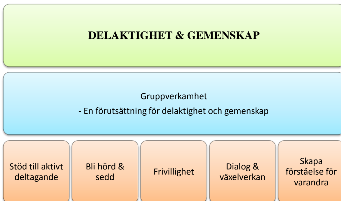
Figur 2. Faktorer som främjar delaktighet och gemenskap

I figur 2 lyfter vi fram vilka faktorer i de valda projekten som främjar delaktighet och gemenskap. De faktorer vi tar upp är gemensamma för de projekt vi granskat och har bidragit till att stöda uppkomsten av delaktighet och gemenskap. Gruppverksamhet är en förutsättning för att delaktighet och gemenskap skall kunna uppstå. De faktorer i verksamheten som främjar delaktighet och gemenskap är att deltagarna får stöd till aktivt deltagande, individerna blir hörda och sedda, deltagandet är frivilligt, dialog och växelverkan eftersträvas och förståelse för varandra skapas. Många av dessa faktorer är centrala inom sociokulturell inspiration och vi har även tagit fasta på dessa i figur 1. Gemenskap är ett centralt mål för sociokulturell inspiration och våra resultat visar att kopplingen mellan sociokulturell inspiration och delaktighet och gemenskap är tydlig.