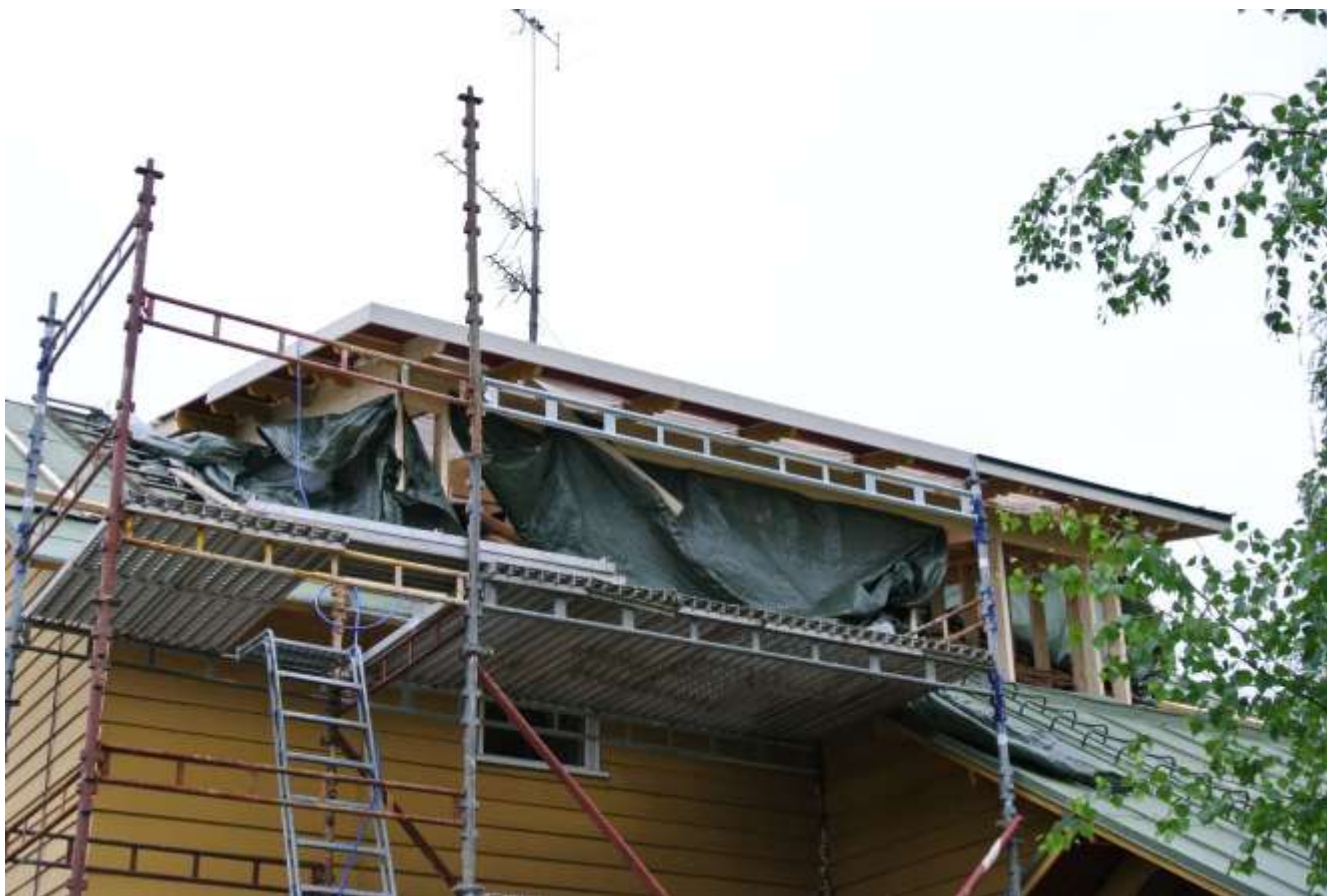
Kuva 20. Korotus vesikatto vaiheessa.

Seuraavana päivänä otsalautojen laitosta tulivat peltikattomiehet jo tekemään korotusosan kattoa. Peltikattotyöt tekivät Vaskisepät oy, joilla oli urakka koko katon uusimisesta. Remontin alkuvaiheessa oli tarkoitus uusia vain korotusosan puoleinen katto, mutta katon huonon kunnon takia tilaaja päätti uusituttaa koko talon katon. Sovittiin, että peltikattomiehet tulevat ensin tekemään pelkästään korotusosan katon, koska korotusosan rungon teon yhteydessä olimme huomanneet, että hormi oli osittain huonossa kunnossa ja se vaatisi korjausta. Hormin korjaus olisi helpompi suorittaa vanhan katon aikana, jolloin sitä ei tarvitse suojata eikä varoa niin kuin uuttaa kattoa. Joten sovittiin, että ilmoitamme Vaskisepille, kun olimme saaneet hormin korjattua.