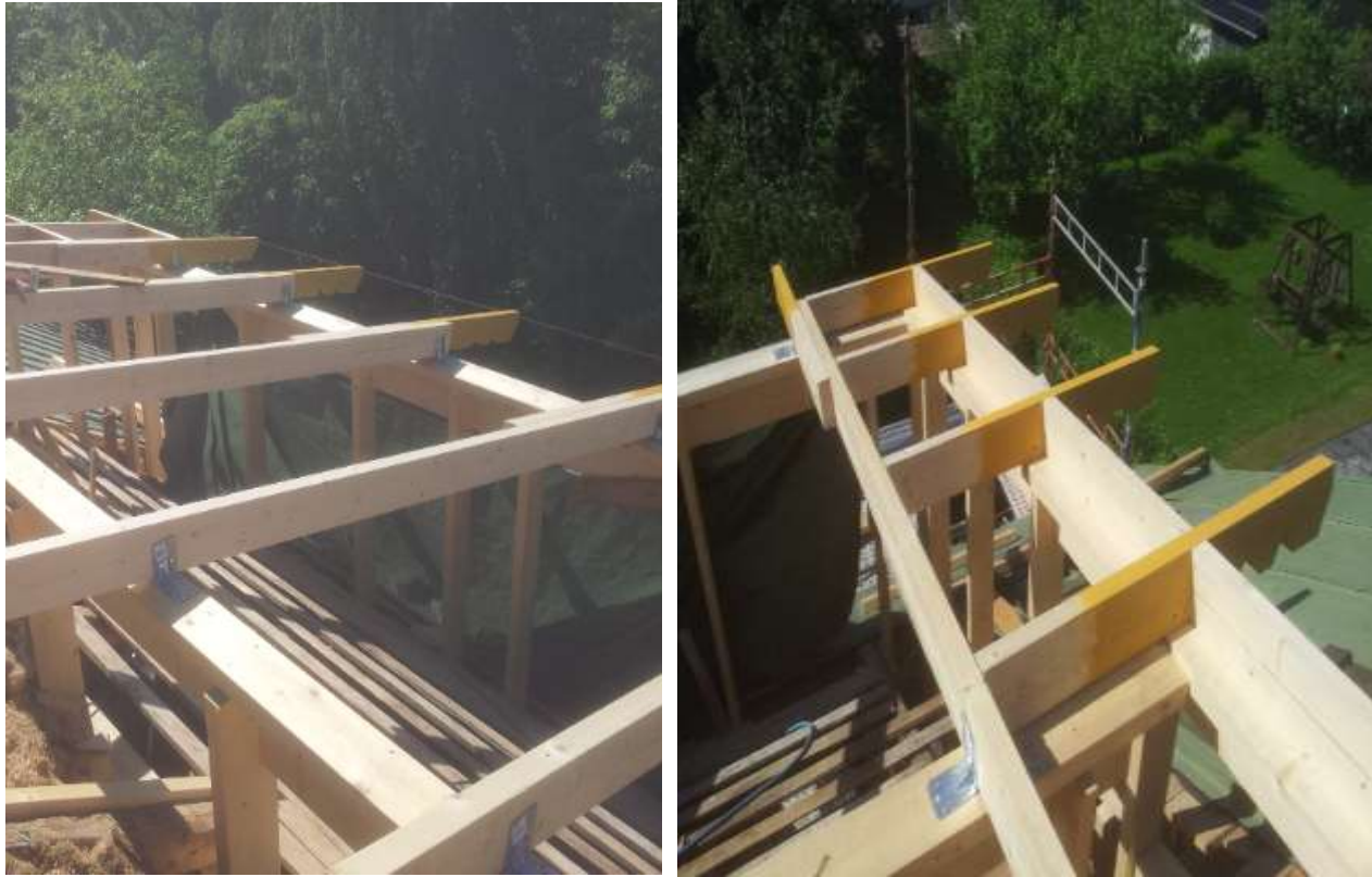
Kuvat 18 ja 19. Katon runkovaihe.

vanhoihin kattotuoleihin kiinni. Vanhat kattotuolit tuettiin ruuvaamalla niihin kiinni 50*125 mm lankut sille matkalla, minkä ne jäivät katon sisään. Kun kattoniskat oli saatu paikoilleen, niin seuraavaksi laitettiin poikaset niihin kiinni.