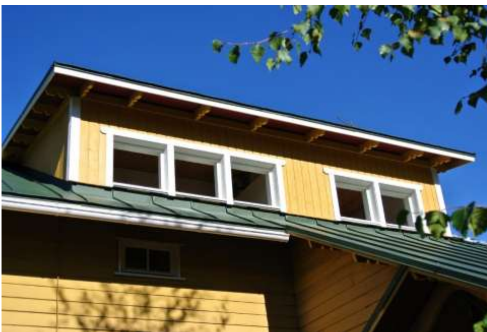
Kuva 52. Korotus valmiina.

Työ muilta osin saavutti sen, mitä siltä odotinkin. Opin paljon työmaan johtamisesta ja hoitamisesta, mutta ennen kaikkea ratkaisemaan ongelmatilanteita. Työmaalla saavutettiin ne tavoitteet, mitä sille olikin asetettu eli saada koko taloon sama lämmitysjärjestelmä, parantaa lämmöneristystä yläkerrassa ja tuoda lisää tilaa yläkertaan. Remontilla saavutetun uuden lämpimän tilan neliöhinta nousi suureksi, mutta Tampereen Petsamon alueella muunlaiselle tilanlisäykselle ei ollut mahdollisuutta. Tämä johtuu alueen suojelusta. Petsamon alue on rakennuskieltoaluetta, jossa vanhan purkaminen on kiellettyä. Joten ei ollut muuta mahdollisuutta kuin laajentaa vanhaa rakennusta säilyttäen alueella vallitsevan arkkitehtuurisen ilmeen.