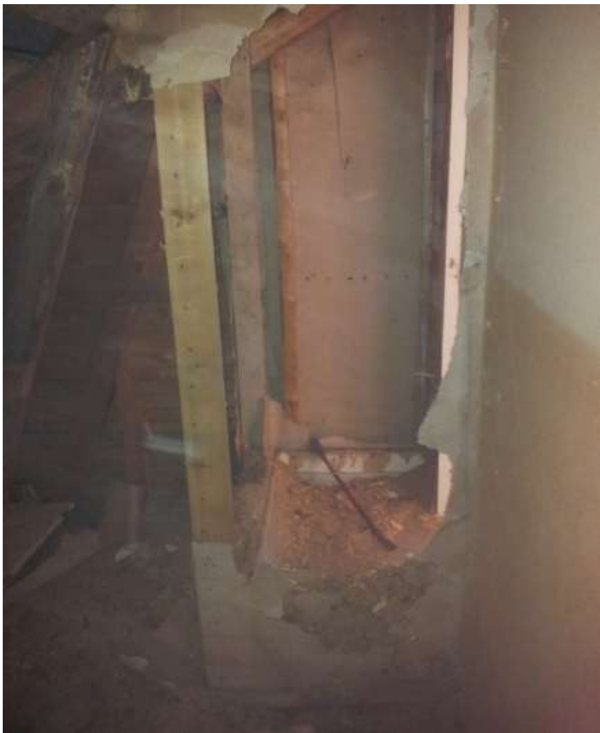
Kuva 4. Kylmä ullakotila ja vanha vaatehuone.

Purkaessani vanhan vaatehuoneen sisäpuolen sisäpuolista laudoitusta, huomasin että sieltä puuttuu eristys kokonaan.