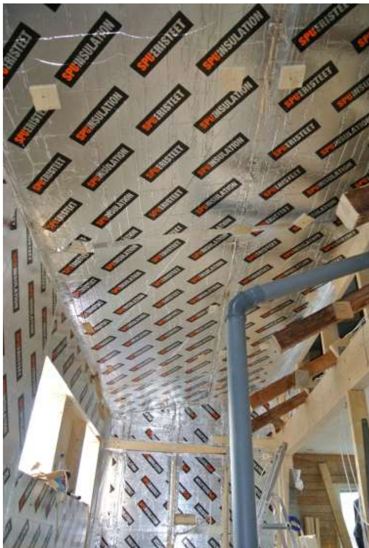
Kuva 31. Katto eristettynä.

Katto myös eristettiin polyuretaanieristeellä. Kattoniskoihin naulattiin ensin 50*50 mm ripa tuuletuksen säilymiseksi. Tuuletusripoja vasten laitettiin ensin 70 mm polyuretaanilevyt, joista taas tehtiin 10 mm pienempiä kuin kattoniskojen väli, jotta eristys saatiin tiiviiksi polyuretaanivaahdolla. Levyjen pysymiseksi katossa asennuksen ajan ruuvimme kattoniskoihin kiinni vanerinpaloja, jotka pitivät levyt paikoillaan vaahdon kuivumiseen ajan. Kun 70 mm levyt oli saatu paikoilleen, laitettiin niiden päälle vielä 120 mm polyuretaanilevy. Levyt ruvattiin kattoniskoihin kiinni, jonka jälkeen taas kaikki saumat, reiät ja läpiviennit teipattiin alumiini teipillä