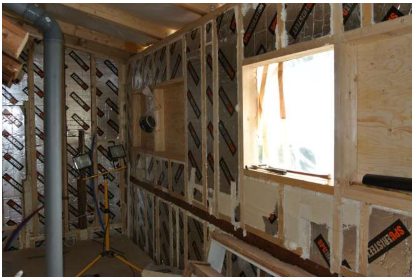
Kuva 28. Runkojen välit eristettynä.

Ulkoseinät eristettiin 120 mm ja 50 mm polyuretaanilevyllä lukuun ottamatta keittiön seinää, johon tilanahtauden vuoksi tuli 120 mm polyuretaanilevy sekä 45 mm Anselmi/Wilhelmi levy.