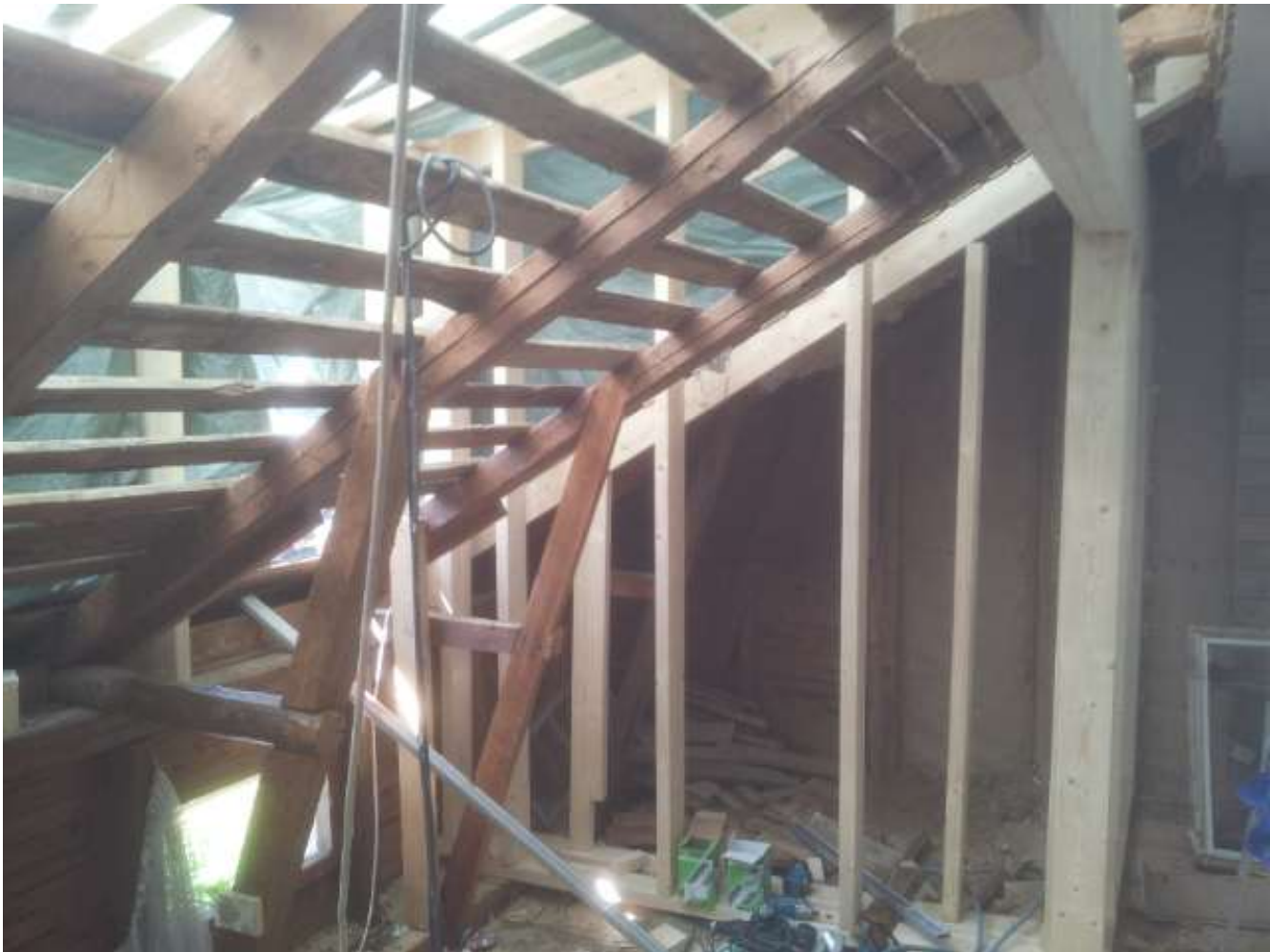
Kuva 15. Vaatehuoneen ja keittiön välinen päätyrunko.

Seuraavaksi oli vuorossa yläjuoksun ja tasakerran laittaminen paikoilleen. Yläjuoksuja laitettaessa vielä varmistettiin vatupassilla, että tolpat olivat suorassa, jonka jälkeen ne ammuttiin kiinni. Kun yläjuoksu oli saatu paikoilleen, niin enää tarvitsi nostaa tasakerta rungon päälle ja ampua sekin myös kiinni.