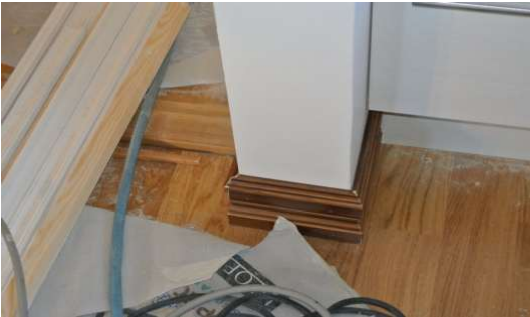
Kuvat 50 ja 51. Holkki-, vuori – ja jalkalistat.