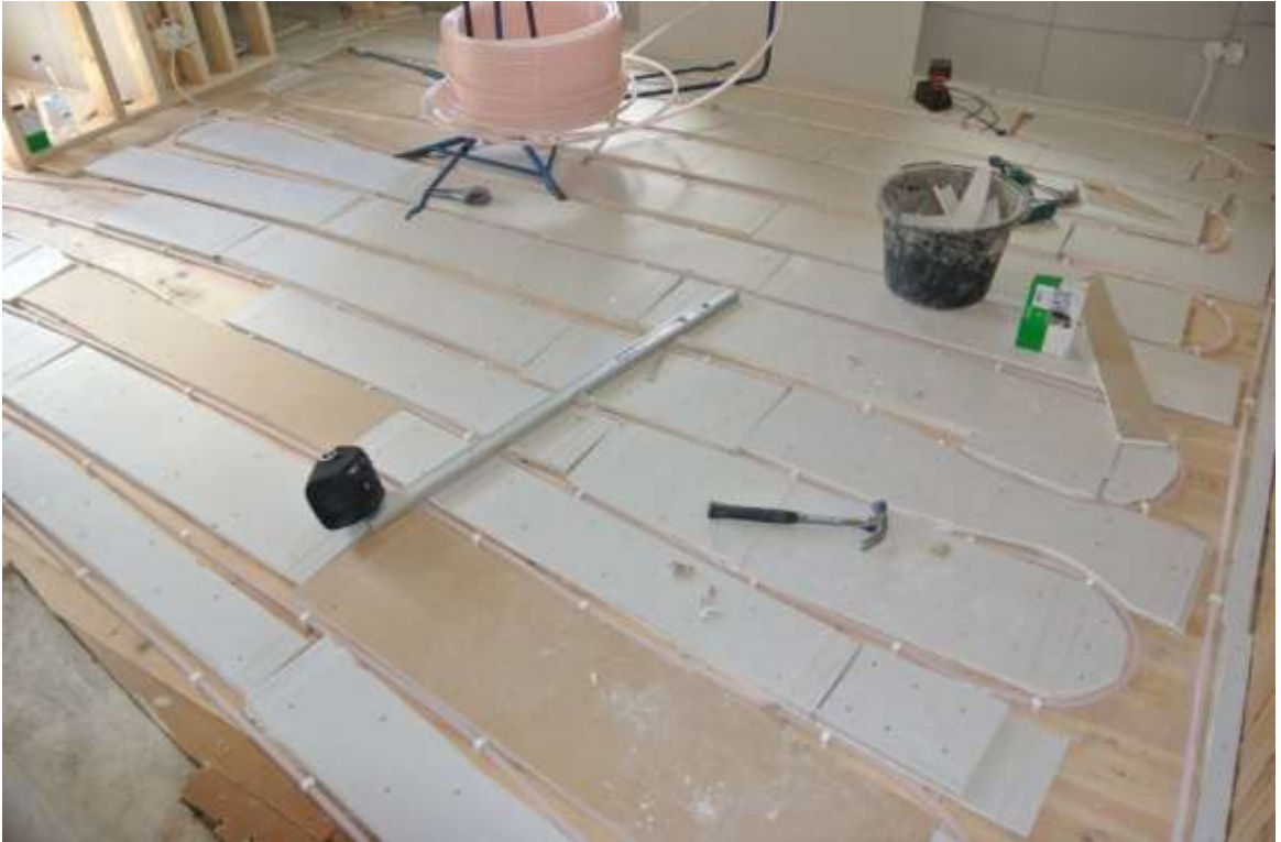
Kuva 37. Lattialämmitysputket paikoillaan ja välit täytettyinä kipsilevyllä.