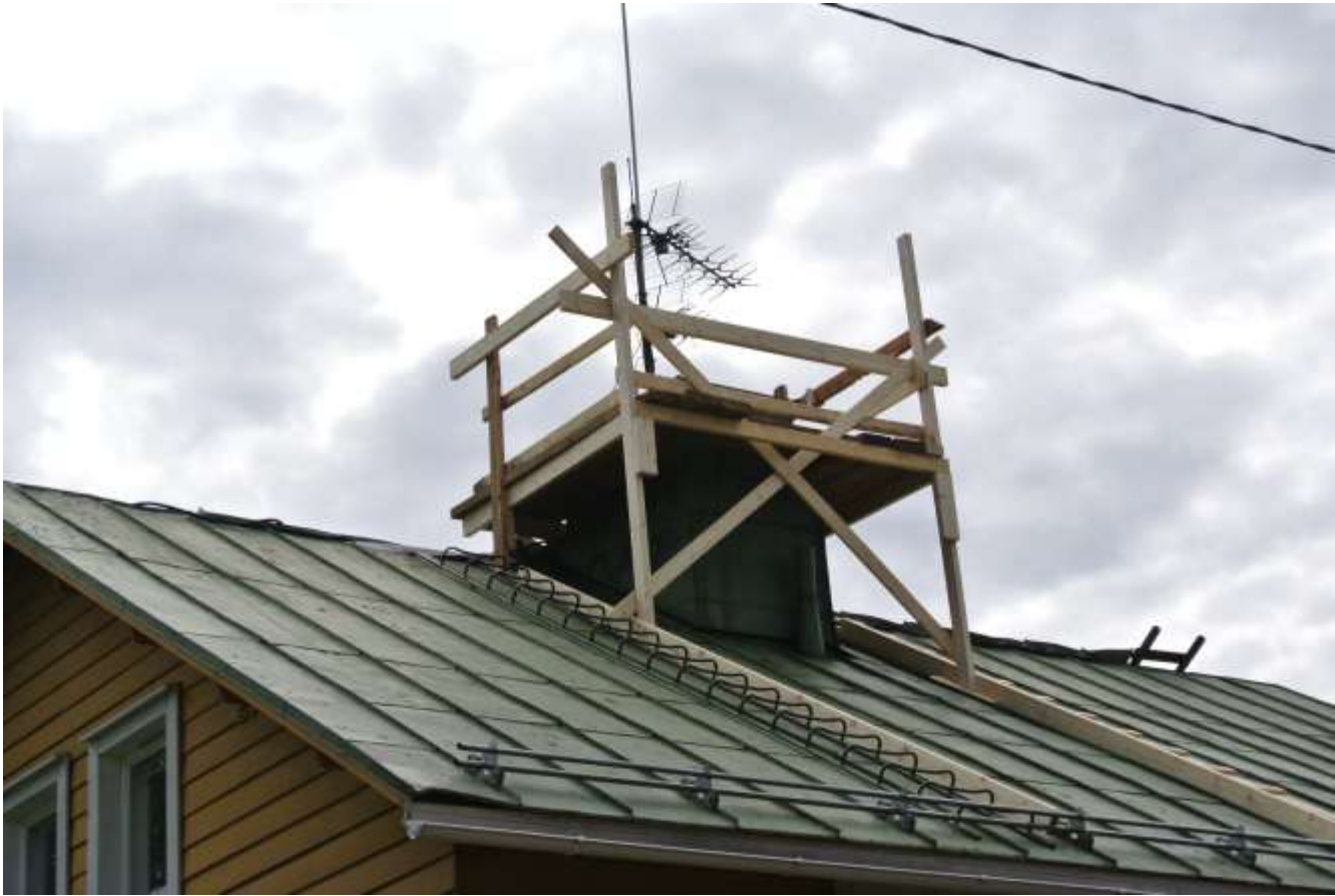
Kuva 21. Hormin korjausta varten tehdyt telineet.

Hormin korjaus aloitettiin tekemällä telineet sen ympärille. Telineet tehtiin monenlaisesta eri puutavarasta, mitä oli jäänyt aiemmin hukaksi remonteista.