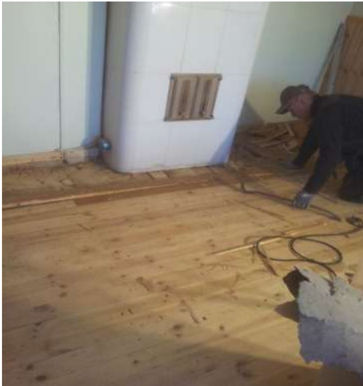
Kuva 5. Vanhasta lattiapontista ja uunin pedin kohdalta purkamisesta.

Seinien purkamisen jälkeen alkoi lattioiden purkaminen ja niiden rakenteiden tutkiminen. Minä ja toinen kirvesmies Teppo Karva aloimme purkaa olohuoneen lattiaa, jossa oli ensimmäisenä kokolattiamatto. Kun aloimme poistaa sitä, huomasimme että alta löytyi vielä toinen matto. Se oli huomattavasti paljon tiukemmin kiinni kuin päällimmäinen. Kun matot oli saatu poistettua lattiasta, niin alta paljastui, että sinne oli laitettu kaksinkertainen kovalevy ennen ponttilattia. Nähdäksemme, missä kunnossa ponttilattia on, kovalevyt oli poistettava. Kovalevyt lähtivät melkein kokonaisina irti lattiasta, koska ne olivat onneksi naulaamalla eivätkä liimalla kiinni, joten päätimme säästää osan niistä tulevia koolauksia varten. Kovalevyjen alta paljastui kohtuullisessa kunnossa oleva ponttilattia, johon teimme noin 0,5*1,0 m kokoisen aukon, jotta pääsimme näkemään, mitä sen alta löytyy ja täten pohtimaan, että tarvitseeko sitä purkaa pois. Tulimme siihen tulokseen, että lattiaa ei ole tarpeellista purkaa kokonaan pois, vaan sen päälle voidaan levittää lattialämmitysputket. Ainut kohta, mistä ponttia piti purkaa pois oli kaakeliuunin kohta, josta se oli huomattavan korkealla verraten muuhun lattiaan.