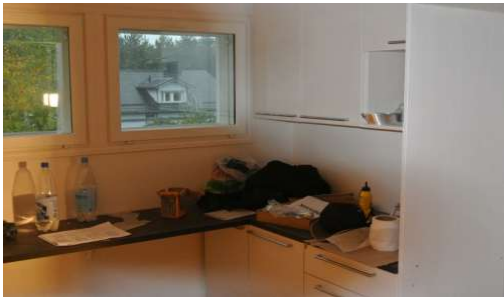
Kuvat 48 ja 49. Keittiön teko menossa.