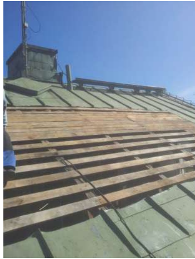
Kuvat 11 ja 12. Katon purkamisesta.