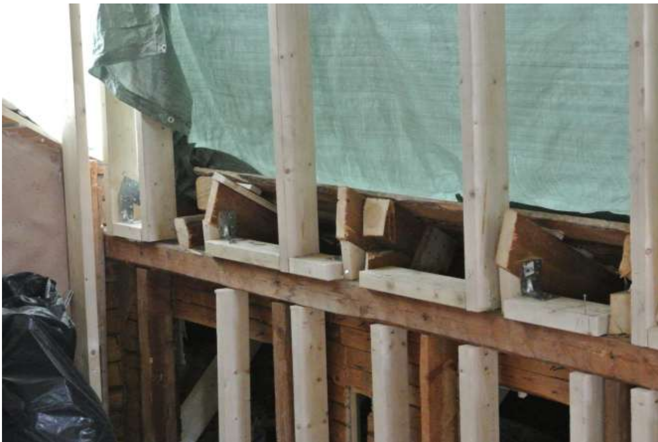
Kuva 22. Vanhojen kattotuolien tuenta.

Ensin purimme vanhat kattotuolit, ruoteet ja niiden tuet pois, mikä kävi helposti moottorisahalla. Kun kattotuolit oli purettu pois, huomasimme, että vanhan katon poikasia ja eteisen osan kattotuolien päitä ei ollut tuettu eikä kiinnitetty millään tavalla.