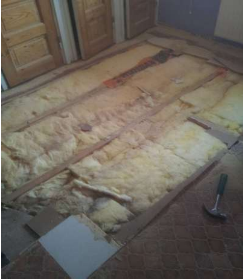
Kuva 7. Makuhuoneen lattian vanhat koolaukset ja villoitukset.