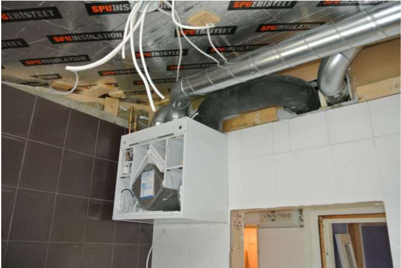
Kuva 40. Iv-kone.

Yläkertaan tuli yhteensä kaksi poistoa ja kaksi tuloilmaa sekä raitisilma ja jäteilma. Poistoilmaventtiilit tulivat keittiöön ja kylpyhuoneeseen. Tuloilmaventtiilit tulivat makuuhuoneeseen ja olohuoneeseen. Ilmamäärät säädettiin siten, että tila jäi alipaineiseksi. Raitisilma otettiin kylpyhuoneen ulkoseinän päädystä, kun taas jäteilma johdettiin hormin kautta pihalle. Kaikki putket eristettiin ensin alhaalla, minkä jälkeen ne vietiin vanhaan yläpohjaan, josta ne jaettiin eri huoneisiin.