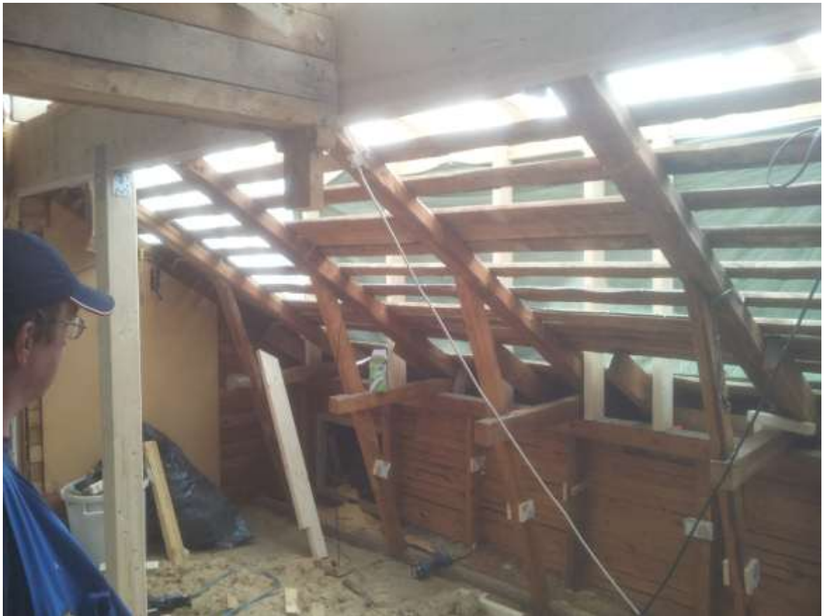
Kuva 14. Runko sisältä päin.

Seuraavaksi siirryttiin tekemään räystäään puoleista runkoa, joka tehtiin vanhan hirsikehikon jatkoksi. Runkotolpat lähtivät vanhan tasakerran päältä ja ne tehtiin 50*125 mm puutavarasta. Niiden kanssa toimittiin samalla tavalla kuin yläpään rungon kanssa. Sahasimme maassa ensin tolpat noin mittaan ja teimme yläpään loven valmiiksi yläsidepuuta varten. Myös tolppien mitoittaminen oli hieman hankalaa vanhojen kattotuolien ja tulevien ikkunoiden kannalta. Koska wc:n ja keittiön välistä väliseinää oltiin päädytty siirtämään, myöskään alunperin suunniteltuja ikkunoita ei saatu sopimaan runkoon, vaan ne vaihtuivat viideksi 8*7M mittaiseksi ikkunaksi. Rungon tekeminen muilta osin eteni samalla tavalla kuin aiemmin. Sivurunkojen valmistuttua otimme niistä ristimitat varmistuaksemme, että ne olivat suorassa kulmassa toisiinsa nähden. Kuten tavallista ne eivät aivan olleet ristimitassa, vaan niitä piti vääntää jonkin verran ennen kuin ne saatiin ristimitaan. Tämän jälkeen, kun rungot olivat kohdillaan, niin ne reivattiin ristiin, jotta ne eivät pääsisi enää liikkumaan. Kun olimme saaneet tehtyä ylä- ja alapäänrungot, niin katon suojaaminen helpottu, koska saimme laitettua rungon päälle lankut ja niihin kiinni kevytpeitteet.