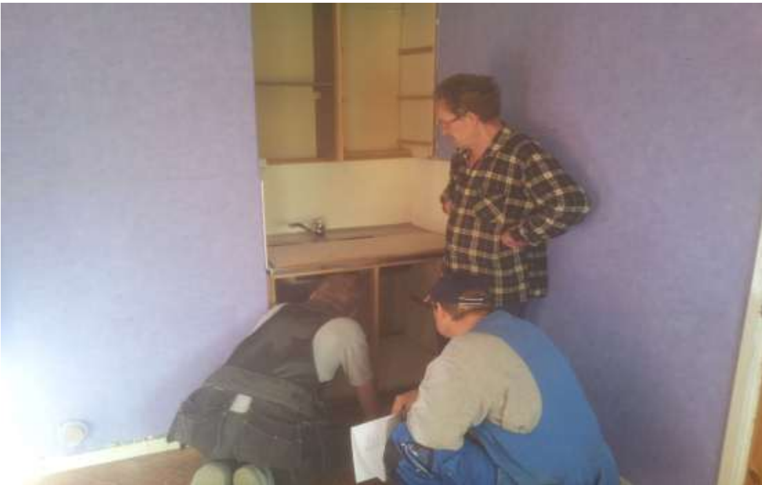
Kuva 6. Vanha keittiö makuuhuoneessa.

Ensimmäisenä makuuhuoneesta oli purettava vanha keittiö pois. Ennen sitä oli putki- miesten käytävä sulkemassa yläkerrasta vedet pois, jotta pystyimme purkamaan vanhan pesualtaan pois ja myös myöhemmin purkamaan vanhan wc:n pois. Kun keittiö oli saatu purettua, niin aloitimme lattian purun. Purku alkoi taas lattian maton poistamisella, maton alla oli lastulevylattia. Ensin ajattelimme, että emme pura sitä pois, vaan sen päälle on hyvä levittää lattialämmitysputket. Lattiaa tarkemmin tutkiessamme huomasimme sen notkuvan huomattavasti, joten se oli purettava pois, että pääsisimme näkemään minkä takia lattia antaa periksi.