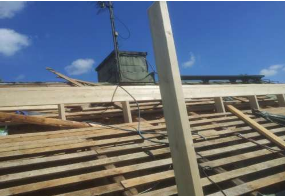
Kuva 13. Palkin päälle tuleva runko valmiina.

Ensin mitoitettiin runkotolppien jako, jonka jälkeen runkotolpat katsottiin vatupassiin ja ammuttiin kiinni alapäästään runkonaulaimella. Seuraavaksi ne linjattiin ja otettiin korkomerkit molempiin päihin ja ammuttiin värilangalla katkaisumerkit lovia varten, johon yläside tulisi. Kun lovet oltiin saatu sahattua, niin nostimme 50*200 mm lankun runkotolppien päälle. Tämän jälkeen runkotolppien suoruus varmistettiin uudelleen vatupassilla ja ne kiinnitettiin naulaamalla yläsidepuuhun. Rungosta puuttui enää tasakerta, joka tehtiin 50*150 mm puutavarasta. Se nostettiin rungon pääll, jonka jälkeen se ammuttiin kiinni samalla varmistaen, että yläjuoksu kulkee samassa linjassa rungon kanssa.