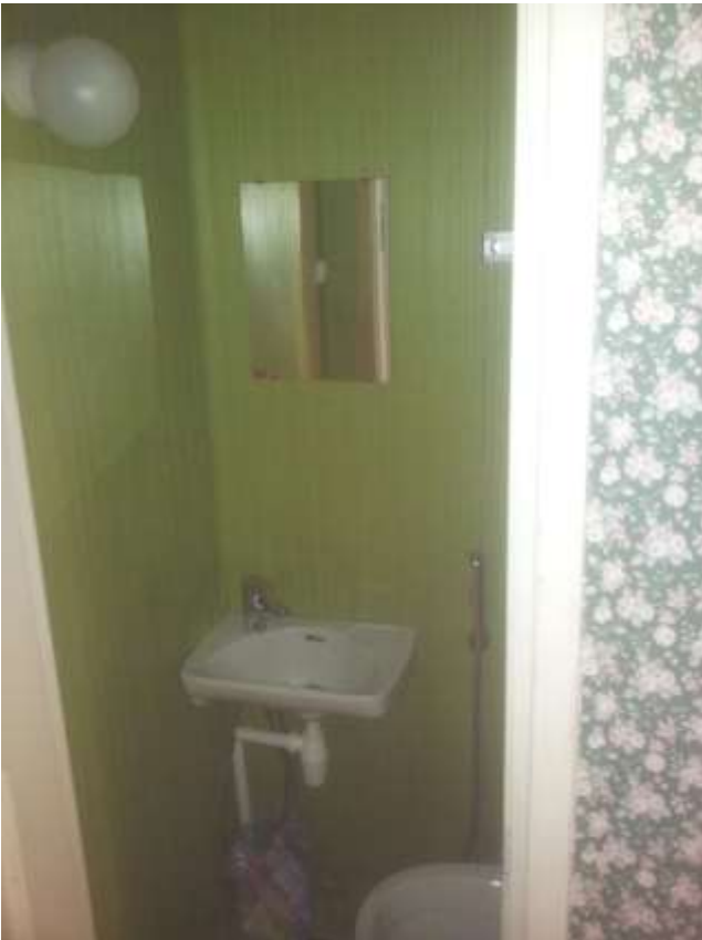
Kuva 8. Vanha wc.

Vanha wc purettiin pois, koska se oli hyvin pieni ja epäkäytännöllinen. Wc:stä poistettiin saniteettikalusteet ja lattia purettiin pois. Purkutyössä ei ollut muita vaikeuksia kuin vanhan valurautaputken poistaminen. Se oli erittäin hankalassa paikassa makuuhuoneen ja wc:n välisen seinän alapuolella. Sen poistamista vaikeutti myös se, että putki meni lattian purueriteissä eikä sitä silloin voitu katkaista pois millään sähkötyökalulla kipinävaaran takia. Joudumme hakkaamaan sen rautakangella ja lekalla poikki.