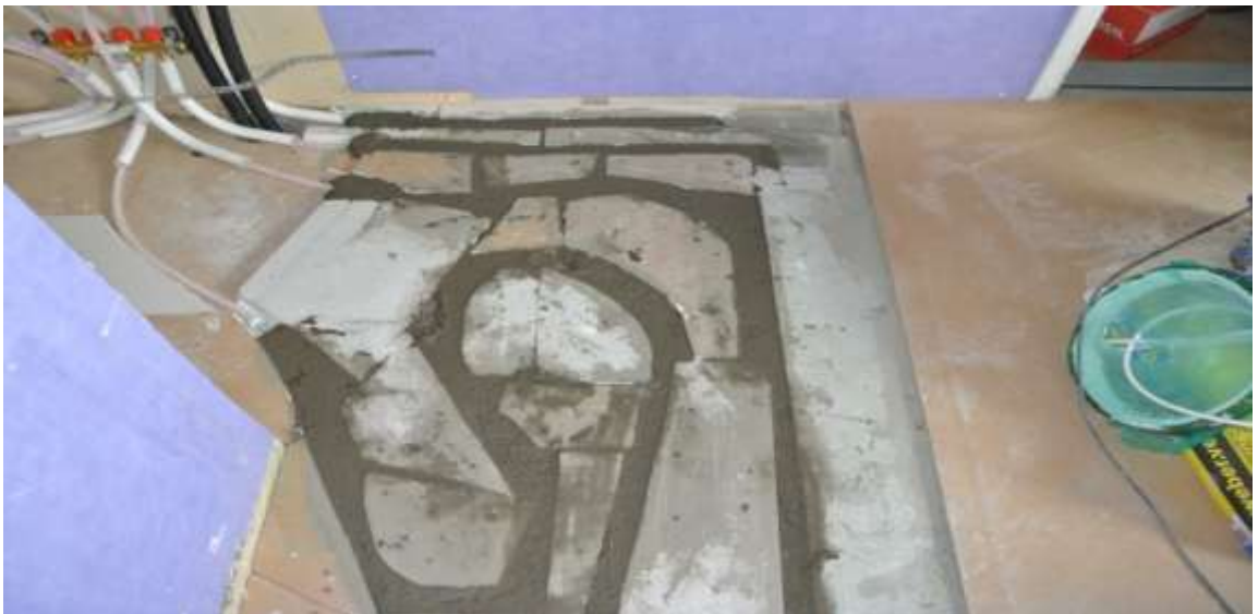
Kuva 38. Putkien välit valettuna ja pintalevyn laitto kesken.