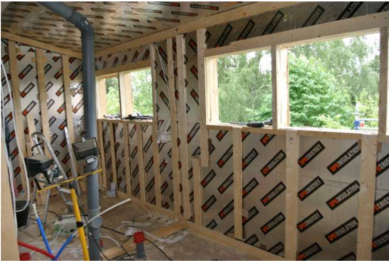
Kuva 33. Seinät laudalla koolattuna.

Laajennusosan kaikki seinät koolattiin 22x100 mm laudalla pystysuuntaan. Kylpyhuoneen kohdalla koolausväli oli 400 mm ja muualla 600 mm. Seinät koolattiin ruuvamalla laudat kiinni runkotolppiin. Seinät suoritettiin linjalankaa, suorakulmaa ja vatupassia käyttäen. Lautojen alle laitettiin aina tarpeen tullen kovalevyn paloja, niin että laudat saatiin vatupassiin ja suoraan toisiinsa nähden sekä kulmat suoraan kulmaan.