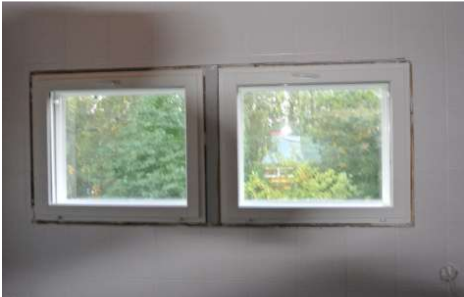
Kuvat 42 ja 43. Keittiön ja kylpyhuoneen ikkunat.