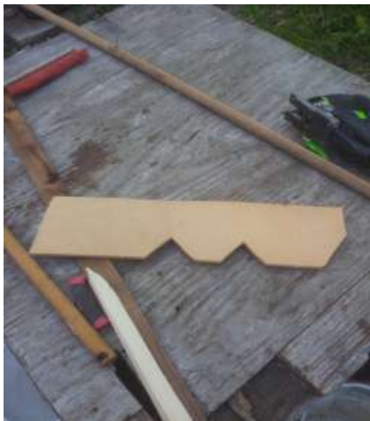
Kuva 17. Poikanen.

Ensimmäinen työvaihe katon teossa oli tehdä samanlaiset poikaset kuin muuallakin talossa. Telineiden kohdalta piirrettiin yhdestä poikasesta malli, jonka perusteella aloin tekemään niitä. Ne tehtiin 125*50 puutavarasta, johon ensin sahattiin pistosahalla kolot, minkä jälkeen ne hiottiin ja maalattiin.