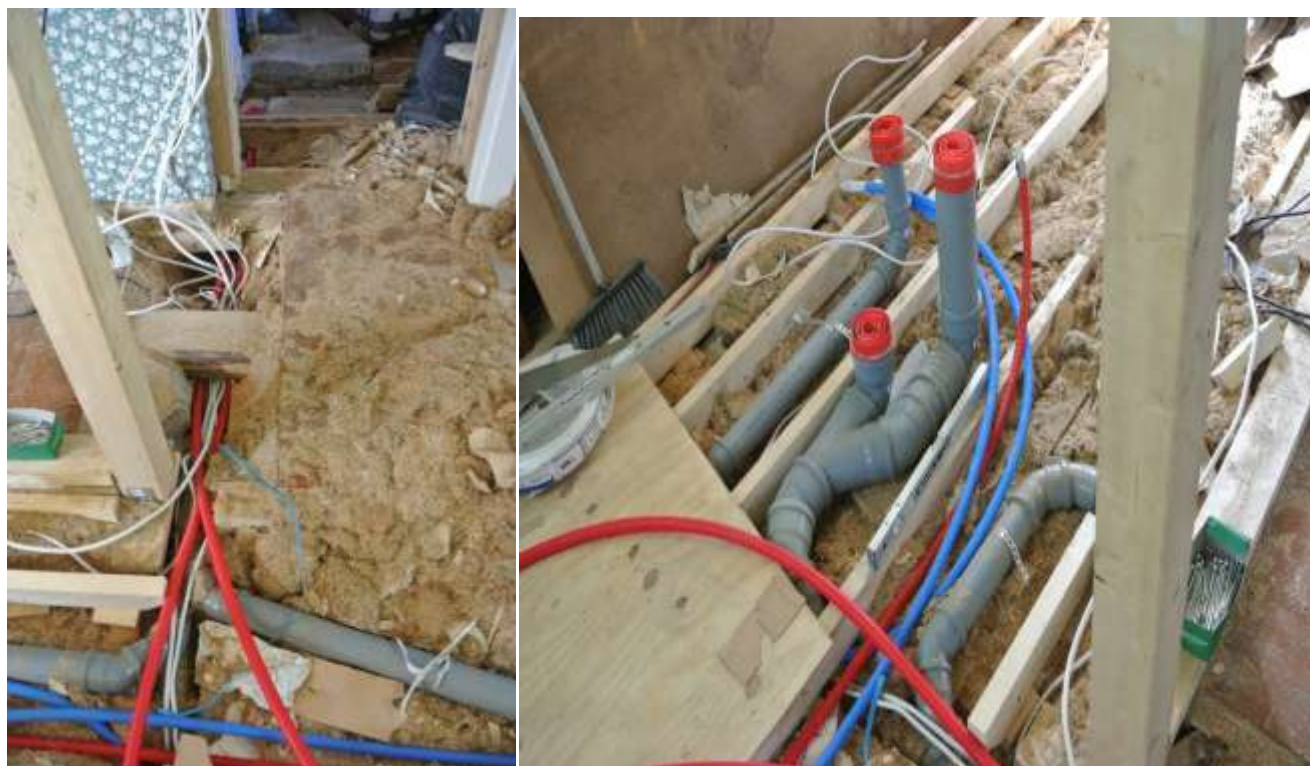
Kuva 24 ja 25. Vesi- ja viemäriputkien sekä sähköjohtojen vedot.

Laajennu osalle tulevat sähköt vedettiin lattian kautta. Pesukoneelle, liedelle ja jääkaapille vedettiin omat johtonsa, mutta muut kuten pistorasiat ja keittiön sähköt tehtiin ketjuttamalla.