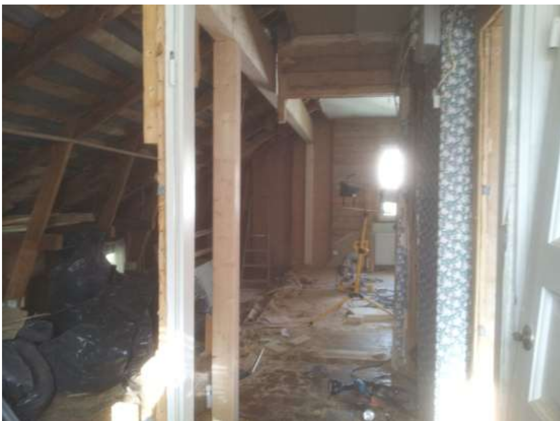
Kuva 10. Palkit ja pilarit saatu paikoilleen.

Palkkien asennus aloitettiin nostamalla ensin yksi palkki molemmissa päissä olevien tukien päälle. Palkin paikalleen nostamista hankaloitti yläkerrassa oleva vähäinen tila ja se, että palkit olivat melkein yhtä pitkiä kuin yläkertakin. Pienen taivuttelun jälkeen palkin toinen pää saatiin nostettua ulkoseinällä olevan poikittaistuen päälle. Seuraavaksi palkin toinen pää piti saada nostettua seinärungon päälle. Karvan Teppo jäi tukemaan palkin ulkoseinärungon päätä, kun minä ja Arto Lepistö menimme nostamaan palkin toista päätä ylös. Ensimmäisessä nostuksessa nostimme yhdessä palkin rungon tolpan päälle, jonka jälkeen minä pitelin palkkia paikoillaan, sillä välin kun Arto Lepistö ruuvasi runkotolppaa pystyyn tukemaan palkkia, että se ei pääsisi pyörähtämään alas. Toisen palkin kanssa toimittiin samalla tavalla kuin ensimmäisenkin kanssa. Palkit oli nyt saatu nostettua paikoilleen. Tämän jälkeen tarvitsi enää asentaa palkkia tukevat liimapuupilarit.