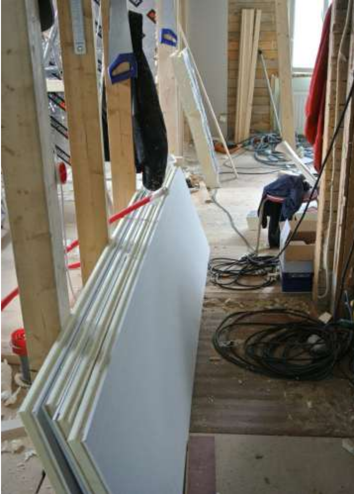
Kuva 30. Anselmi / Wilhelmi levyjä.

Olohuoneen vanha ulkoseinä eristettiin lisälämmön saamiseksi Anselmi /Wilhelmi- levyllä. Anselmi /Wilhelmi on kipsilevy/polyuretaani levy, Siinä 30 mm polyuretaani eristettä, jonka päälle on liimattu kipsilevy. Makuuhuoneen ulkoseinää ei voitu eristää Anselmi/Wilhelmillä, koska sen olisi tullut komeron tielle, jolloin se olisi jäänyt pois käytöstä ja sitä ei haluttu.