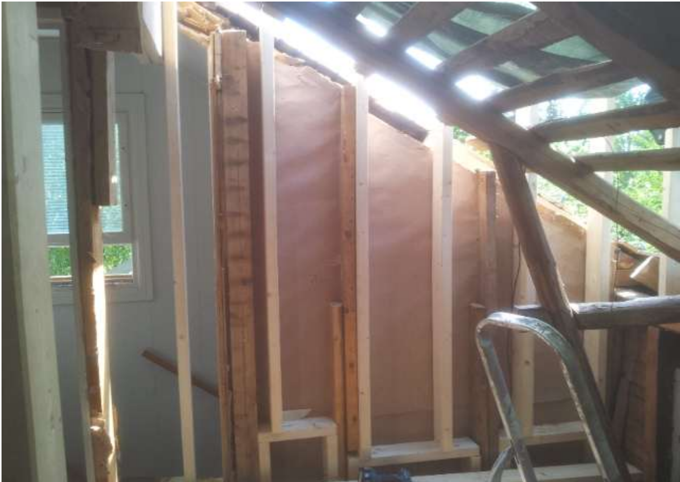
Kuva 16. Kylpyhuoneen päätyrunko.

Ensimmäisenä ammuimme 50*125 mm pätkät kiinni runkotalppiin ja niiden päälle laitettiin 50*125 alajuoksut. Tämän jälkeen loppurungon tekeminen eteni samalla tavalla kuin edellisenkin tekeminen poiketen vain jaoltaan siten, että koska kyseessä oli kylpyhuoneen seinä niin tolpat laitettiin 400 mm jaolla.