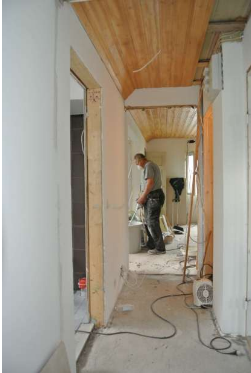
Kuva 45. Katon panelointi ja seinien maalaukset kesken.

Kaikki seinät, jotka oli tehty kipsilevyllä, kitattiin, nauhoitettiin, hiottiin ja maalattiin. Seinät maalattiin vaaleanbeigen sävyllä, jota oli jo aiemmin muissakin kerroksissa käytetty. Mitään seiniä ei tapetoitu, eikä makuuhuoneen seinälle tehty mitään. Puolipaneeliseinä petsattiin tummanruskeaksi.