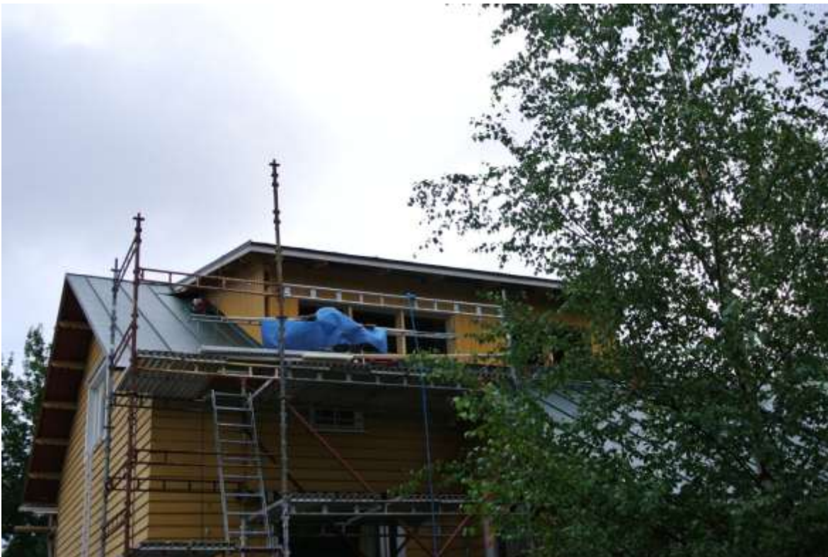
Kuva 32. Ulkovuori valmistumassa.

Kun ulkoseinät oli saatu koolattua, niin niiden päälle tuli ulkoverhouspaneeli, joka oli 145x23 mm stv paneelia. Ensin tehtiin korotuksen päädyt ja viimeiseksi korotuksen sivut. Paneeleiden alapäätsä sahattiin vinoon, että vesi ei jäisi hautumaan paneeleiden alapäähään. Paneloinnin jälkeen laitettiin valkoiset ulkovuolaudit nurkkiin. Ulkoverhouksesta puuttui enää ikkunoiden vuorilaudat, jotka voitiin laittaa paikoilleen vasta ikkunoiden asennuksen jälkeen.