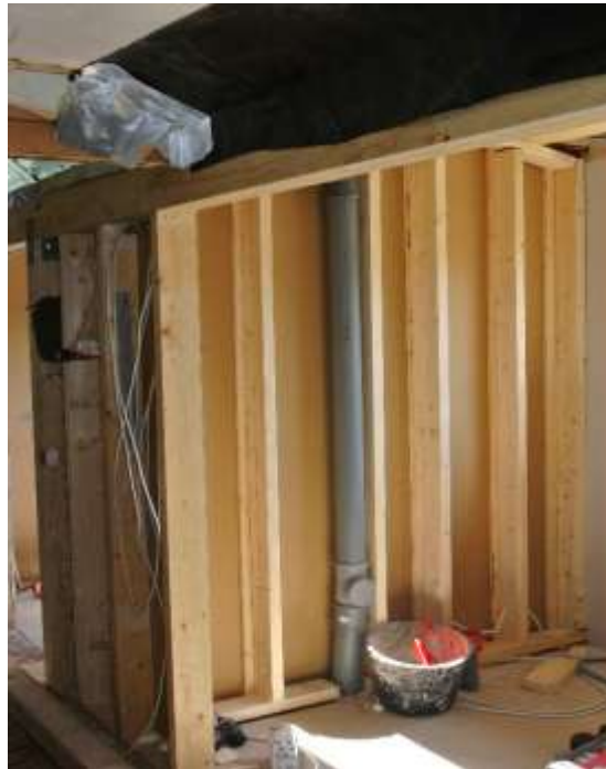
Kuva 36. Keittiön ja kylpyhuoneen väliseinä.

Laajennusosaan tehtiin kaksi kevyttä väliseinää. Toinen tuli kantavan palkin alle ja toinen tuli keittiön ja kylpyhuoneen väliin. Molemmat väliseinät tehtiin 125 x50 mm puutavarasta. Syy, miksi ne tehtiin niinkin järeästä tavarasta, oli että palkin pilarit olivat yhtä isoja ja keittiön väliseinään piti mahtua viemärin tuuletusputki rungon sisään. Ensin tehtiin palkin alle tuleva seinä. Tolpat laitettiin 600 mm jaolla muuten paitsi kylpyhuoneen kohdalla, johon tehtiin 400 mm jako. Väliseinätolpista tehtiin tarkoituksella vähän lyhyet, että palkille jäisi elämisvaraa. Kun väliseinärunko oli saatu tehtyä, niin se levytettiin kipsilevyllä. Aluksi seinä levytettiin ainoastaan laajennuksen puolelta, että seinään pystyttiin vielä vetämään sähköjä sekä ilmastointilaitteen lämmitysputket.