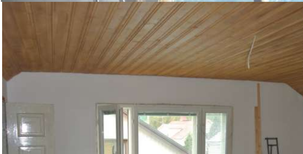
Kuvat 46 ja 47. Olohuoneen ja kylpyhuoneen paneelikatot valmiina.