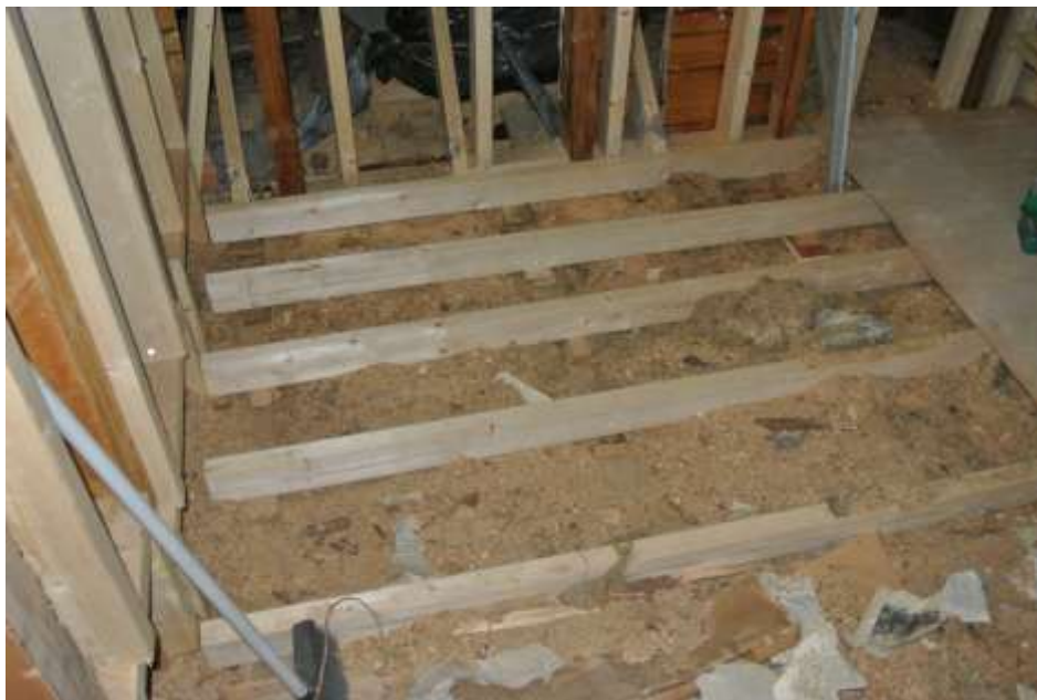
Kuva 23. Lattian koolaukset kylpyhuoneen kohdalta. Kuva: Juha Honkala

Itse koolaus aloitettiin ottamalla lähtökorkeus laseriin kylpyhuoneen korkeimmalta kohdalta, josta lähdettiin koolaamaan lattiaa suoraksi. Lattia koolattiin 50*100 mm puutavarailla. Lattia päätettiin tehdä kokonaan 400 mm jaolla, koska laajennuksen osalle tulee paljon painoa mm. keittiö ja kylpyhuone. Lattia koolattiin siten, että ensin ruuvattiin koolingin kylpyhuoneen pää kiinni lattianiskaan, jonka alle tarvitsi laittaa vain muutama kovalevyn pala. Siitä jatkettiin aina niska kerrallaan. Laserilla katsoin, kuinka paljon koolauksen alle tarvitsee laittaa puupalikoita tai kovalevyä, jotta ollaan samassa korossa kylpyhuoneen kanssa. Sama tehtiin jokaisen koolingin kanssa kunnes lattia oli saatu suoraksi. Vanhan osan lattian epäsuoruuden takia, oli kylpyhuoneen lattiaa nostettava 20 mm ylöspäin, jotta lattia ei jäisi liian alas. Lattiaa ei nostettu varsinaisesti koolaamalla, vaan jo valmiiksi suorien koolinkien päälle naulattiin 20*50 mm rivat.