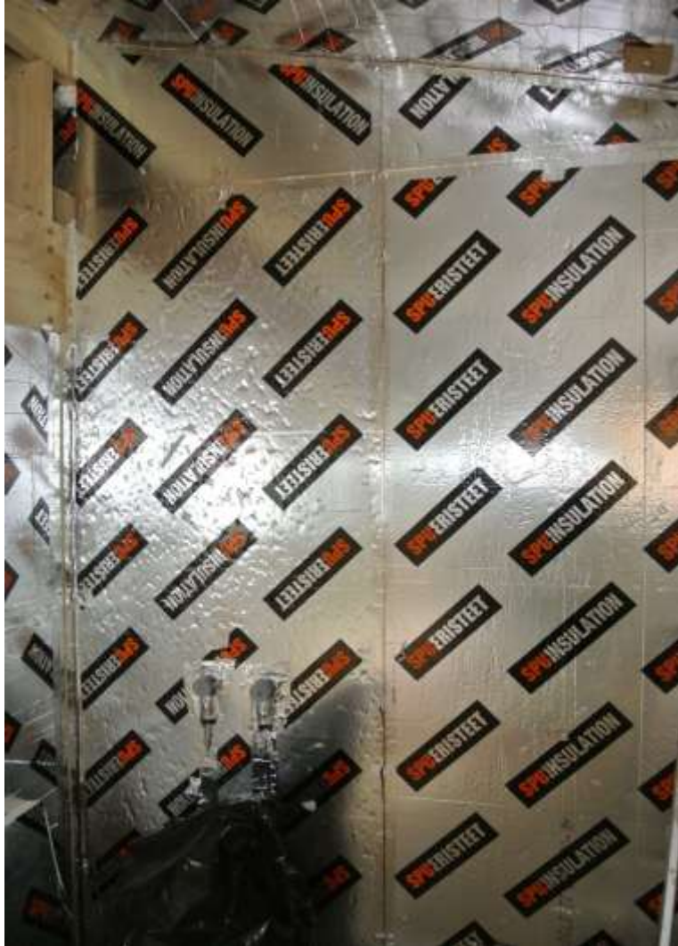
Kuva 29. Kylpyhuoneen seinä eristettynä ja teipattuna.

Kun 120 mm levyt oli saatu paikoilleen, niin päälle laitettiin ehjä 50 mm polyuretaani-levy. 50 mm levyt laitettiin runkoon kiinni ruuveilla, jotta levyt pysyisivät paikoillaan koolausten tekoon asti. Kun levyt oli saatu paikoilleen, niin kaikki pysty – ja vaaka-saumot sekä kaikki läpiviennit ja reiät teipattiin alumiiniteipillä rakenteen tiivistämiseksi.