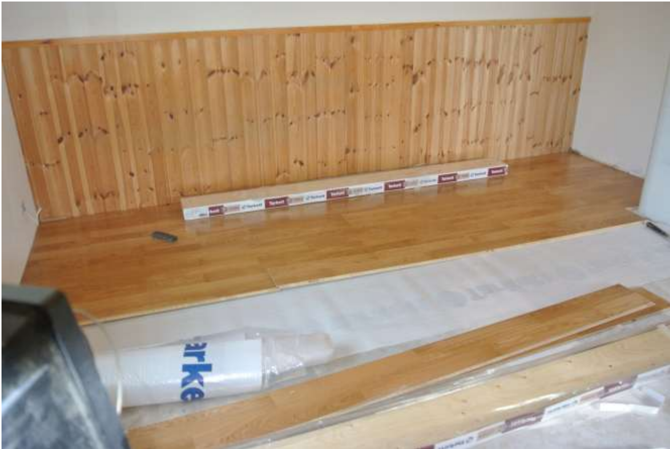
Kuva 44. Parketin laitto kesken.

Kaikki paitsi kylpyhuoneen lattiat tehtiin parketilla, joka oli Targetin tammiparkettia. Parketti tuli suoraan Tammer-lattioiden varastolta, joten se voitiin asentaa saman tien paikalleen, kun se tuli työmaalle. Parketin alle tuli askeläänieriste, joka on Targetin valmistamaa. Askeläänieristeenä oli käytettävä Targetin omaa (takuu säilymisen vuoksi).