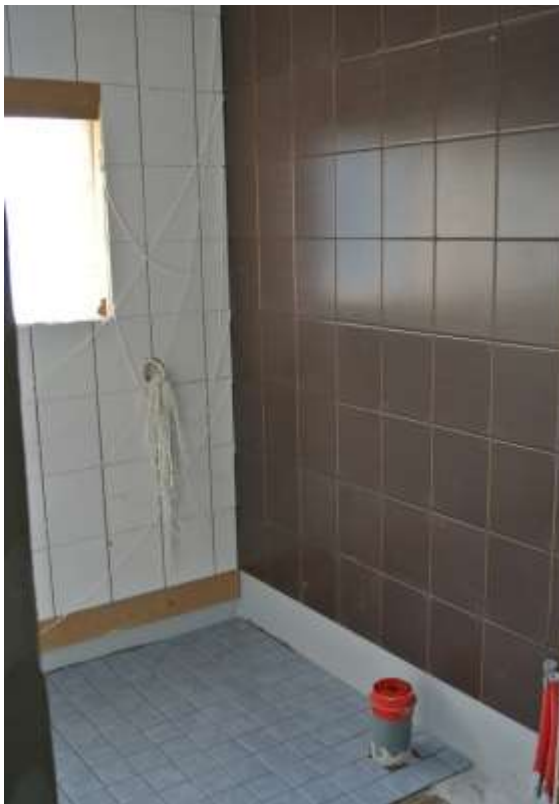
Kuva 39. Kylpyhuoneen laatoitus vielä kesken

Kylpyhuoneen seiniin tuli 200x250 mm laatta, joka oli valkoisen värinen muualla paitsi keittiön ja kylpyhuoneen välisessä seinässä, johon tuli samankokoinen mutta ruskean värinen laatta. Seinien jälkeen laatoitettiin lattia, johon tuli vaaleansinisen värinen 100x100 mm laatta, jotka olivat kuuden laatan rimpsuissa. Lattian jälkeen laatoitettiin helmat. Lopuksi seinät sekä lattiat saumattiin ja nurkkiin vedettiin silikonit.