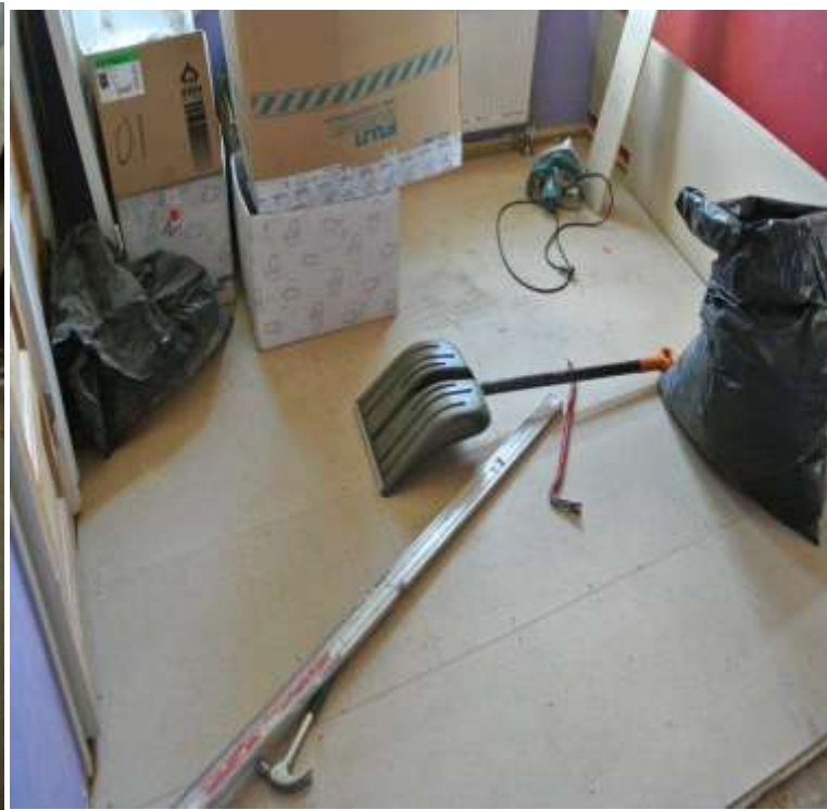
Kuva 26 ja 27. Laajennuksen ja makuuhuoneen lattiat levytettiin.