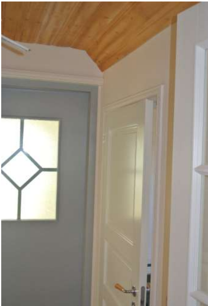
Kuva 41. Kylpyhuoneen ovi ja ulko-ovi.

Yläkertaan tuli osittain uusia ja osittain vanhoja ovia takaisin. Uusia ovia tuli kylpyhuoneeseen, koska siihen jouduttiin tilaamaan erikoiskokoinen ovi palkin takia. Palkin takia oviaukon korkeudeksi jäi 1 900 mm, joten ovi piti erikseen tilata tehtaalta. Uusia ovia tuli myös porrashuoneen ja eteisen väliin, johon tuli lukollinen ulko-ovi sekä eteisen ja olohuoneen välille, johon tuli uusi ovi. Makuuhuoneeseen ja vaatehuoneeseen laitettiin vanhat ovet. Ovet asennettiin kiiloja käyttämällä suoraan ja ruuvattiin kiinni runkotolppiin. Lopuksi vielä rungon ja karmin väli eristettiin polyuretaanivaahdolla.