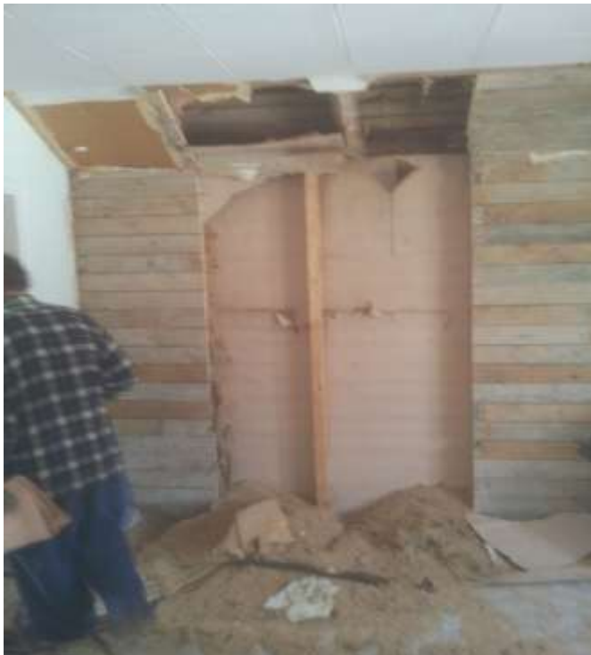
Kuva 3. Seinän purkamisesta.

Rintamamiestalon korotus- ja laajennustyö aloitettiin seinien purkamisella. Ensimmäisenä aloitimme purkutyön ullakon ja olohuoneen välisestä seinästä, jonka kohdalta oli myös tarkoitus alkaa varsinainen korotusosa. Aluksi piti repiä seinästä irti vanhat pinokopahvit, jonka jälkeen oli laudoitus. Laudoituksena oli käytetty vanhoja valumuottilautoja, jotka oli naulattu erittäin tiukasti kiinni. Laudoituksen jälkeen paljastui paperi, jonka takana olivat vanhat purueristeet. Vanhat purut tiputeltiin seinästä alas ja tämän jälkeen lapioitiin jätesäkkeihin ja viettiin vaihtolavalle. Mietimme myös imu-auton tilaamista purujen imemistä varten, mutta totesimme purumäärän olevan niin vähäinen, että sen tilaaminen ei olisi taloudellisesti kannattavaa. Purujen poiston jälkeen paljastui seinän runkorakenne, josta pystyimme toteamaan, että seinä ei kannata kattotuoleja, joten se voidaan purkaa pois ilman, että kattotuoleja tarvitsee ensin tukea. Seinärunko oli tehty 50*100 mm puutavarasta ja ne lähtivät lattianiskojen päältä ja päättyivät ruoteisiin. Seinärakenne oli myös toiselta puolelta samanlainen eli ensin oli paperi ja sen jälkeen tiheä laudoitus.