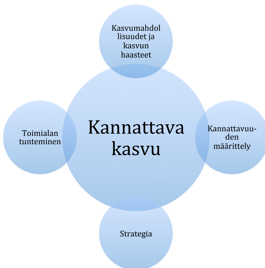
Kuvio 2. Teoreettinen viitekehys