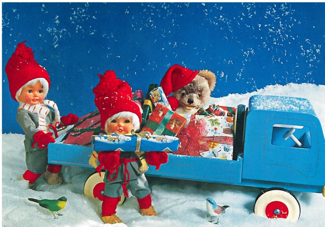
Figur 2. Julkort från 1960-talet