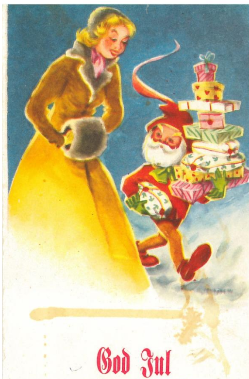
Figur 1. Julkort från 1950-talet

Resultaten kommer i kronologisk ordning från 1950-2000. Resultatet är uppbyggt så att följande saker har beaktats: individer, klädsel, rekvisita, utseende, färg och form, miljö och sinnesstämning, texter, budskap och material. Slutligtvis finns en sammanfattning av resultaten.