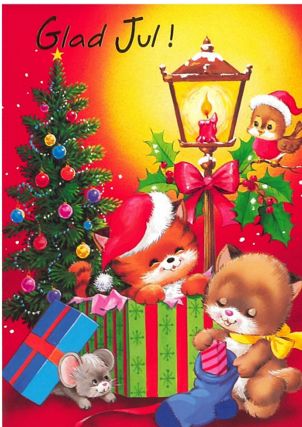
Figur 5. Julkort från 1990-talet