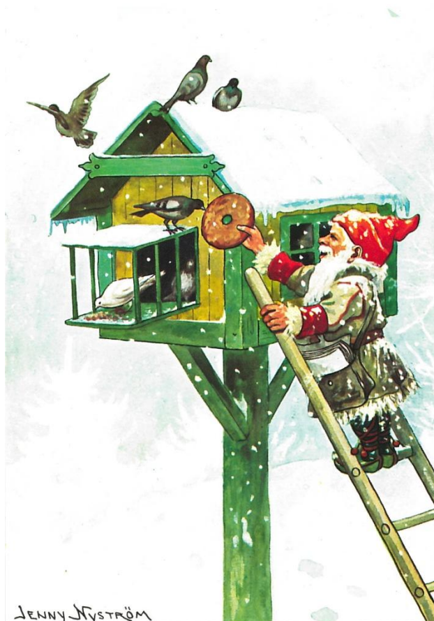
Figur 3. Julkort från 1970-talet