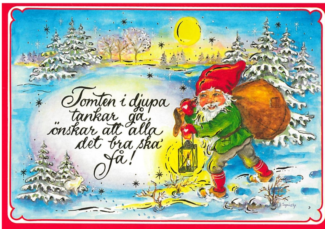
Figur 6. Julkort från 2000-talet