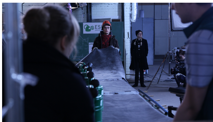
Lavastajat kastelukannujen liukuhihnaa testaamassa.

Käsikirjoituksen viimeinen versio oli lopulta 15 sivuinen. Virallisten kuvien lisäksi olin suunnitellut muutaman pakollisen lisäkuvan kuvaamisen jälkikäteen. Kuvauspäiviä näyttelijöiden kanssa meillä oli viisi, jonka lisäksi kuudentena päivänä ilman näyttelijöitä, jolloin kuvaisin tehtaalla erikoislähikuvia ja muuta tarvittavaa. Kuvauspäivät tulisivat olemaan mahdollisia, mutta kiireellisiä. Tämä vaati myös täysin aikataulussa pysymisen. Meillä oli noin karkeasti 15 kuvaa päivää kohden.