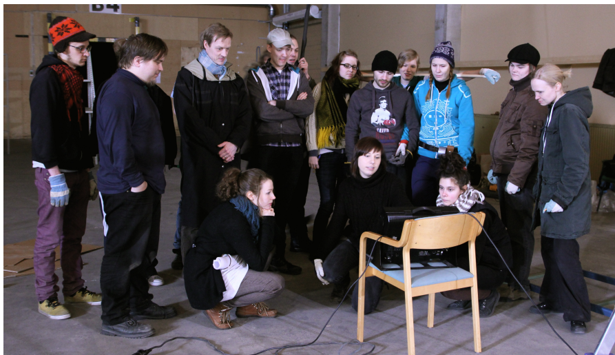
Työryhmä kamera-ajon onnistumista tsekkaamassa.

Kuvauksiin tuli noin kahden viikon tauko, jonka jälkeen kuvasin ohjaajan kanssa noin kymmenen lisäkuvaa. Halusin kuvata leikkausvaraa varten tehtaan ja rivitalon ulkopuolelta laajat esittelykuvat päivänvalossa. Lisäksi tarvitsimme tietokoneenruudusta erityislähikuvia videolla ja googlenäkymällä. Kuvamäärä lopulta oli noin 120 kieppeillä.