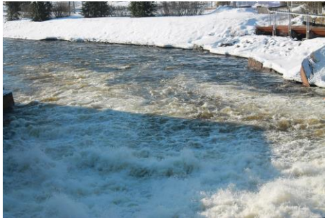
Kuva 9. Koski kuohuu

Seuraavan aamuna aamiaisen jälkeen lähdimme katsomaan Anjalan koskea, joka kuohui vapaana (kuva 9). Ilma oli kirkastunut ja aurinko paistoi, mutta tuuli oli raakaa