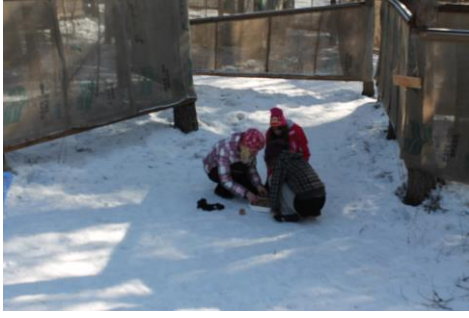
Kuva 10. Toinen joukkueista ratkoo sanatehtävää

Aamupäivällä ehdimme vielä leikkiä peilileikkiä ja lähettää Anjalan dinomaskotin maailmalle. Peilileikki: Yksi leikkijöistä on peili, joka seisoo selin muihin. Toiset asettuvat lähtöviivalle noin 20 metrin päähän peilistä ja yrittävät liikkua kohti peiliä. Peili kääntyy silloin tällöin, yllättäen, liikkujiin päin. Jos hän huomaa jonkun liikkuvan, tämä joutuu palaamaan takaisin lähtöviivalle. Se, joka ensimmäisenä ehtii kosketamaan peiliä ja huutamaan oman nimensä on seuraava peili.