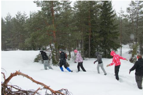
Kuva 7. Lumikenkäilyä vuorovedoin

Tämän osion tarkoituksen olivat ulkoilmatoiminnot, joita Telemäen (1998) mukaan ovat esim. vuorikiipeily, koskenlasku, hiihto, maastopyöräily jne. Valitsimme Anjalan nuorisokeskuksen ohjelmistosta lumikenkäkävelyn. Samalla saimme toteuttaa myös yksilöllisen haasteen, koska jokainen joutui opettelemaan yksilönä tämän uuden taidon. Siispä lähdimme kaikkien odottamalle lumikenkäkävelylle (kuva 7). Röntää satoi edelleen, ja keli ei ollut helppo. Kukaan meistä ei ollut aiemmin kokeillut lumikenkäkävelyä ja odotukset olivat korkeilla. Kävely tuntui aluksi rankalta, mutta tekniikan oppimisen kautta kävely tuntui askel askeleelta mukavammalta. Kuljimme jonossa tehden polkua metsään ja huomasimme, että polun alkupäässä oli paljon raskaampaa mennä kuin letkan viimeisillä, joilla oli jo valmis ura, missä edetä. Yhdessä päätimme, että jonon keulassa voi jokainen olla vuorollaan, mutta jos se tuntuu ikävältä ja raskaalta, ensimmäiseksi ei ole pakko mennä. Yksi osallistujista ei halunnut vetää jonoa. Poikkesimme katsomaan hevosia, jotka olivat varsinkin tyttöjen mieleen. Sen verran hauska kokemus se oli, että päätimme hankkia omaan perhekotiin lumikenkiä seuraavaa talvea varten. Me leirin aikuiset olimme dialogisuhteessa leiriläisiin ja kokemuksemme yhteisestä ohjaustilanteesta, jonka Anjalan nuorisokeskuksen ohjaaja meille tarjosi, oli meitä leiriläisiä yhdistävä kokemus.