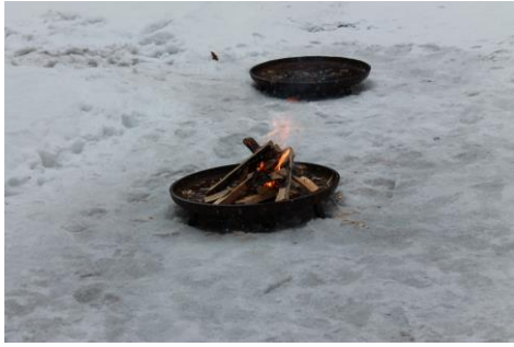
Kuva 5. Nuotio palaa

Nuotiodien sytyttämisen jälkeen saimme ryhmänä kokeilla, kuinka trangia kasataan (kuva 6) käyttökuntoon ja käytön jälkeen laitetaan säilytysvalmiuteen. Keitimme trangialla kuumaa mehua ja mehua kodassa juodessamme mietimme, mitkä olisivat ne viisi asiaa, jotka ottaisimme mukaan retkelle metsään ja viisi asiaa, mitä ei mistään hinnasta otettaisi mukaan. Tehtävään oli valmiita sanoja, joista saimme ryhmänä valita ja valinnan jälkeen perustella valintamme. Ryhmät saivat nopeasti asiat valittua ja esittelivät ne sitten perusteluineen toiselle ryhmälle. Kodalla yksi leiriläisistämme halusi vielä kokeilla nuotio sytyttämistä, joka sisätiloissa onnistuikin helpommin kuin tuulessa ja sateessa.