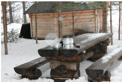
Kuva 6. Trangia odottaa kasaamista

Nuotiodien sytyttämisen jälkeen saimme ryhmänä kokeilla, kuinka trangia kasataan (kuva 6) käyttökuntoon ja käytön jälkeen laitetaan säilytysvalmiuteen. Keitimme trangialla kuumaa mehua ja mehua kodassa juodessamme mietimme, mitkä olisivat ne viisi asiaa, jotka ottaisimme mukaan retkelle metsään ja viisi asiaa, mitä ei mistään hinnasta otettaisi mukaan. Tehtävään oli valmiita sanoja, joista saimme ryhmänä valita ja valinnan jälkeen perustella valintamme. Ryhmät saivat nopeasti asiat valittua ja esittelivät ne sitten perusteluineen toiselle ryhmälle. Kodalla yksi leiriläisistämme halusi vielä kokeilla nuotio sytyttämistä, joka sisätiloissa onnistuikin helpommin kuin tuulessa ja sateessa.