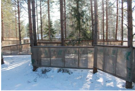
Kuva 3. Metsälabyrintti Kuka eksyy labyrinttiin? Hyvä muisti ja nokkeluus ovat avuksi, kun ratkotaan ryhmänä visaisia tehtäviä labyrintissa.

seuraavan päivän lumiriehan sijalle labyrinttia (kuva 3). Kukaan ei Anjalasta ollut näitä ehtoja meille aiemmin sanonut, vaan olivat kehottaneet meitä valitsemaan opaskirjasta sen toiminnan, minkä haluamme. Tämän ohjelman muutoksen jouduin välittämään leiriläisille, ja pieniä pettymyksen huokauksia tuli, varsinkin köydellä laskeutumisen poisjäännistä, mutta labyrintti kuulosti lähtijöiden mukaan mielenkiintoiselta.