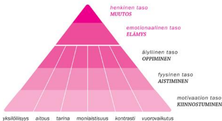
Kuva 2. Elämyskolmio 2009

Elämyskolmion on kehittänyt Lapin elämysteollisuuden osaamiskeskuksen tuotekehityspalvelu (kuva 2). Se on työkalu, jonka avulla voidaan arvioida tuotteen elämyksellisyyttä. Tämä on mielestäni ollut hyvä työväline oman elämysleirin suunnittelun ja toteutuksen mittarina. Osan teoriasta olen soveltanut sopivammaksi sosiaalialan käyttöön. Saman elämyskolmion löysin Seikkailen elämyksiä (2007) kirjasta, jonka Tarsanen ja Kylänen ovat siinä kuvanneet ja joiden tulkintaa käytän elämyskolmion avaamiseen.