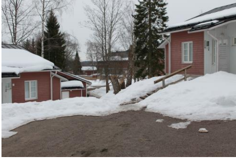
Kuva 4. Nuorisokeskus Anjalan pihapiiriä

Kiersimme alueen ohjaajan kanssa ja hän esitteli meille meidän käytössä olevat tilat ja välineet sekä alueella sijaitsevat rakennukset. Kierroksen ja majoittumisen jälkeen, menimme askartelutilaan, jossa jokainen osallistuja oli laatinut etukäteen oman tutustumis- ja ryhmäntymisleikin. Kaikki leirille osallistuneet nuoret olivat olleet aiemmin erilaisilla leireillä ja heillä oli erilaisia kokemuksia leireillä olosta. Yleensä leirit olivat olleet etukäteen ohjelmoitu, ja aikuisjohtoisia, eivätkä leiriläiset olleet päässeet itse vaikuttamaan leirin ohjelmaan. Leiriläisten puheista kumpusi innostus siitä, että leiri oli meidän yhteisesti suunnitelma ja vastuu leirin onnistumisesta oli meidän yhteinen.