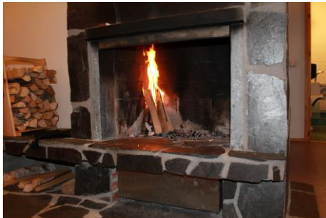
Kuva 8. Takkatuli roihuaa

Iltaohjelmana meillä oli varattuna saunatila. Kello 18.00 marssimme saunalle ja sytytimme päivällä oppimiamme taitoja hyödyntäen takkaan tulet (kuva 8). Olimme suunnitelleet yhdessä ohjelmaa illaksi. Saunoimme, kuuntelimme leiriläisten mielimusiikkia, paistoinimme makkaraa, tikkupullia ja vaahtokarkkeja. Leikkimielisissä kilpailuisissa; kynä pulloon leikki, tulitikunheittokisa, yhdyssanaleikki, Kimble-mestaruus, saimme kokeilla sekä taitoja että onnea (ks. liite 4). Loppuillasta pantomiimiesitykset ja niiden arvailu nousivat illan kohokohdiksi. Saimme arvuutella ammatteja ja tunnetiloja toistemme esittäminä. Esiintyminen ilman sanoja ja draaman käyttö osoittautui jälleen käyttökelpoiseksi ohjelmanumeroksi. Tämä toiminta tuki sosiaalistamisleikkijä.