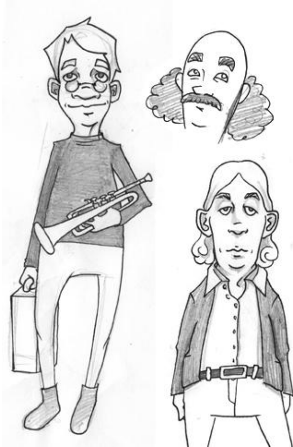
Kuva 1. Hahmoluonnoksia opettajasta. Vasemmanpuoleisena valittu luonnos.

Luonnostelin hahmot lyijykynällä paperille ja piirsin ääriiviivat mustekynällä. Luonnosteluvaiheessa keskityin lähinnä päähän ja kasvonpiirteisiin, joita pidin hahmojen tärkeimpänä osana. Kun luonnoksia oli tarpeeksi, annoin kirjan sisällöntuottajalle Sep-po Pohjoisaholle valtuudet valita häntä kiinnostavimmat hahmot. Pohjoisaho valitsi silmälasipäisen, hymyilevän miesopettajan, koska tämä näytti hänen mukaansa sympaattiselta. Muut hahmot jäivät vielä odottamaan, ja keskityin tähän ensimmäiseen valittuun luonnokseen. (Kuva 1.)