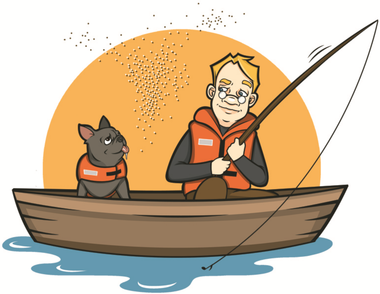
Kuvitus Hämä-hämähäkki -laulun neljänteen säkeistöön.