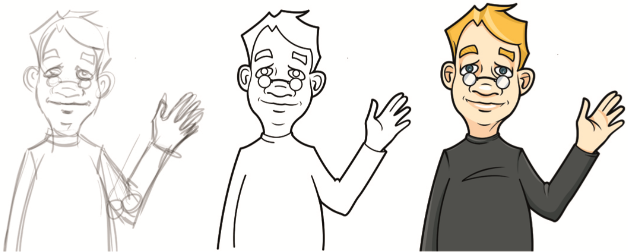
Kuvitusprosessin vaiheet: luonnos, ääriviivat, värit ja yksityiskohdat.