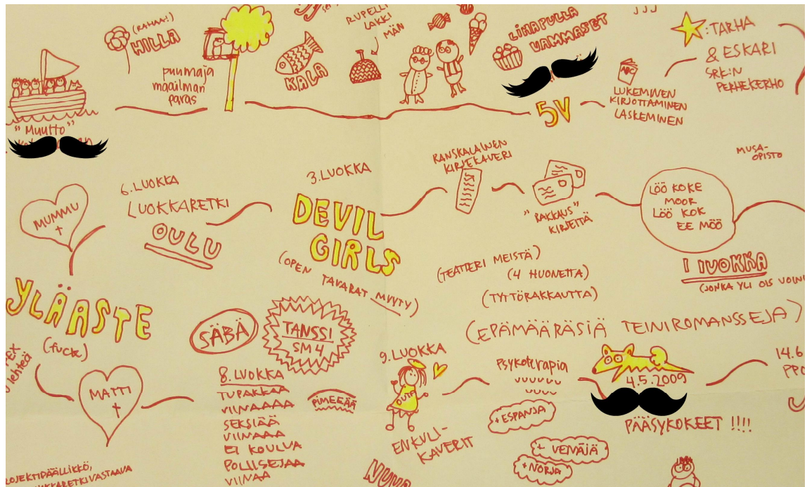
Kuva 1. Nuoren aikajana

vuotta hän on elämästään elänyt suhteessa ihmisen keskimääräiseen elinikään. Samalla nuorelle konkretisoitiin sitä, kuinka monta vuotta hänen elämästään hän on itse ollut itsestään vastuussa. Lapsuus- ja nuoruusiässä hänen valintoihinsa ja elämän kulkuun ovat vaikuttaneet hyvin voimakkaasti hänen vanhempansa. Aikajana toteutetaan yhdessä nuoren kanssa.