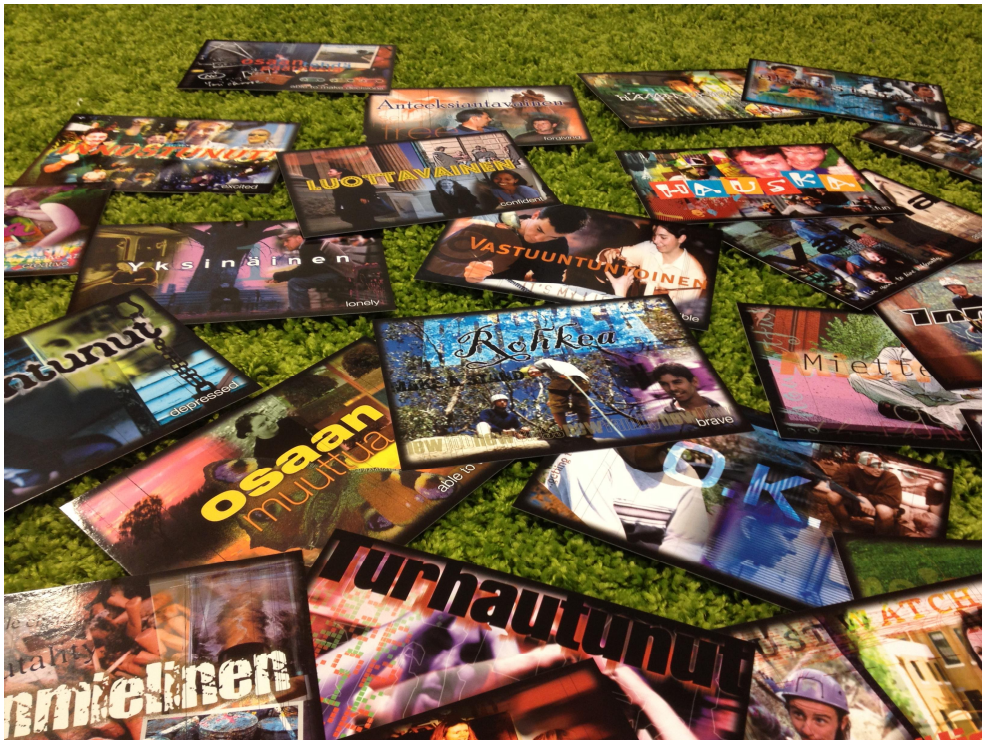
Kuva 3 Mun Stoori korttisarja

Opinnäytetyössäni nuoren kanssa käytettiin Mun stoori korttisarjaa prosessin viimeisellä tapaamiskerralla. Nuori sai valita kortteja, jotka hänen mielestään kuvasivat häntä parhaiten. Etsivät nuorisotyöntekijät valitsivat myös kortteja kuvaamaan sitä millaisena he näkevät nuoren niiden tapaamisten perusteella jolloin nuorta on tavattu. Työskentelyssä oli läsnä nuorta voimaannuttavia elementtejä. Valituista korteista käytiin keskustelua. Mun stoori korttisarjan kanssa työskentelyssä käytiin keskustelua pohjautuen myös aikaisempiin tapaamisiin ja esimerkiksi nuoren luonteen piirteistä keskusteltiin eri näkökulmista.