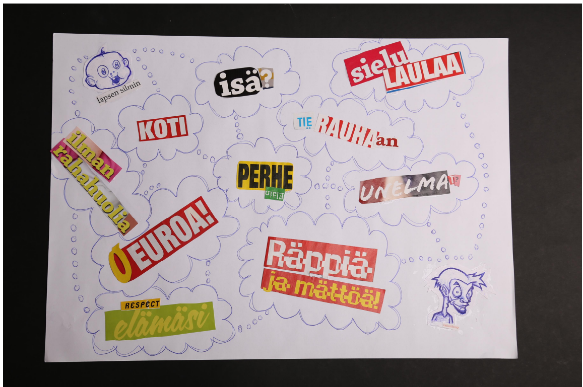
Kuva 2. Nuoren tekemä unelmakartta

Unelmakartta työskentelyn toteutimme nuoren kanssa siten, että nuori sai selata aikakausi lehtiä ja etsiä sellaisia kuvia ja lauseita joita hän haluaisi tulevaisuudessaan olevan. Nuorelle ei annettu tarkkoja ohjeita siihen millaisen unelmakartan hänen tulisi tehdä vaan hän sai toteuttaa sellaisen unelmakartan millaisen hän halusi. Työskentelyn aikana käytiin keskustelua tulevaisuudesta ja siitä millaisia asioita nuori elämäänsä haluaisi. Työskentelyn ilmapiiri pyrittiin luomaan mahdollisimman rennoksi ja avoimeksi, jotta nuorella olisi mahdollisuus jutella aivan tavallisista asioista ja toisaalta heittäytyä unelmoimaan omaa tulevaisuuttaan.