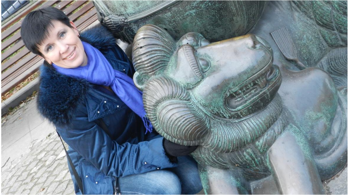
KUVA 17. Tässä kuvassa mallin pää on pikkuisen kallistunut, sekä olkapäät ovat hie- man käännetty.