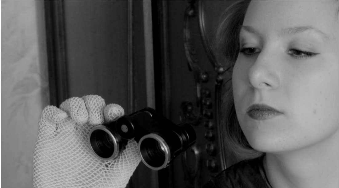
KUVA 7. Erikoisen kuvattavan objektin sijoittaminen ja katse, joka voi kertoa siitä, että nainen katsoo omaa tulevaisuuttaan.