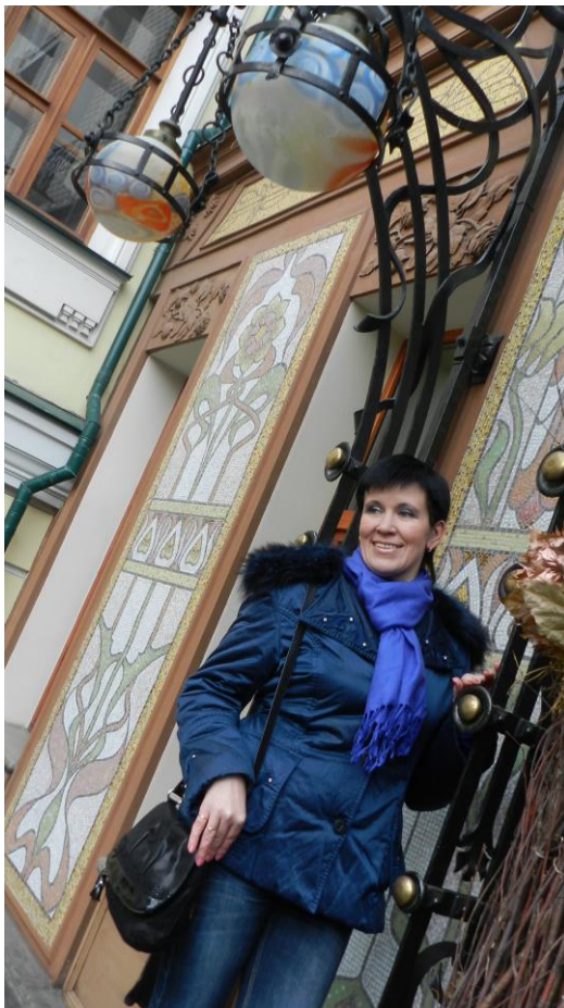
KUVA 8. Tässä sommitelussa kiinnitetään huomiota väreihin ja kameran korkeuteen.