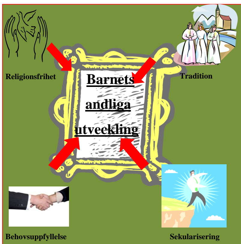
Bild 2. Faktorer som påverkar hur föräldrar upplever barnets andliga utveckling

Faktorer som påverkar barnets andlighet kan illustreras enligt följande (egenkomponerade) bild: