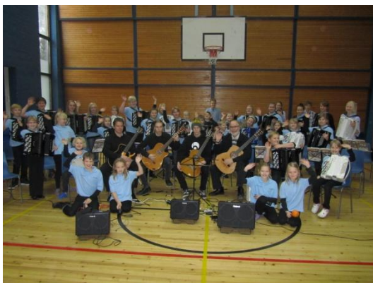
KUVA 2. Jokilaakson koulu: Junioriharmonikat ja kitararyhmä.