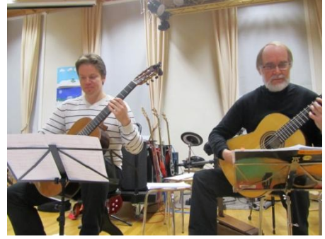
Kuva 6. Parhaillaan soi Sons de Carrilhoes LIITE 3.