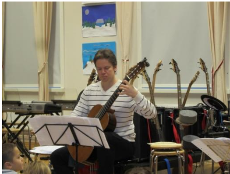
Kuva 7. Soolo kappaleiden tunnelmissa, El Negrito LIITE 3.

Mäntykankaan lapset olivat erittäin hyviä kuuntelijoita ja keskittyjiä. Lapset istuivat lattialla ja olivat selkeästi tottuneet tämän tapaisiin tilaisuuksiin. Myöhemmissä keskusteluissa koulun rehtorin, Tuija Kainun , kanssa kävi ilmi, että koululla on melko usein esittäväntaitteen ja musiikin toimintaa. Koulu on taidepainotteinen, joten lapset saattoivat kokea ja omaksua musiikin taiteenalana läheisekseen.