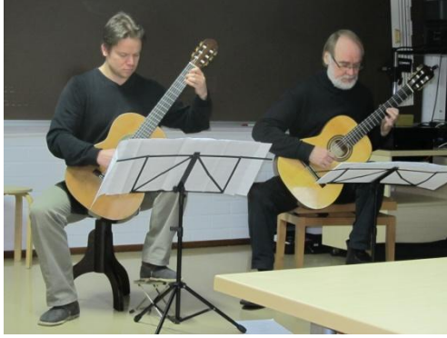
Kuva 1. Kitara duon tunnelmissa; Paraboles.