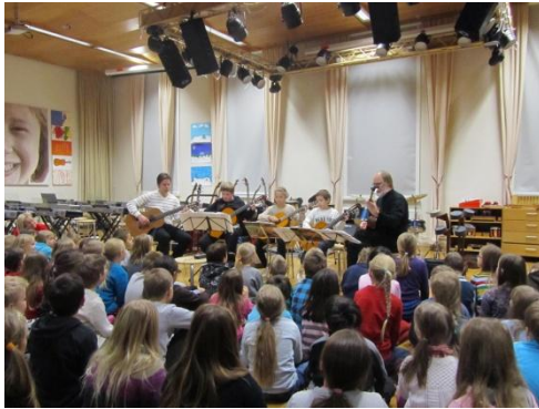
Kuva 3. Mäntykankaan koulun lapset kuuntelevat tarkkaavaisesti Kitarakvintetin tulkitsemaa musiikkia. Kuva 2012. LIITE 2.

Mäntykankaan alakoulun kaksi konserttia (KUVA 3 ja 4), 4.12.2013. Ensimmäinen konsertti (LIITE 2) alkoi klo 09.15, joka oli suunnattu 1-3 luokka oppilaille, kesto noin 35minuuttia josta soiva osuus oli noin 25 minuuttia. Ensimmäiseen konserttiin osallistui 2 Mäntykankaan ja 1 Hollihaan alakoulun oppilas. Heidän kanssaan soitimme 3 kvintetille sovitettua kappaletta. Annalan kanssa soitimme myös duoja ja soitin vielä 2 soolokitaralle sävellettyä musiikkia.