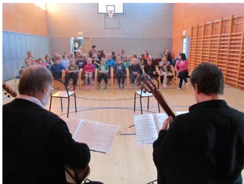
KUVA 6. Öjan alakoululla soitinesittelykonsertissa.