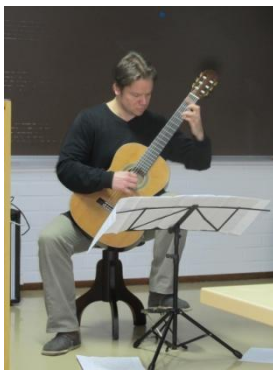
Kuva 2. Oppilaat kuulevat kappaleen; Aria con Variazioni detta la Frescobalda.