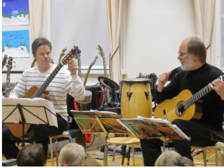
Kuva 5. Duo kappaleisiin valmistautumista. LIITE 3.