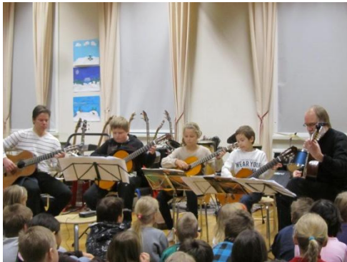
Kuva 4. Kitarakvintetti.