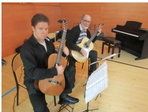
KUVA 4. Valmistaudumme Öjan konserttiin. Kuva 2012.