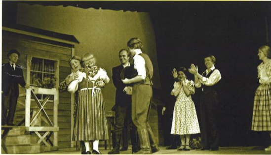
TALKOOTANSSIT Savonlinnan Teatterissa 1976.

Savonlinnan Teatteri (–1978 ja 2007–) esittää Talkootansseja nyt siis jo toista kertaa, mutta tällä kertaa kesäteatteri Putkinotkossa. Vuoden 1976 esitys sai ensi-iltansa sisätiloissa ja kesäksi se siirrettiin Kasinonsaaren