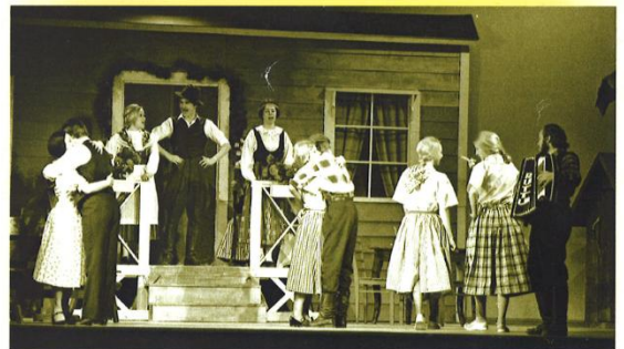
TALKOOTANSSIT Savonlinnan Teatterissa 1976.

Teatterinjohtaja, ohjaaja Tiina Luhtaniemi