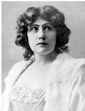
KUVA 3. Aino Ackté (Aino Ackté 2013).