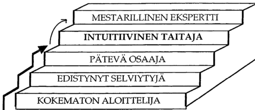
Figur 2. Trappstegsmodell (Hämäläinen 1999, 105)

”Kokematon aloittelija” betyder på svenska ”oerfaren nybörjare”. Hämäläinen (1999, 105) vill inte använda benämningen novis eftersom muskläraren inte är någon novis inom musikutövning då denne oftast inlett sina musikstudier redan som barn. På detta trappsteg kännetecknas dirigenten av osmidighet, brist på rutin samt oförmåga att reagera på förändrade situationer.