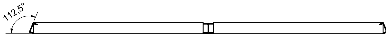
A-A ( 1 : 25 )