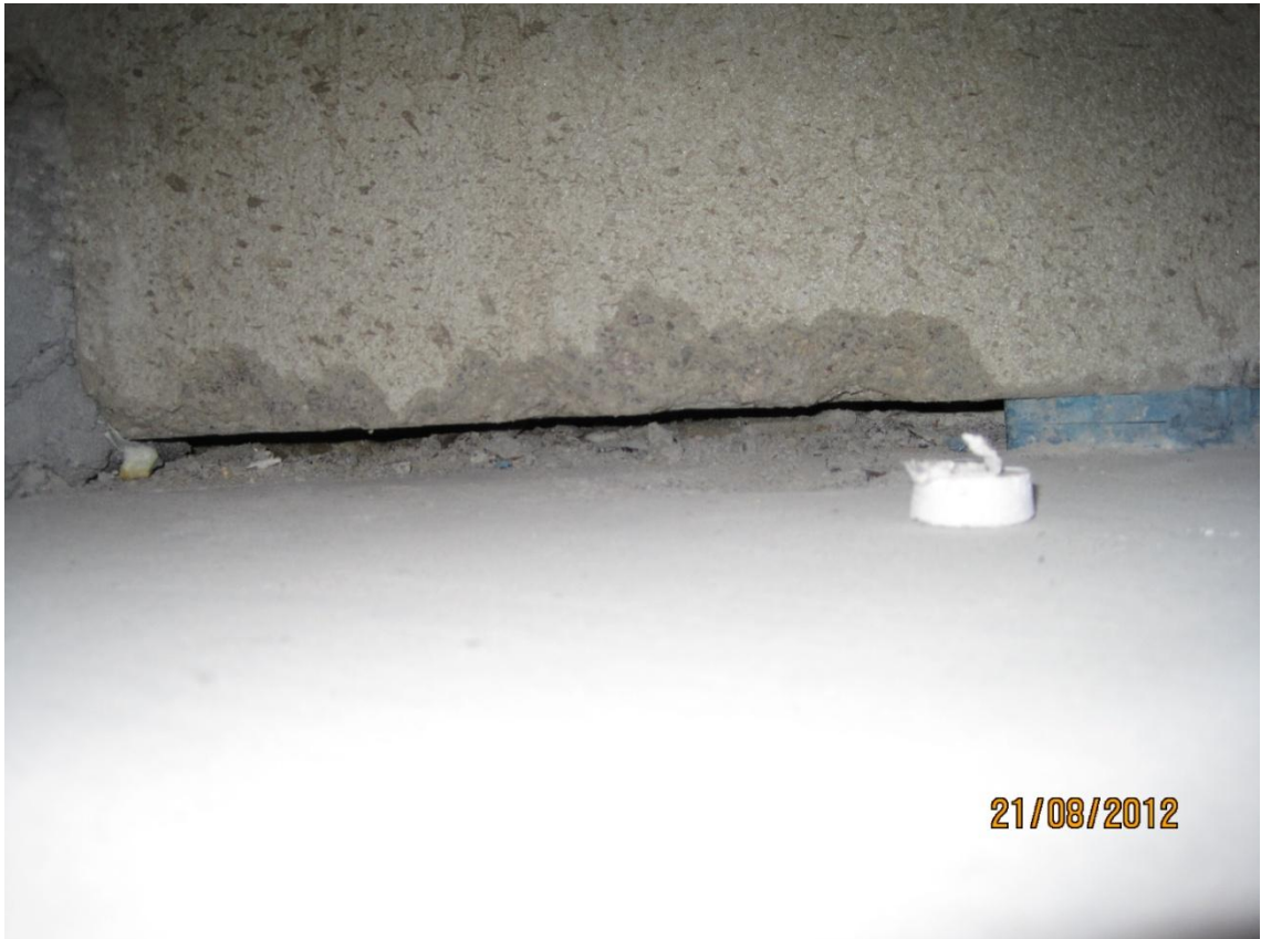
Kuva 1. Julkisivuelementin asennuslaastiaines on vajaata.