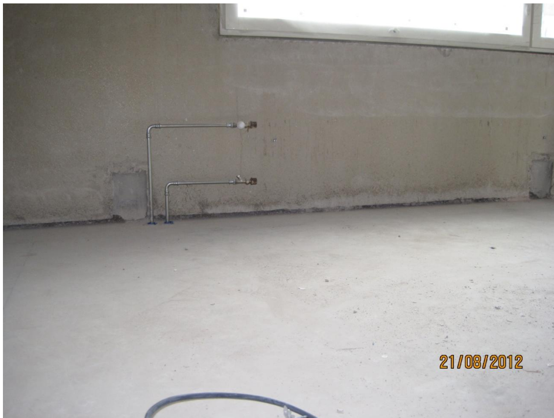
Kuva 5. Julkisivuelementin saumalaastia, elementin asennuskolot esitäytetty.

imurointi ja elementtisauman täyttö lähes seinäpinnan kanssa tasan. Työn suorittaminen hankaloituu olennaisesti, kun lämpöpatteriputkivedot on vedetty ja lämpöpatterit on asennettu, joten virheiden korjaus tulisi suorittaa pikimmiten.