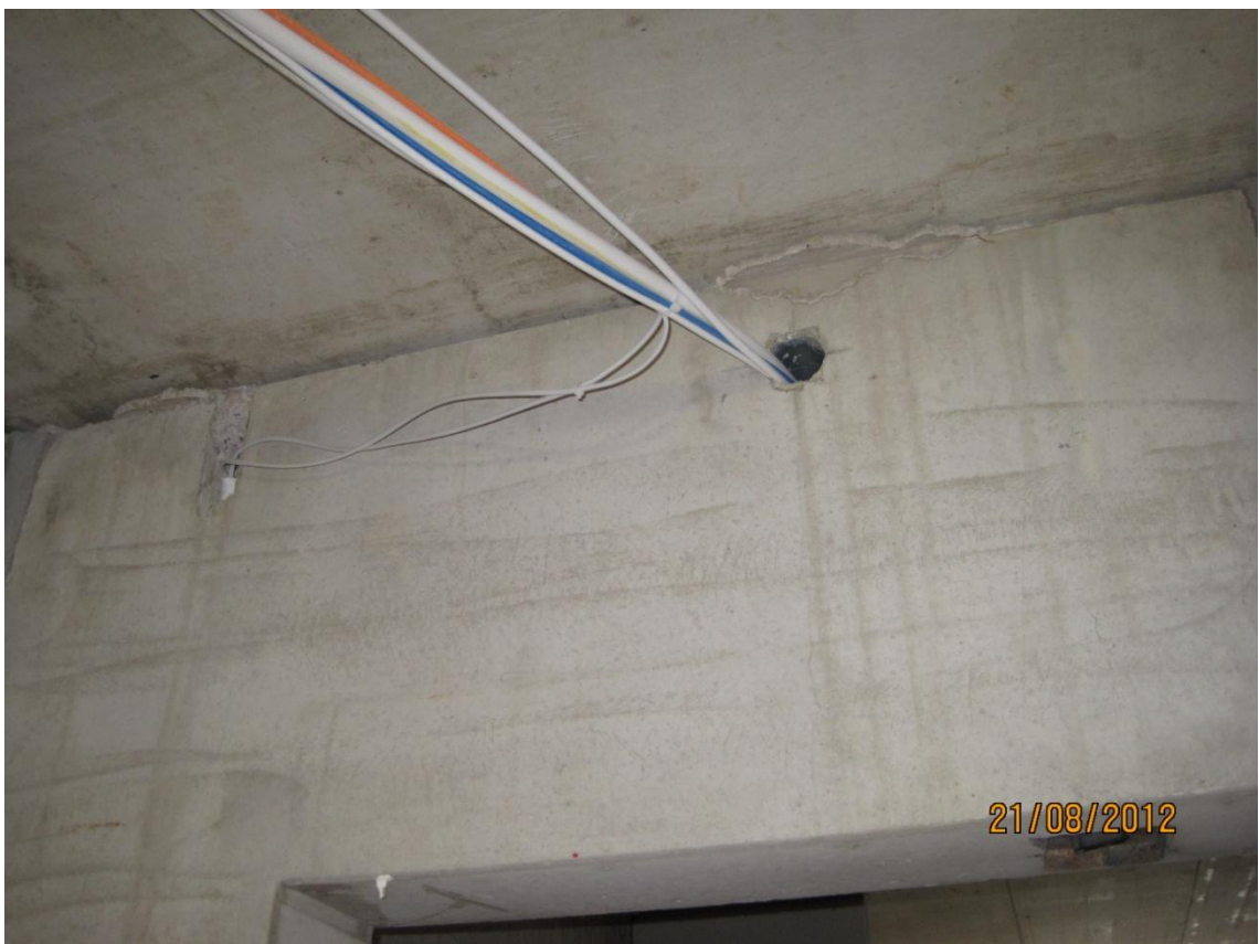
Kuva 6. Käytävältä huoneistoon vievä saumaus on vajaata.

Esimerkkikuvassa (kuva 6) katonrajassa elementin vaakasaumasta puuttuu suurelta osin sauma-aines. Holvivalun yhteydessä on syntynyt betonipurseita, jotka on piikattava pois vähintään seinälinjan mukaisesti. Saumaustyövaihe on kuvan tapauksessa unohtunut ja on nyt paljon hankalampi suorittaa sähkövetojen vuoksi.