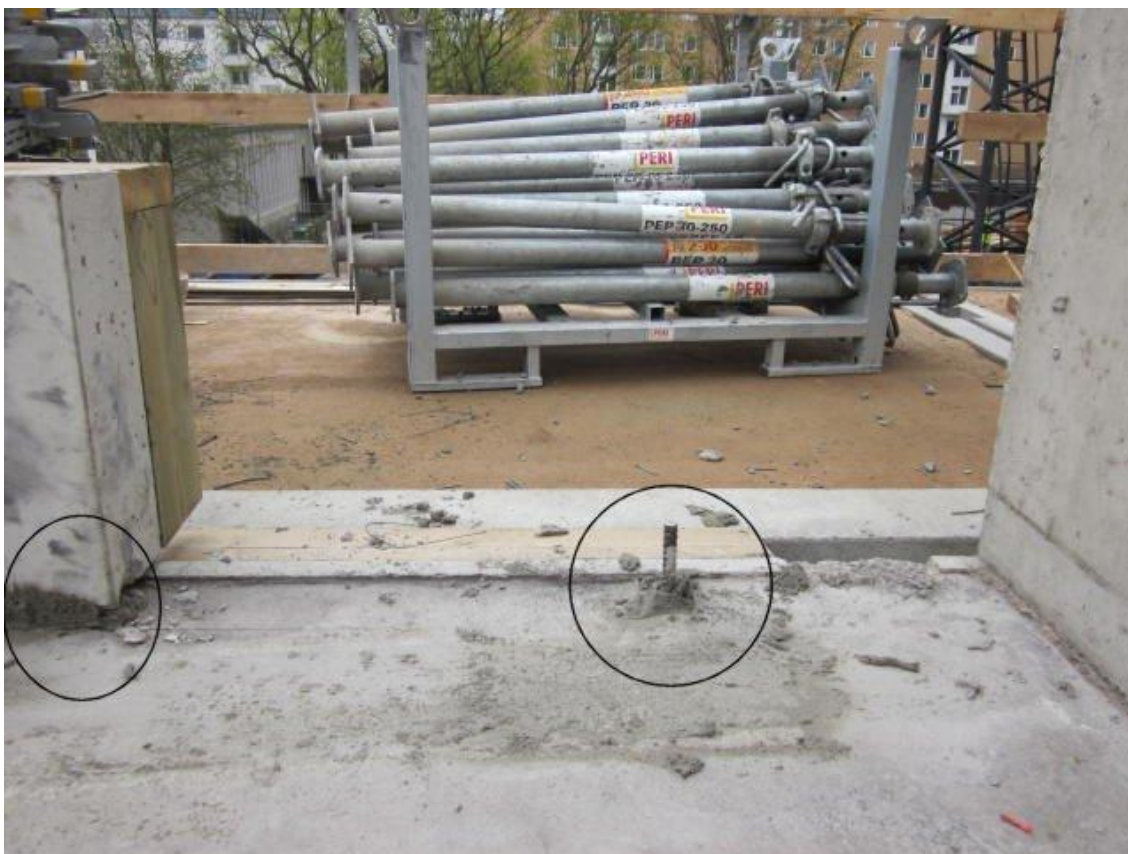
Kuva 4. Sauma-ainesta on liikaa vasemmalla näkyvässä elementissä. Tarpeeton tartuntarauta aiheuttaa lisäksi vakavan työturvallisuusriskin.