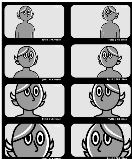
Kuva 1. Kuvakoot (Mediakompassi, YLE)