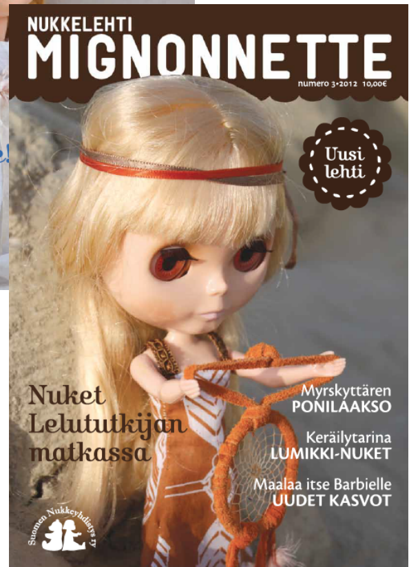
Kuva 1. Suomen Nukkeyhdistys ry:n jäsenlehden kansi ennen uudistusta ja sen jälkeen