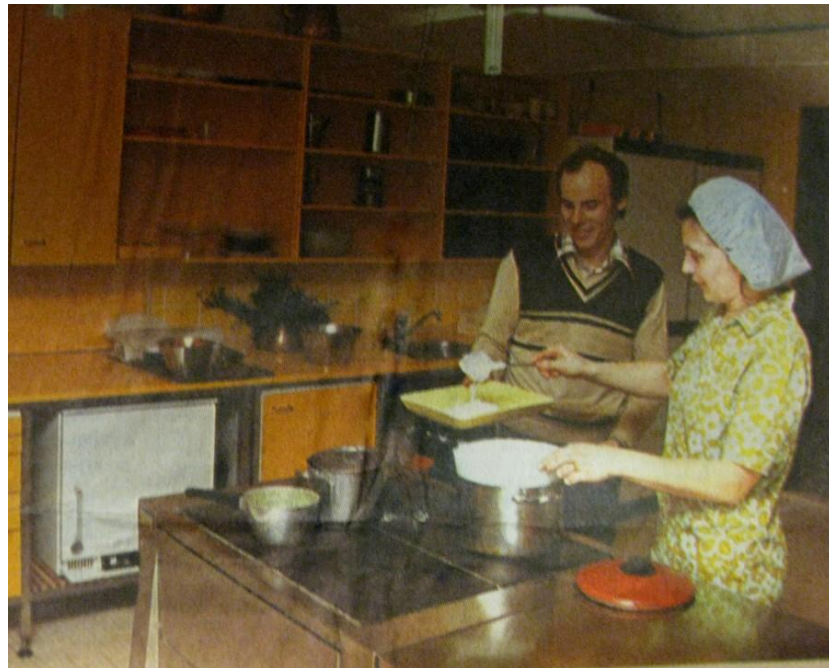
KUVA 3. Keittiö oli lastenkodin sydän (Jyväskylän kaupungin arkisto, n.d.)

Kyllä meillä oli semmonen lempi... On semmonen vihko ihan, et mä laitoin seinälle, et jokainen saa mitä ne haluaa toivoo, että toivomuslista. Ja sitten välillä aina tehtiin niin, et joku päivä, et tehään, et se nuori tulee tekeen sen ruuan. Yleensä kun se nuori tuli sinne keittiöön, niin kysyin ensteks, että minkä se haluaa tehdä, onkse, se on hänen juttusa nyt kokonaan tehdä se päivä. Et kyllä ne yleensä aina tehtiin mitä ne nuoret... Mikä oli joku, et mummo on tehny läskisoossia, et voisitsä nyt sitä tehdä. No mitäs siinä tehään läskisoossia, kun mummunikävä tuli. Se helpottaa sillon.