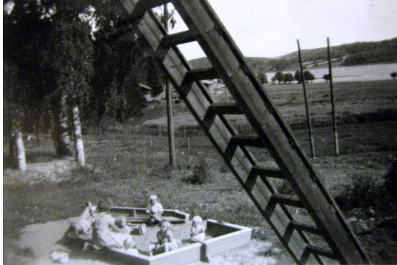
KUVA 6. Lastenkoti oli varakoti

olemassa lapsen auttamiseksi. Lapselle häntä hoitavat aikuiset eivät ole vain virkamiehiä, vaan oikeasti ihmisiä, joista hän on riippuvainen ja joihin hän rakentaa suhdetta. (Niemelä 2005, 57.)