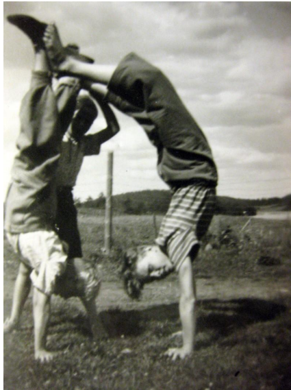
KUVA 4. Lastenkodin poikia

Myllyjärvelle muutettaessa lastenkodilla oli kaksi osastoa, Tyynelä ja Pekkala. Alussa molemmilla osastoilla oli kahdeksan lasta ja viisi ohjaajaa. Viiden ohjaajan lisäksi oli yksi yötyötä tekevä ohjaaja. Haastateltavamme kertoivat, että entisen Häkkisen lastenkodin isompien lasten puoli siirtyi Myllyjärvelle ja pienempien lasten puoli jäi vielä Häkkisiin. Sittemmin pienten puoli muutti nykyisen Mattilan perhekodin tiloihin rakennuksen valmistuttua vuonna 1981. Myllyjärvelläkin on kuitenkin ollut myös hyvin pieniä, vauvaikäisiäkin lapsia, sillä Mattilan ollessa täynnä vauvoja saatettiin sijoittaa Myllyjärvelle.