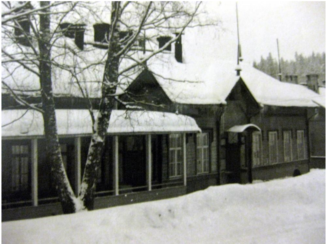
KUVA 1. Häkkisen lastenkodin julkisivu

Seuraavan kerran lastenkodin siirtymistä parempiin tiloihin käsiteltiin vuonna 1930. Tuolloin uutta lastenkotia ei kuitenkaan vielä päätetty rakentaa, vaan se päätettiin väliaikaisesti siirtää Aholaitaan elokuussa 1935 odottamaan parempia tiloja. Väliaikainen olo Aholaidassa jatkui ilman muutoksia vuoteen 1946, jolloin asetettiin jälleen toimikunta pohtimaan ahtaan Aholaidan ongelmia. Toimikunnan työn tuloksena syntyi päätös, että Aholaitaa olisi laajennettava ja myöhemmin rakennettava uusi lastenkoti. Tuolloin Häkkisissä toimi jo pieni erillinen lastenosasto, joka ei ollut enää tarkoituksenmukainen sosiaaliministeriön lastensuojelutarkastajan mukaan. Pohdittiin eri vaihtoehtoja lastenkodin sijoittumiselle, mutta seuraava toteutunut ratkaisu oli kuitenkin se, että lastenkoti siirrettiin tilapäisesti Häkkisen kunnalliskodin rakennuksiin 15.5.1951. Aluksi Häkkisen lastenkodissa oli tilaa 42 lapselle, kunnes vuonna 1975 lastenkoti muutettiin 30-paikkaiseksi. (Mt.)