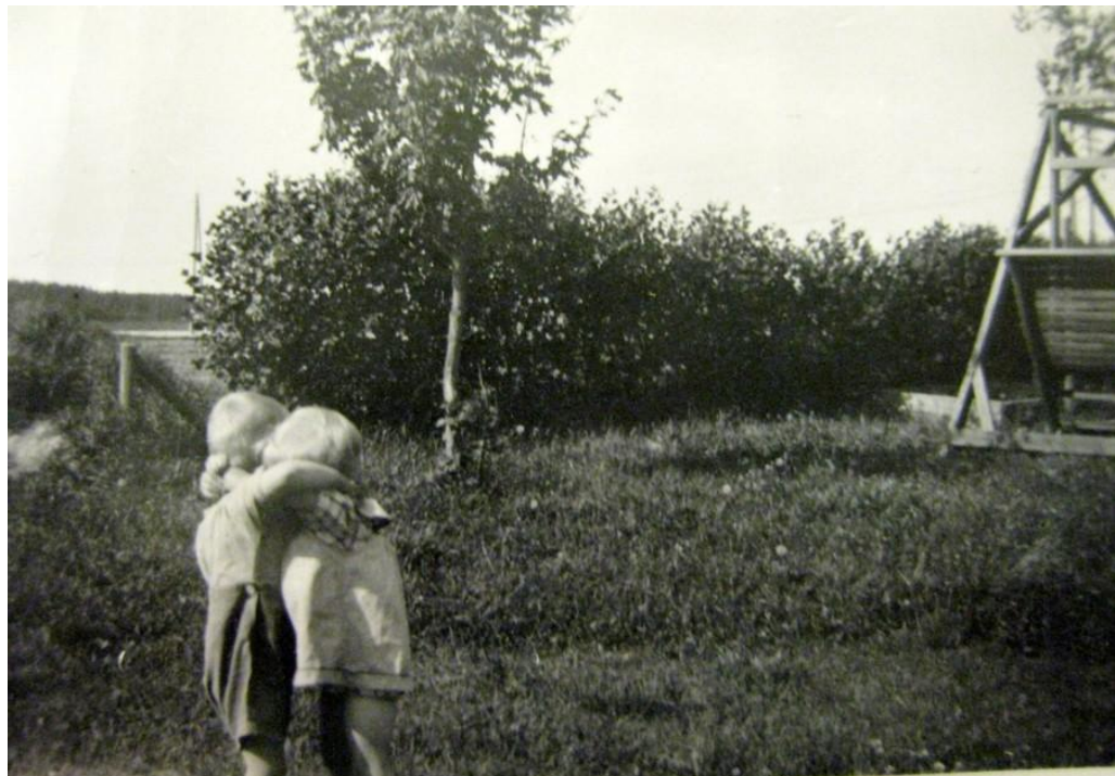
KUVA 9. Häkkisen aikaan lasten suhteet toisiinsa olivat sisarusmaiset

Ja nuorten keskinäiset suhteet niin sen vanhan lastenkodin aikaan sehän, kyllähän ne eli siinä vähän niin kun isossa perheessä. Musta se näky hirvittävän hyvin se vanhan ajan systeemi, kun meil on ollu näit...muutama semmone tilanne, missä nää vanhat nuoret on pystyny tapaamaan toisiaan. Oli aikanaan, kun mehän on pidetty 20-vuotis juhlat noin kymmenen vuotta sitten, et sinne tuli paljon nuoria, joille laitettiin kutsuja ja niille se oli aivan mielettömän hieno tapaaminen ja kuinka oli niin kun nauttivat siitä kun näkivät ja kuulivat toisistaan ihan niin kun jotkut sukulaiset tapais jossain sukujuhlassa.