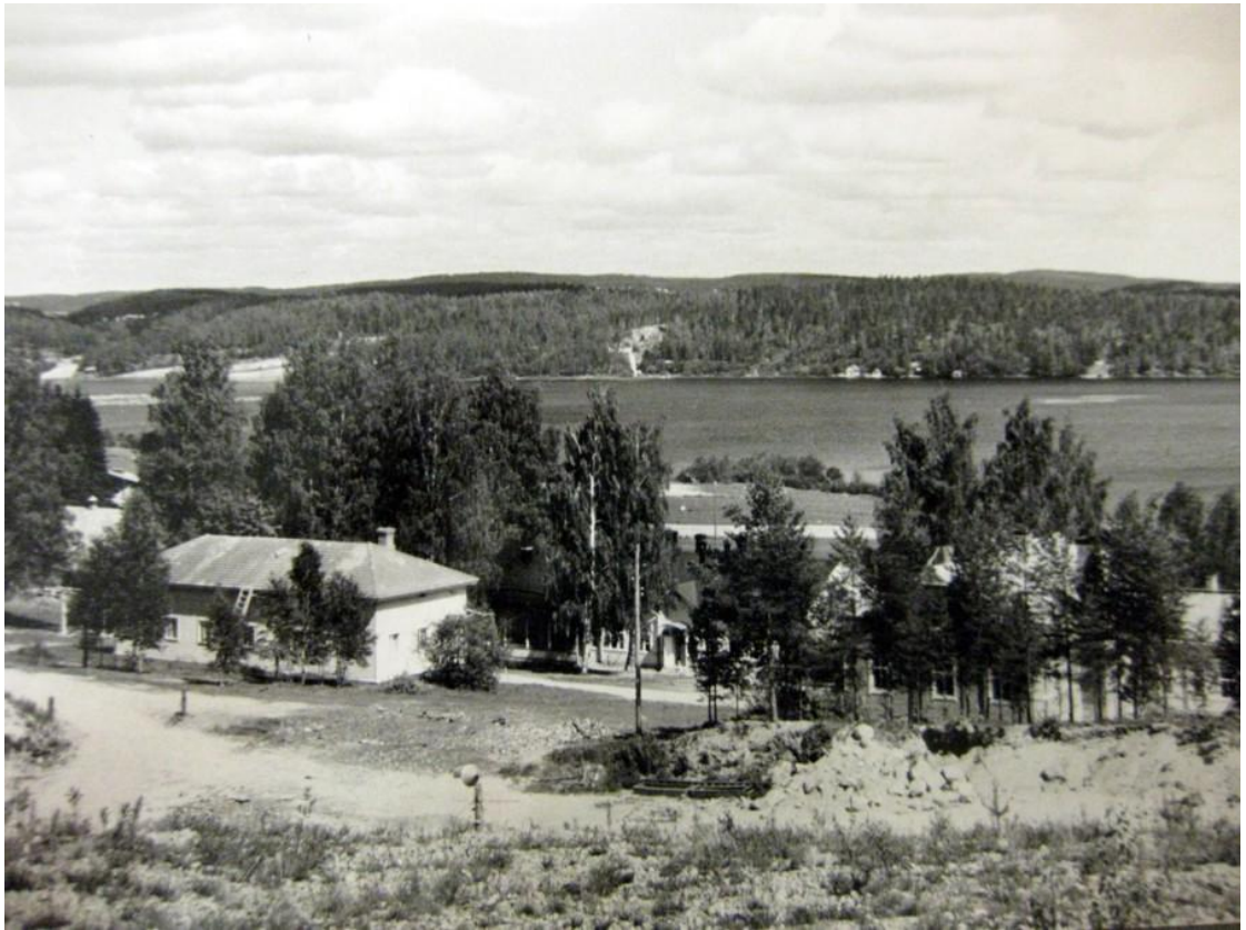
KUVA 2. Häkkisen lastenkoti sijaitsi luonnon keskellä (Jyväskylän kaupungin arkisto, n.d.)

Alun perin lastenkoti siirrettiin Häkkisiin väliaikaisratkaisuna, mutta tämä ”väliaikainen” lastenkoti toimi 28 vuotta. Tilaa arvostettiin työntekijöiden ja lasten keskuudessa suuresti. Häkkinen oli keskellä luontoa, siellä oli suuri piha, omat kasvimaat ja oma ranta. Tekemistä ja harrastusmahdollisuuksia riitti omassa pihassa eikä ulkopuolisia häiriötekijöitä juurikaan ollut. Eräs haastatelluista kuvailee ensimmäistä saapumistaan Häkkisille seuraavasti: