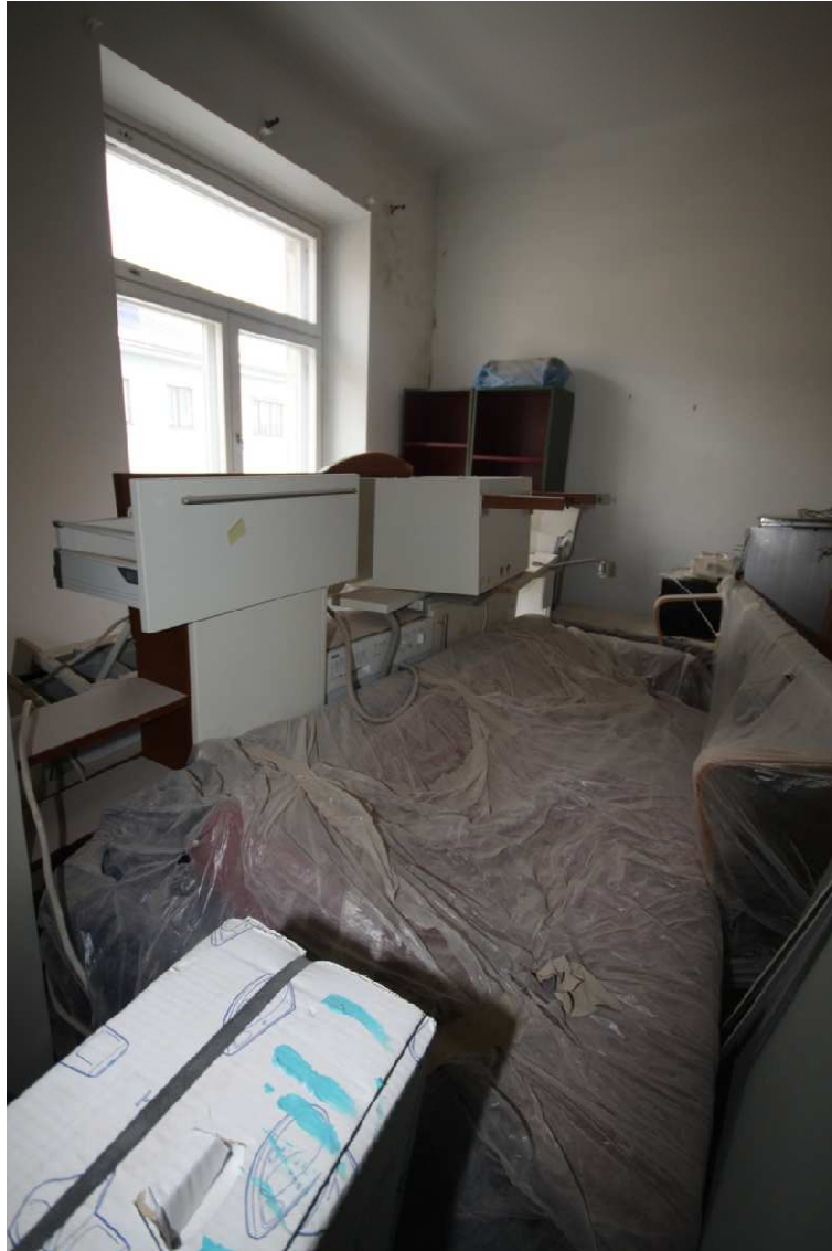
Kuva 1 Kalusteita As. Oy Roinilan työmaalla töiden alkaessa

Näiden kokemusten perusteella asunnot tulisikin videokuvata ennen suojaustöiden aloittamista, videolle jää talteen huomattavasti enemmän informaatiota kuin valokuviin. Yleensä riittää kun kävelee videokameran kanssa asunnon lävitse selostaen havaintojaan, kuvaten myös lattiat ja katot. Videokuvauksen yhteydessä tulee muistaa selostaa havaintoja kameralle, pienet halkeamat ja kolhut eivät välttämättä videokuvasta erotu, niinpä videolta kuuluva puhe on tärkeä osa onnistunutta dokumentointia. Erityistä huolellisuutta tulee noudattaa purettavien ja takaisin asennettävien kalusteiden, kuten keittiökaluksien, kohdalla. Monesti kalusteiden järjestystä tai muuta asennustapaa tulee tarve tarkastaa ennen takaisinasennusta, tällöin huolellinen dokumentointi säästää huomattavasti aikaa kun oikea asennustapa selviää videolta katsomalla. Oikeaa asennusjärjestystä ei tarvitse kokeilla paikan päällä tai pyytää asukasta katsomaan, miten