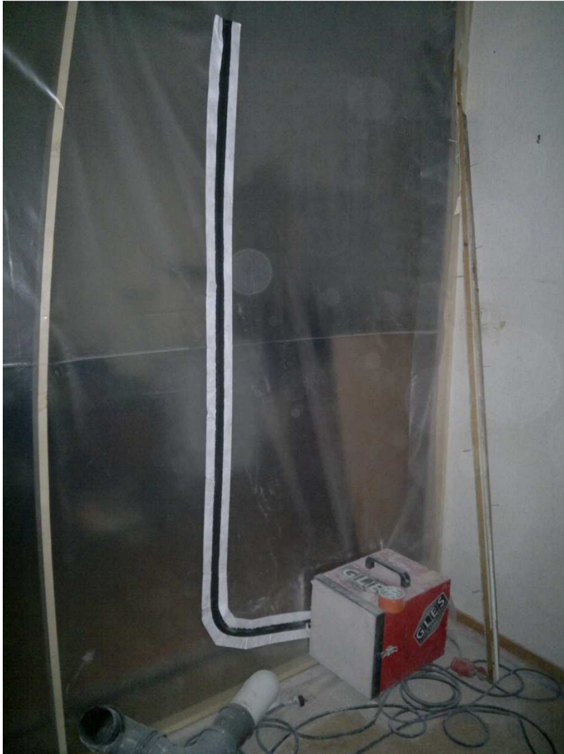
Kuva 4 Suojaseinä ja alipaineistaja Mechelininkadun työmaalla

Normaaliin ulospuhaltavaan alipaineistukseen nähden HEPA-suodattimellisen alipaineistajan suurin etu tavanomaisissa purkutöissä lienee lämpöhukan minimoiminen. Talviaikaan ulospuhaltava alipaineistaja aiheuttaa todella suuren lämpöhukan, normaalisti linjasaneeraustyömailla käytettävät mallit siirtävät ilmaa 500 – 4000m 3 tunnissa. Suuri lämpöhukka aiheuttaa merkittävän kasvun lämmityskustannuksiin, asumis- ja työskentelymukavuuden heikentymisen, sekä mahdollisia vaurioita pintamateriaaleissa lämpötilan vaihdellessa voimakkaasti. Ulospuhaltavan alipaineistajan yhtenä huonona puolena voi mainita vielä poistoputken. Vaikka poistoputket ovat pääasiassa helposti siirrettävää muovisukkaa, vie putki tilaa yllättävän paljon, sekä sen asettelu asuntoon