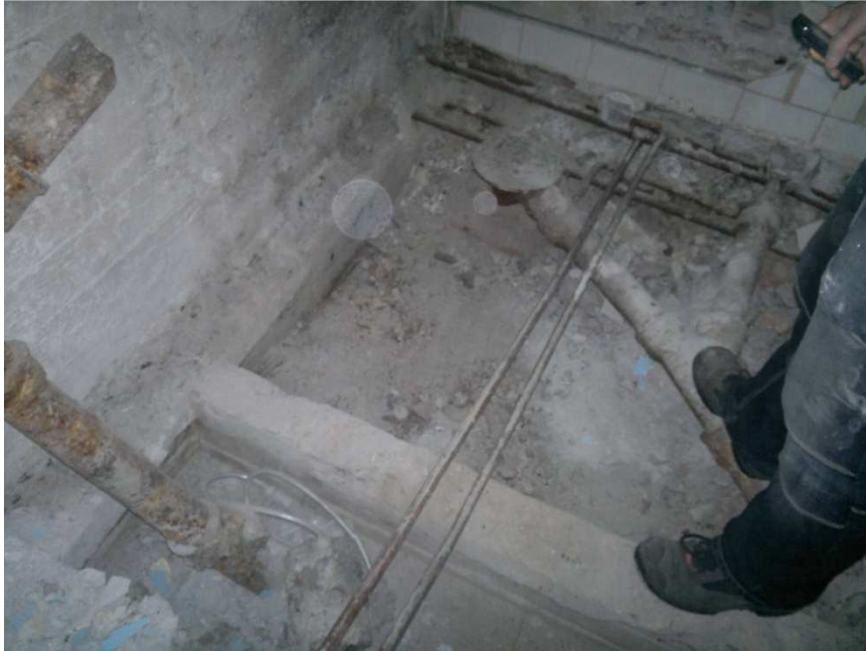
Kuva 2 Purettu kylpyhuoneen välipohja Mechelininkadun työmaalla

Työmaalla oli harkittu myös purkuputken käyttämistä jätteen siirtämiseksi lavalle, mutta tilaaja kielsi purkuputken käytön pölyämiseen vedoten. Kuvassa 2 näkyy purettu kylpyhuoneen välipohja, josta on poistettu sekä betoninen ylälaatta, että rakennusjätteestä ja maa-aineksesta koostunut täyttömateriaali.