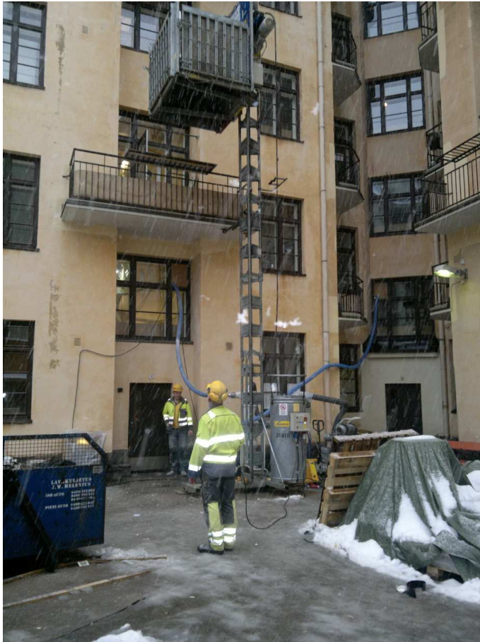
Kuva 3 Rakennushissi Mechelininkadun työmaalla

leista kuljetettaisiin hissillä, olisivat siirtokustannukset noin 15 300 euroa pienemmät, kuin kaikki portaita pitkin kantamalla. Tällöin rakennushissiä siirrettäisiin purkutöiden edetessä. Samalla kun purkujätteitä tuotaisiin alas, vietäisiin laastit, vedeneristeet ja laatat asuntoihin valmiiksi, jotta portaita pitkin ei tarvitsisi kuljettaa suuria määriä raskaita tavaroita.