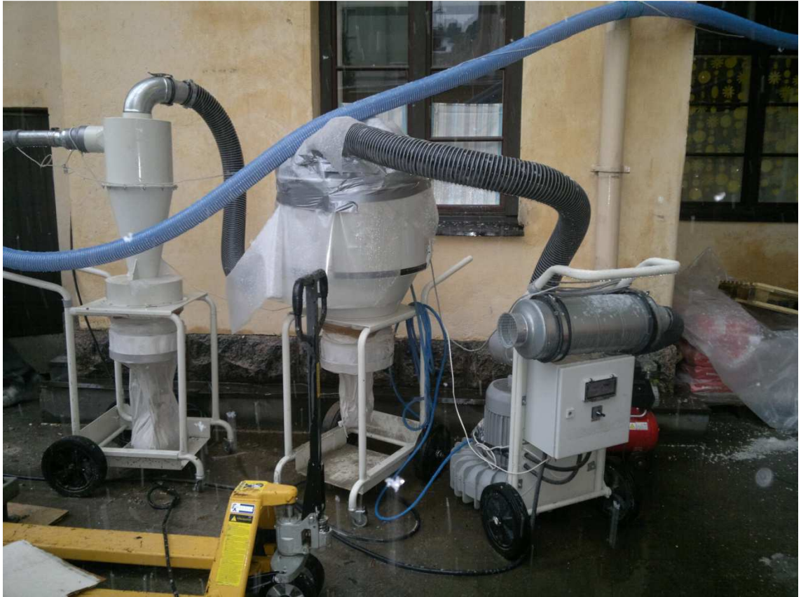
Kuva 6 Keskuspölynimurin ulkoyksikkö Mechelininkadun työmaalla

Kaikentyyppisissä rakennuksissa keskuspölynimuri ei kuitenkaan ole teollisuuspölynimuria parempi vaihtoehto. Korkeissa taloissa, joissa on vähän porrashuoneita, keskuspölynimuri on parhaimmillaan, mutta matalissa taloissa joissa on useita porrashuoneita muodostuvat keskuspölynimurin siirtämisestä aiheutuvat kustannukset todella suuriksi. Lisäksi jos useammassa porrashuoneessa on työt käynnissä samaan aikaan, joudutaan keskuspölynimurin lisäksi työmaalle ottamaan myös teollisuuspölynimureita, tai useita keskuspölynimureita. Keskuspölynimurin käyttöä tulisi harkita tapauskohtaisesti kulloisenkin työmaan vaatimusten mukaan, pääsääntöisesti jos talo on yli kolmikerroksinen ja työt ovat käynnissä pääasiassa yhdessä portaassa kerrallaan on keskuspölynimuri oikea valinta. Mikäli talo on enintään kolmikerroksinen on teollisuuspölynimuri usein parempi vaihtoehto, varsinkin jos talo on malliltaan sellainen että keskuspölynimurin keskusyksikköä joudutaan siirtämään aina porrasta vaihdettaessa.