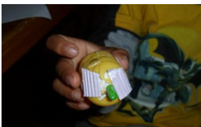
Kuva 10 Askartelua, rasti 20.

-Tavoite: Kädentaitojen harjoittelu yhdessä. Vanhemmat auttavat lapsiaan, ja luovat yhteisiä "taideteoksia" haluamistaan materiaaleista. Mielikuvitus kehittyy, kun tekeminen ei ole rajoitettua.