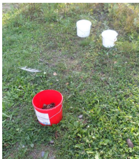
Kuva 3 Heittopiste, rasti 2

RASTI 3: SADUTUS: Ota paperia ja kynä tästä. Pyydä lastasi kertomaan satu. Satu voi olla pitkä tai lyhyt ja kertoa mistä vaan. Kirjaa satu ylös sanasta sanaan ja lue se lopuksi lapsellesi. Lapsi saa korjata satua lopuksi jos haluaa. Jos sadut kerronnassa