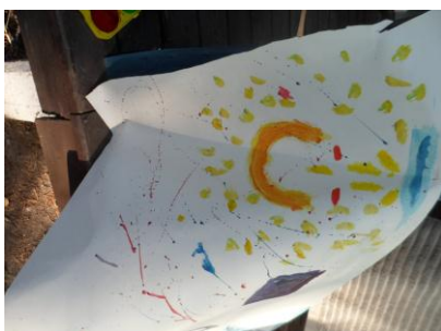
Kuva 8 Maalaus, rasti 19.

-Tavoite: Jokainen saa ilmaista itseään, joten aihe on vapaa. Jokainen saa käyttää luovaa puoltaan, ja kokea onnistuvansa. Vanhemmat auttavat pienempiä lapsiaan ja vuorovaikutus lisääntyy.