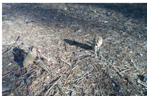
Kuva 5 Käpylehmiä, rasti 7.

-Tavoite: Vuorovaikutus, toinen parista voi opettaa toiselle, miten käpylehmä tehdään.