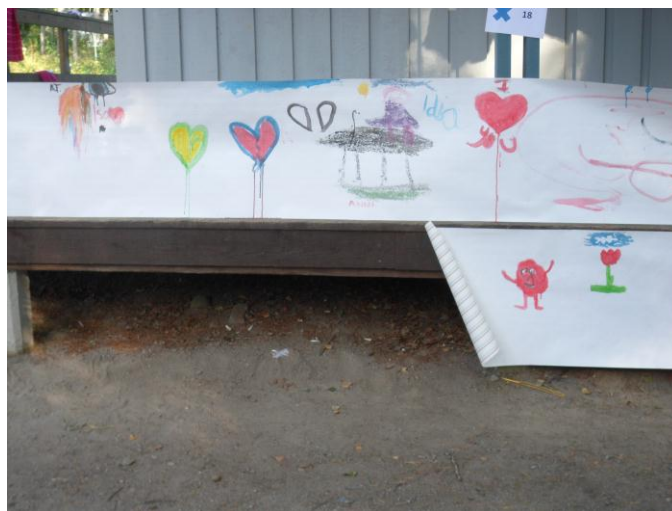
Kuva 7 Maalaus, rasti 19.

RASTI 20: Askartelua yhdessä tarjolla olevista materiaaleista. Saatavilla on askarteluohjeita, mutta vapaa mielikuvituksellinen keksiminen on luvallista ja toivottavaa.