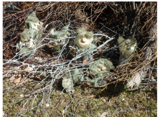
Kuva 12 Peikot tarinaradalla

Olet pian perillä peikkojen kodin luona. Kulje kiveltä kivelle ja näet oikealla peikkojen pesän. Älä häiritse peikkojen rauhaa vaan katso käsi kiikareilla peikkoja. Laita sormet vastakkain ja katso ”kiikareilla” pesän suuntaan. (kivet voivat olla myös olla laudan pätkiä)