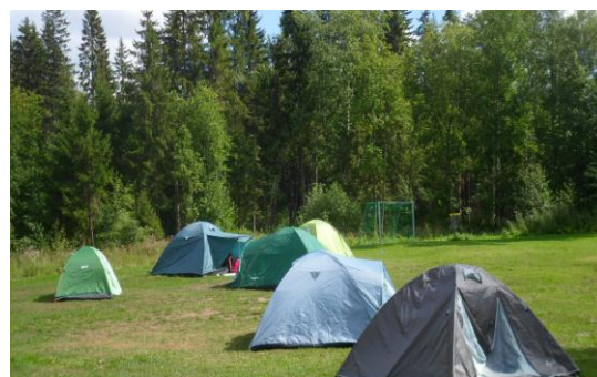
Kuva 1. Leirimajoitus Oksjärvi, Tammela 3.8.2013