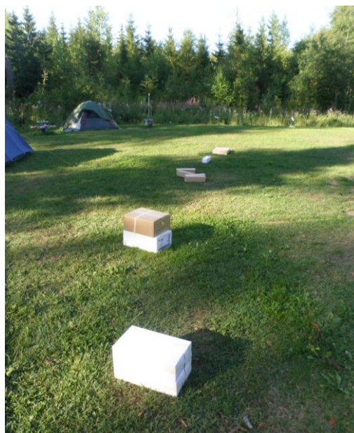
Kuva 2 Esterata, rasti 2

Heittopiste: molemmilla on viisi käpyä ja kummankin edessä on parin metrin etäisyydellä ämpäri. Kaveria kädestä kiinni pitäen yritetään heittää pallot ämpäreihin. Vaihdetaan puolia, jolloin sekä oikea että vasen käsi saavat heittoharjoitusta.