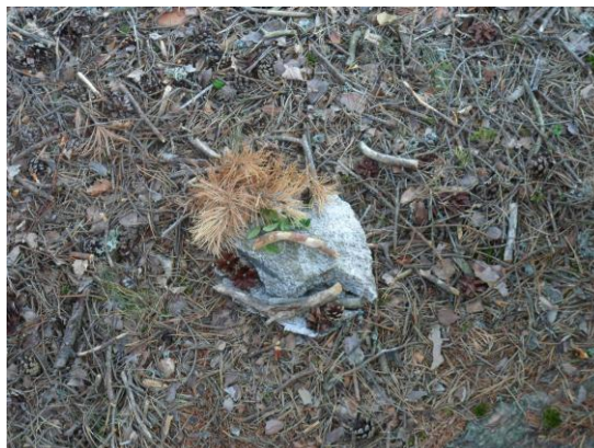
Kuva 6 Taideteos metsän antimista, rasti 8.

-Tavoite: Neuvottelu siitä mitä tehdään ja miten, vuorovaikutustaidot ja toisen huomioon ottaminen, luonnon hyödyntäminen, liikkuminen metsässä materiaalia etsien.