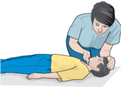
Tarkista lapsen hengitys