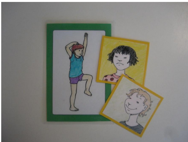
Esimerkit asento- ja tunnekorteista.