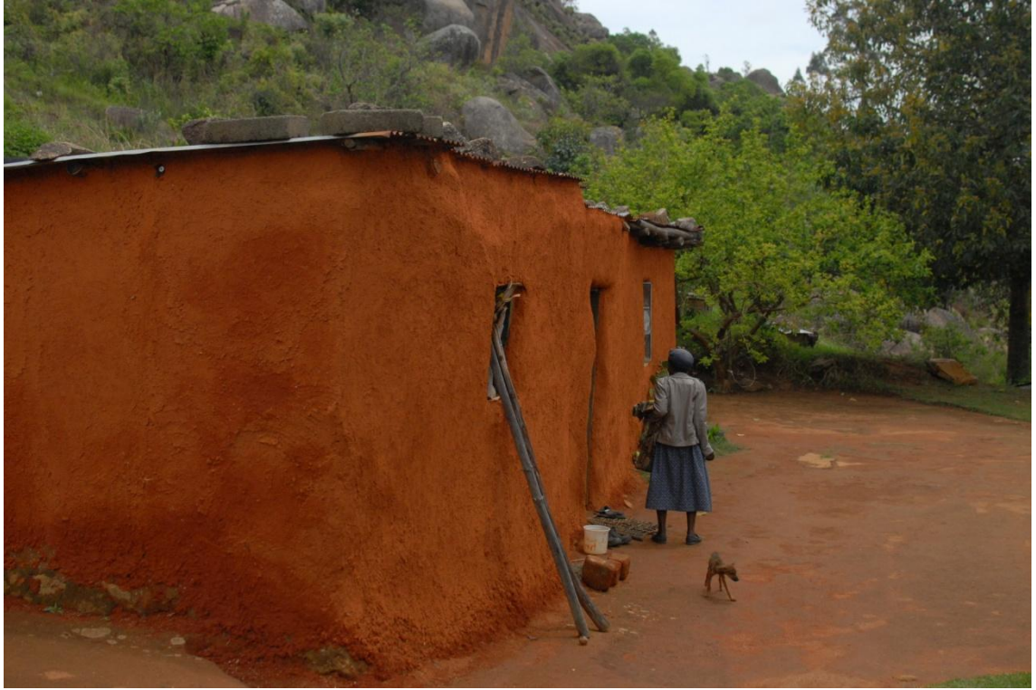
Kuva 3. Asumus, Mbabane. Swazimaa