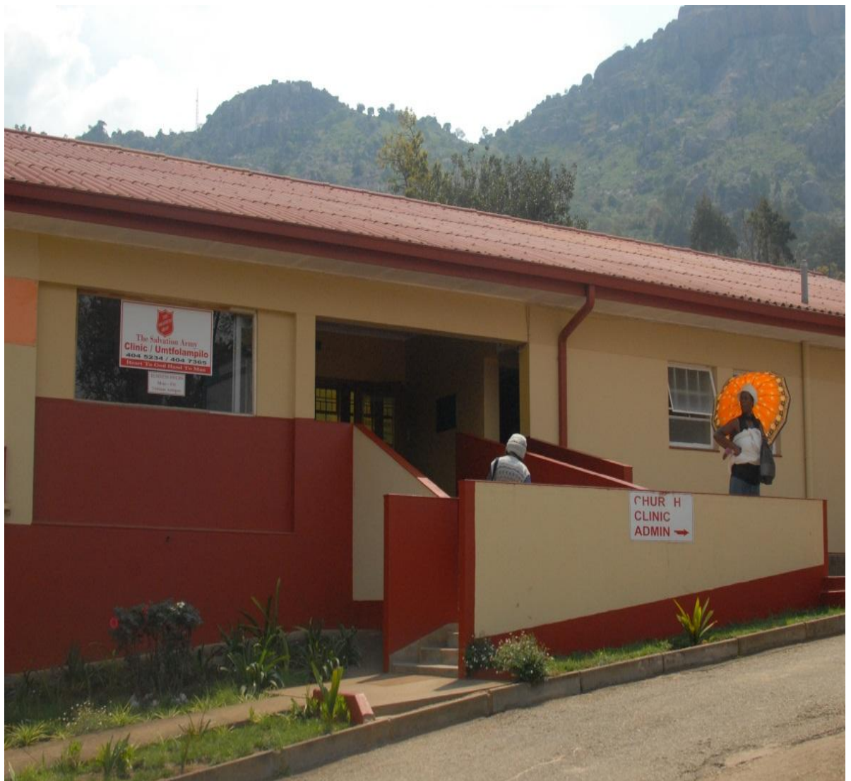
Kuva1. Pelastusarmeijan klinikka ja kirkko, Mbabane/Msunduzi.

sotyötä, siinä käsityksessä kuin se Suomessa ymmärretään ei tällä hetkellä ole. Pelastusarmeija on kouluttanut vapaaehtoistyöntekijöitä vetämään Kids Clubeja. Msunduzan alueella toimii kaksi, Gobholossa ja Corporationissa. Lapsiryhmät ovat isoja ja ikähaarukka suuri: 4-19-vuotiaita. Ryhmiin osallistujia on epä säännöllisesti ja ryhmätoiminta perustuu ensisijaisesti yhdessäoloon ja leikkeihin. Kokoonumisajat vaihtelevat, mutta säännöllisyyteen pyritään.