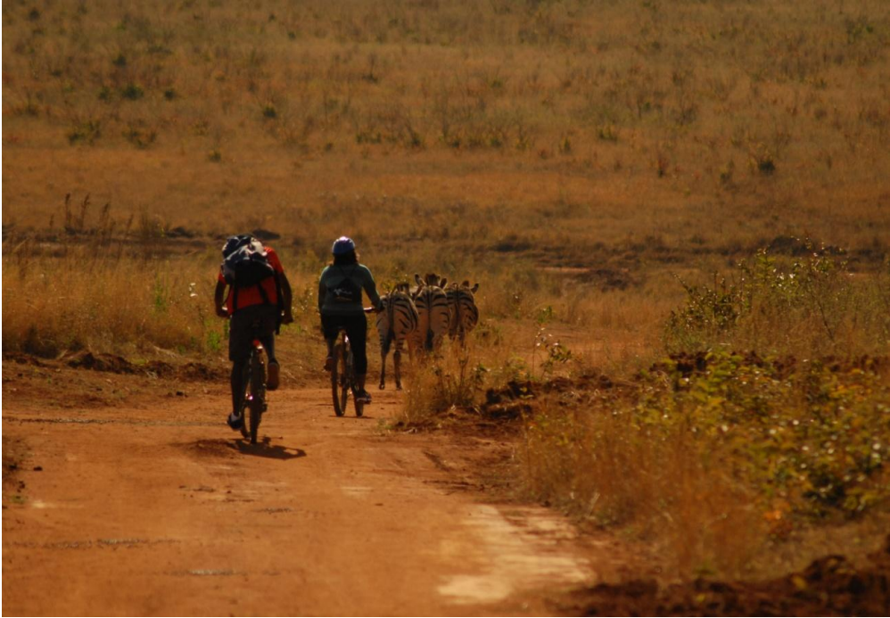
Kuva 3. Mlillwane, Swazimaa