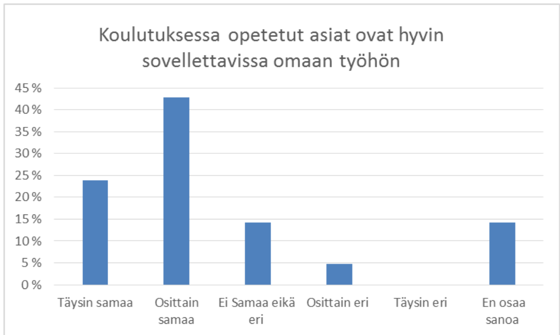
KUVIO 1. Koulutuksen soveltuvuus omaan työhön

Haastattelussa selvitettiin koulutuksen soveltavuutta työelämään. Kuviosta 1 ilmenee, että koulussa opetetut asiat ovat hyvin tai melko hyvin sovellettavissa omaan työhön. Haastateltavista 14 % ei osannut sanoa näkemystään asiaan. Tulokseen vaikutti se, että muutamalta haastateltavalta puuttui omakohtainen koulutuskokemus bioenergia-alalta.