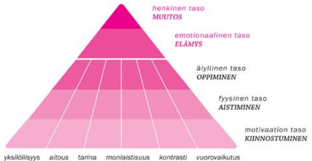
KUVIO 1. Elämyskolmio (Elämyskolmio 2009)

Kuvassa esitetään Lapin elämysteollisuuden osaamiskeskuksessa luotu Elämyskolmio. Kolmion oikealle sivulle on merkitty asiakkaan kokemisen tasot, kolmion pitkälle alasivulle tuotteen kriittiset elementit.