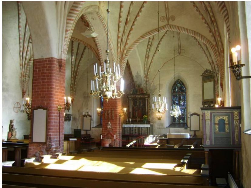
KUVA 2. Hollolan kirkon kaksilaivaisuus

Erikoisuutena on lukkarinpenkki (kuvassa 2 oikealla), joka rakennettiin ylijääneestä materiaalista vuonna 1935 restauroinnin yhteydessä. Koristeet olivat ensimmäisen penkkirivin päädyssä. (Mantere 1985, 165;168.) Kuvassa 2 näkyy myös alttaritaulu, joka on ainutlaatuinen. Alttaritaulu on noin 1650 Wrangelin ja Ekelöfin lahjoittama (Mantere 1985, 139). Ainutlaatuisen siitä tekee sen, että taululle on maalattu varjo, joka ei vastaa taulun kehyksiä (Mantere 1985, 168). Varjolla on haluttu antaa vaikutelma alttaritaulun suuruudesta.