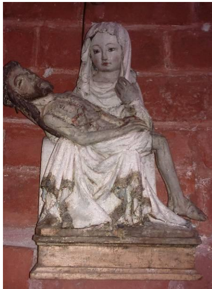
KUVA 1. Pietà