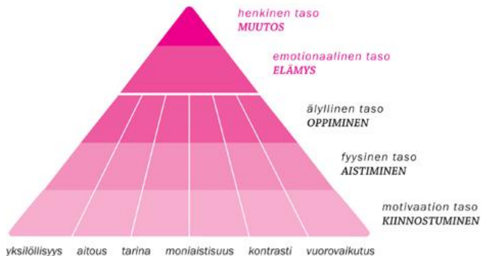
KUVIO 1. Elämyskolmio (LEO 2009)

Elämyksellisyyttä voidaan tutkia LEO:n laatiman elämyskolmion avulla (KUVIO 1). Se koostuu kokemusten tasoista: kiinnostuminen, aistiminen, oppiminen, elämys ja muutos, ja elämyksen elementeistä: yksilöllisyys, aitous, tarina, moniaistisuus, kontrasti ja vuorovaikutus. Kiinnostuminen lähtee motivaation tasosta kul- kien fyysisten, älyllisten ja emotionaalisten tasojen kautta henkiseen tasoon eli muutokseen. (LEO 2009.)