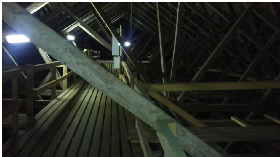
KUVA 4. Hollolan kirkon ullakko