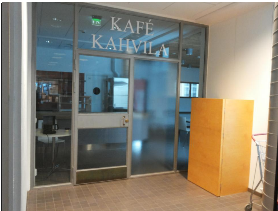
Figur 5. Cafés ingång på Ekenäs bibliotek. Foto Malena Backman, 2014