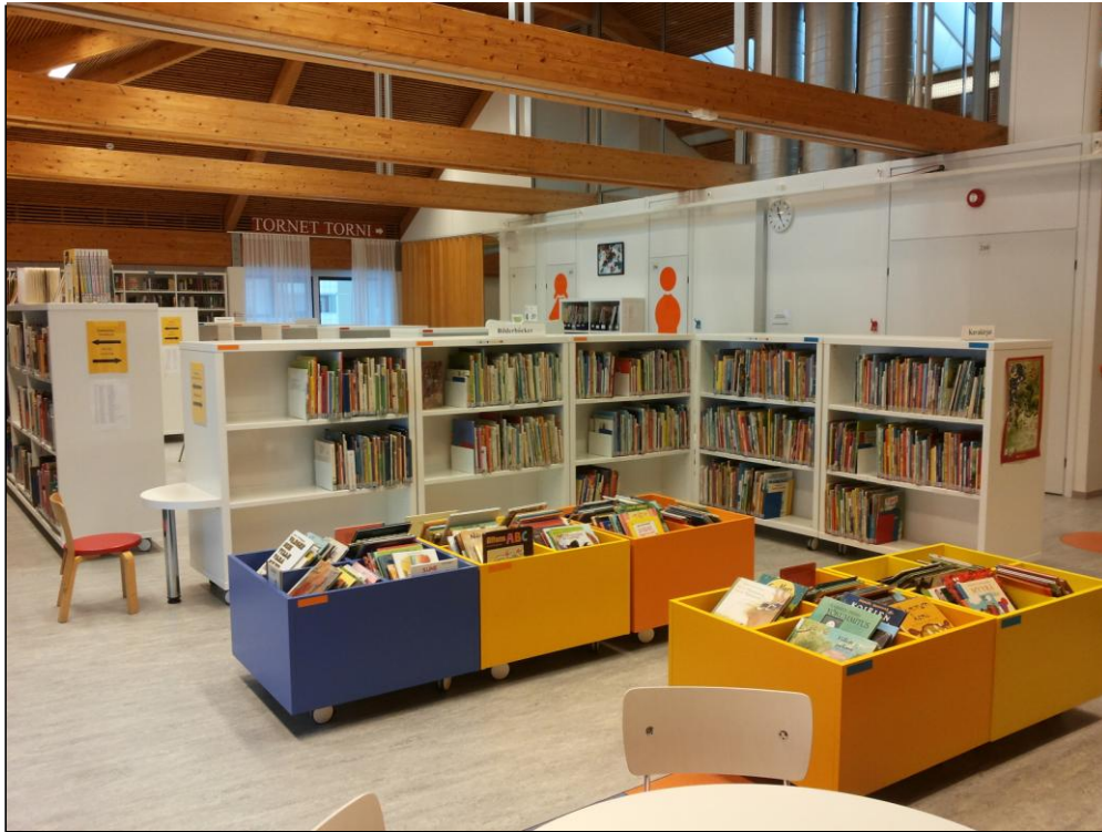
Figur 3. Barnsidan på Ekenäs bibliotek och rummet Tornet längst bak.