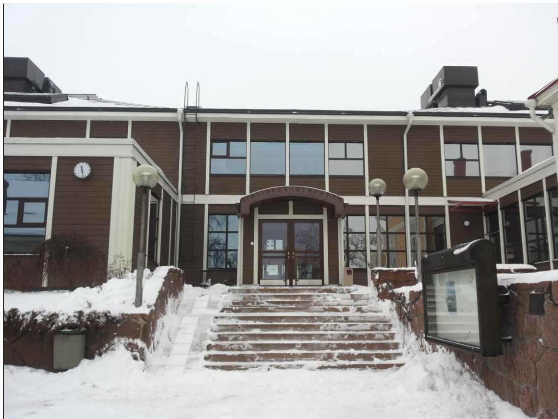
Figur 1. Ekenäs bibliotek från utsidan. Foto Malena Backman, 2014

finns också filialer i glesbygderna Svartå, Tenala och Bromarf. En biblioteksbus som är baserad i Pojo betjänar invånarna i Fiskars, Åminnefors, Harparskog, Billnäs och Snappertuna. (Raseborgs Stad, 2013)