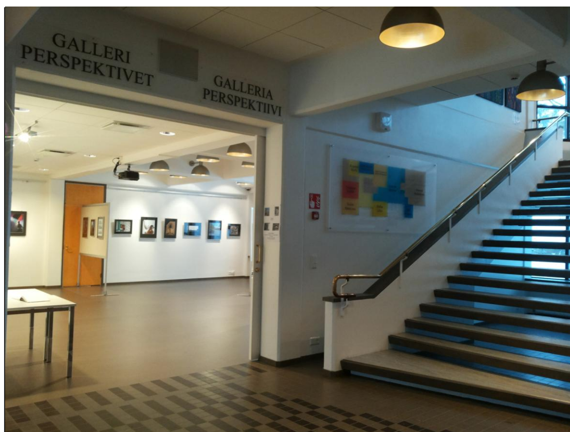
Figur 6. Galleri Perspektivet på Ekenäs bibliotek.

Med inspiration från olika konstkurser som jag själv deltar i där man målar och tecknar av modeller eller stilleben tänker jag att biblioteket kunde vara en trevlig miljö att måla i. I galleriet på första våningen (figur 6, se nästa sida) kunde man t.ex. ha en kurs i fritt måleri, men där man får måla ett motiv från sin favoritbok. Det sistnämnda skulle vara det enda kriteriet, för övrigt skulle kursen rikta sig till alla vuxna som är intresserade. Det behövs en konstnär eller annan lämplig person som håller i kursen och deltagarna får själva ta med material som de behöver. När verken är färdiga kan man ställa ut dem i galleriet.