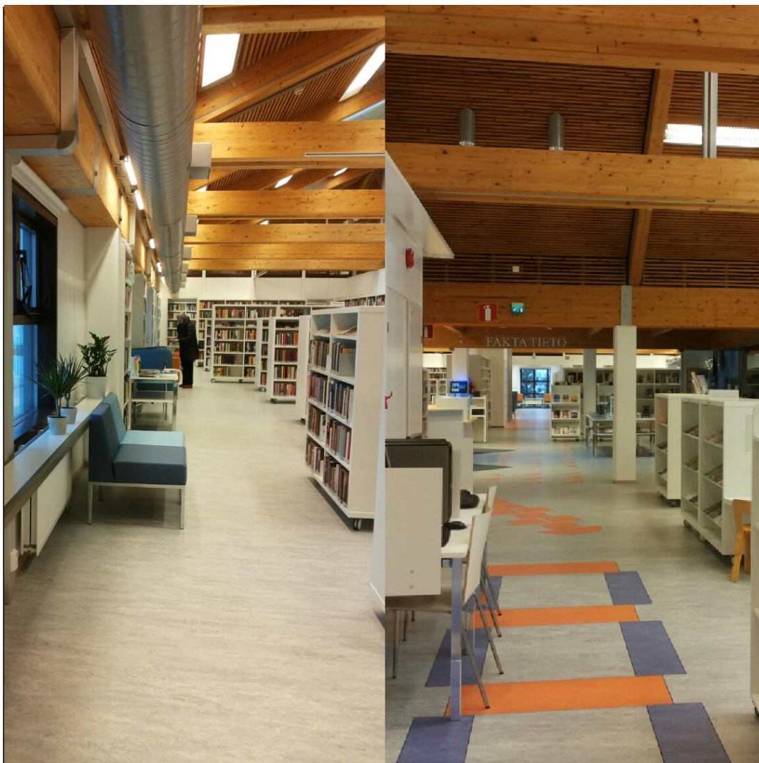
Figur 7. Bokhyllor och böcker på Ekenäs bibliotek. Foto Malena Backman, 2014