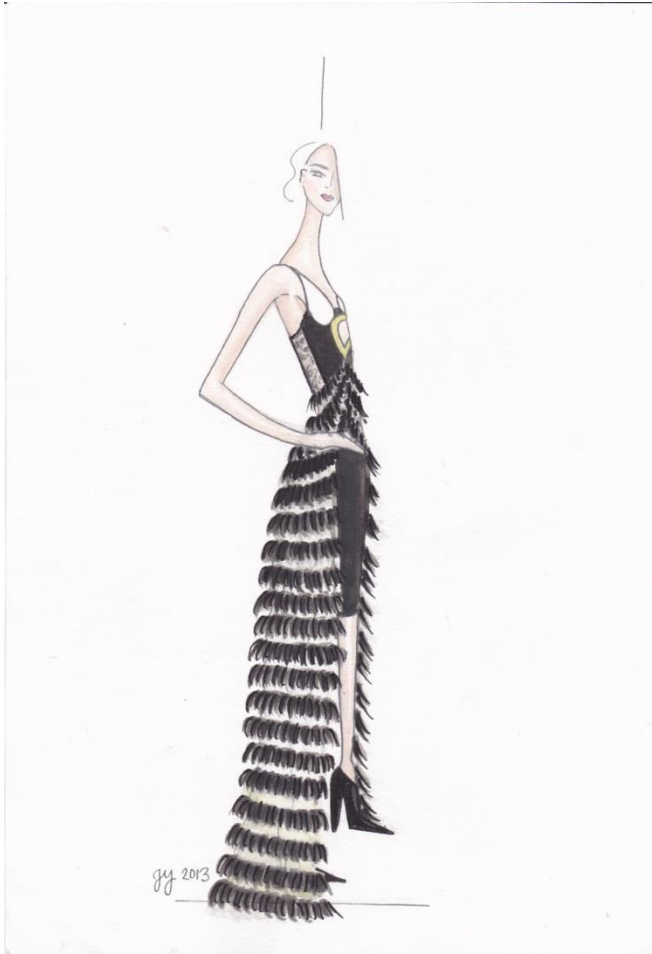
KUVIO 5. Ingénue.

Pjotr Tšaikovskin teos Joutsenlampi kertoo rakkaustarinan, jossa prinssi Siegfried rakastuu neitoon Odetteen joka on taiottu joutseneksi. Taika purkautuu vain öisin, jolloin prinssi tapaa neidon lammen rannalla. Prinssi päättää naida Odetten, mutta katalien juonien vuoksi tämä erehtyy menemään naimisiin väärän neidon kanssa. Huomattuaan virheensä prinssi pyytää anteeksi Odettelta, mutta on liian myöhäistä. Odetten täytyy kuolla. Siegfried haluaa kuolla yhdessä rakastamansa Odetten kanssa.