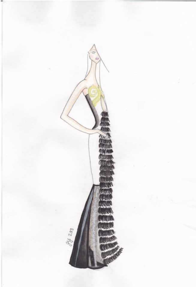
KUVIO 7. Dalliance.