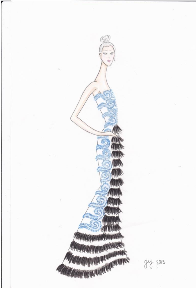
KUVIO 9. Lissome.