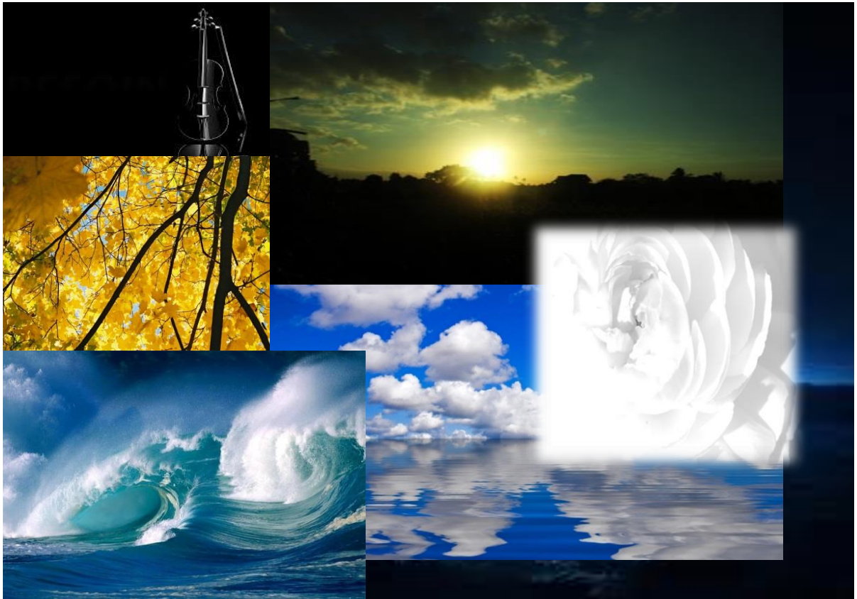
KUVIO 2. Kokoelman värikartta.

tieto-taito, trenditoimistot ja materiaalien toimittavien tahojen ehdotukset sekä kohde-ryhmän mieltymykset. (Nuutinen 2004, 167.)