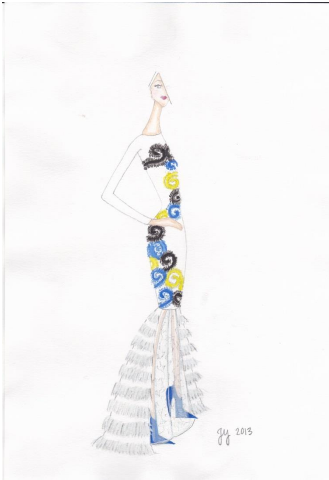
KUVIO 10. Belle Époque.