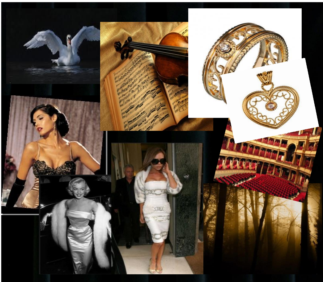
KUVIO 1. Tunnelmataulu (mood board) Lacrimosa-mallistosta.

Tunnelmataululla (mood board) ilmaistaan mielikuvia, joita malliston inspiraatio saa suunnittelijassa aikaan.