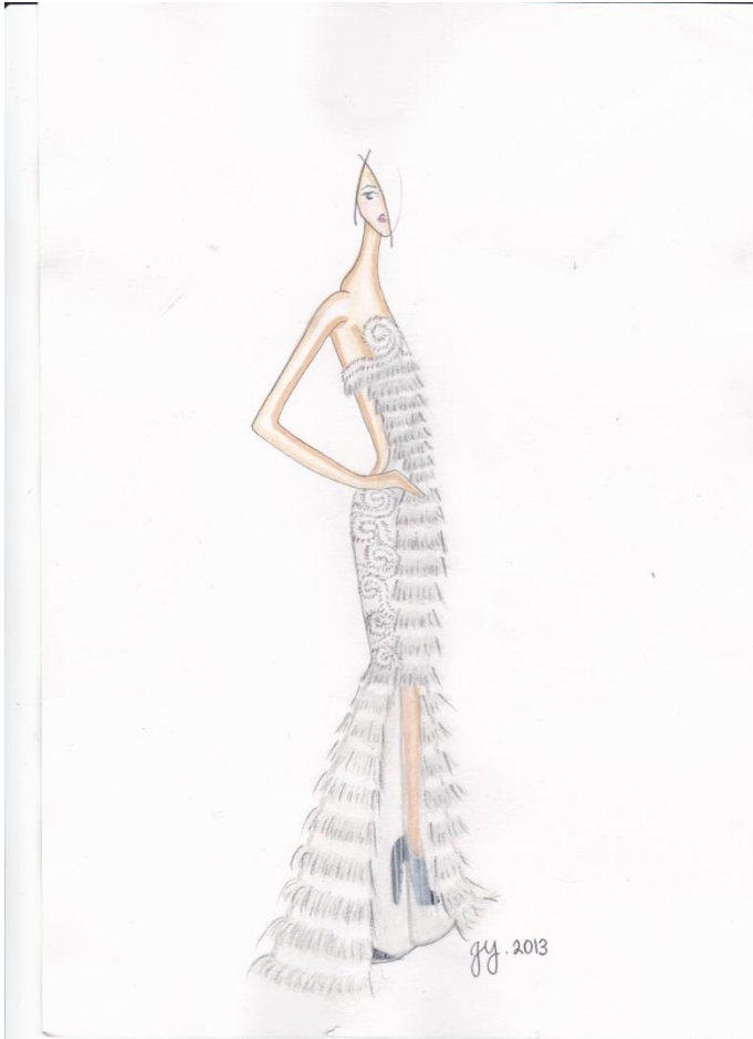
KUVIO 11. Halla.

Fredrik Paciuksen säveltämä Maamme-laulu perustuu Johan Ludvig Runebergin luomaan ruotsinkieliseen runoon. Runo kuuluu suurempaan runoteokseen nimeltä Vänrikki Stoolin tarinat. Maamme-laulun sanoissa kuvataan suomalaisten rakkautta omaan maahansa sekä maan puhtautta ja kauneutta luonnon muodossa.