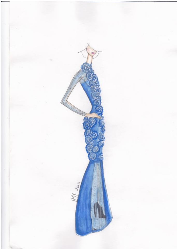
KUVIO 8. Cascade.

Claude Debussyn teos La Mer kertoo nimensä mukaisesti merestä, ja sen erilaisista liikkeistä yhdistyen aaltoihin, joihin valo heijastuu (Viva Classica 2014.)