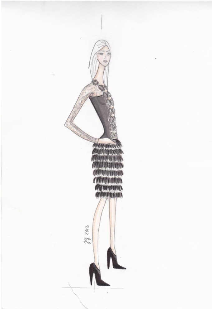
KUVIO 12. Ephemeral.