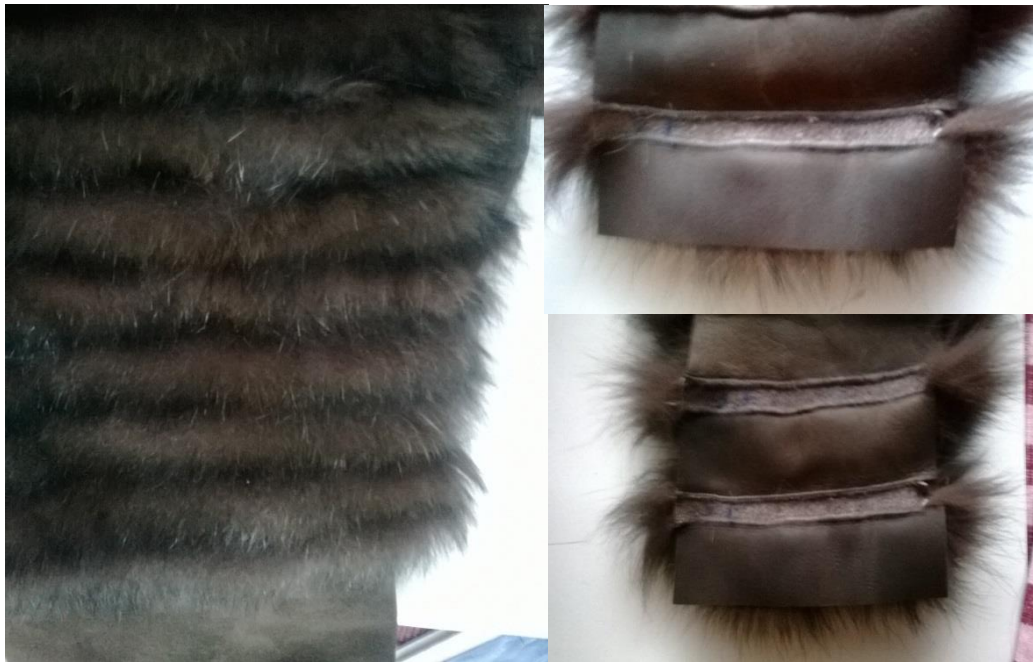
KUVIO 3. Galoneeraus.

Suunnittelijan tulee ottaa työssään huomioon vuodenaika sekä siihen sopivat materiaalit. Kesäisin kannattaa turkiksen käyttäjän suosia kevyillä tekniikoilla tehtyjä turkis-tuotteita, kun taas talvisin tarvitaan enemmän suojaa kylmien sääolosuhteiden vuoksi. Myös kokoelman sisältämät tuotteet vaikuttavat materiaalien valintaan. Talvisesongin ulkokäyttöön tarkoitetut takit on valmistettava kestävämmän kylmää, kun taas iltapukujen mahdollinen ympärivuotinen käyttö ohjaa niiden keveään toteutukseen. Siksi iltapukuja valmistettaessa tulee käyttää tekniikoita, joilla turkis saadaan mahdollisimman keveäksi, jotta niissä käytettävät materiaalit kestävät turkiksen painon. Kokoelmassa on käytetty galoneerausta (KUVIO 3.) Galoneeraus on tekniikka, jossa kahden ohuen turkissuikaleen väliin ommellaan jotain muuta materiaalia, esimerkiksi tässä tapauksessa kangasta. Galoneerauksella saadaan aikaiseksi vaatteeseen keveyttä ja lisä-pinta-alaa turkikseen. Turkissuikaleen karva laskeutuu edellisen turkissuikaleen karvan päälle, jolloin väliin sijoitettu materiaali ei välttämättä näy turkissuikaleiden välistä.