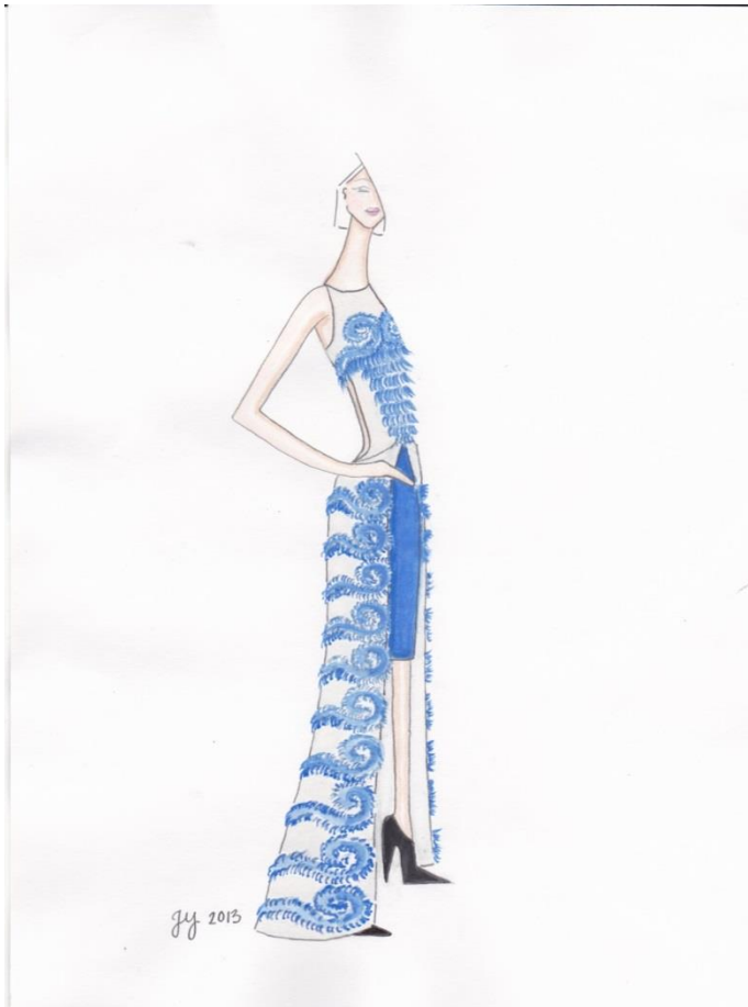
KUVIO 6. Eloquence.

Edvard Griegin säveltämä Pianokonsertto a-molli op.16 on dramaattisia, haaveellisia ja romanttisia mielikuvia luova teos, jossa on pohjoismaalaista yksinkertaisuutta sekä romanttista mahtipontisuutta.