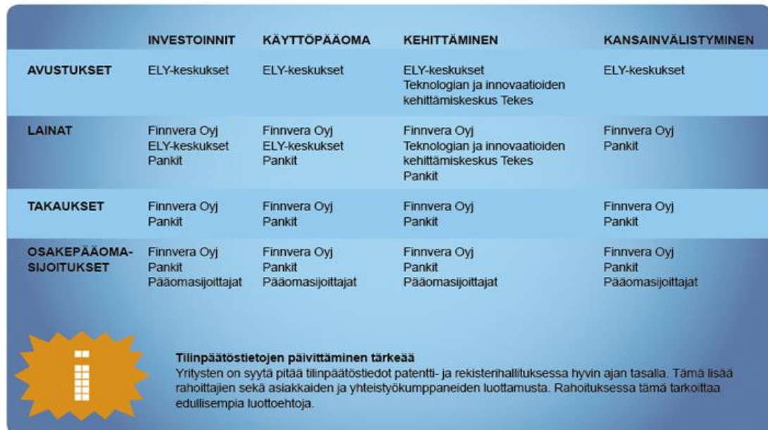
KUVA 1. Eri rahoitus- ja avustusmuotoja. (Keskuskauppakamari 2011, 25).

toiminnasta aiheutuvat kulut. Kuvassa 1 esitellään erilaisia rahoitusvaihtoehtoja ja niiden tarjoajia. (Keskuskauppakamari 2011, 23-25.)