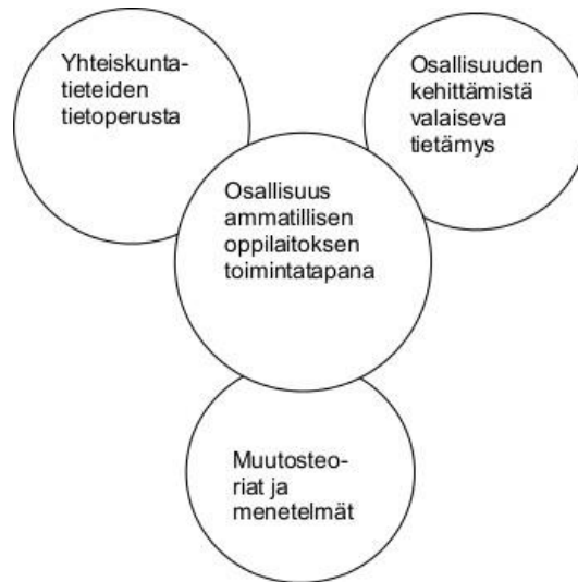
Kuva 3. Horellin ym. mallin pohjalta mukailtu malli osallisuuden kehittämisestä

Osallisuutta kehitettäessä on hyvä ammattilaistenkin pysähtyä pohtimaan ja rakentamaan osallisuuden ympärille tietoperustaa ja kerätä aineistoa kohde-ryhmältä, jotta keskellä oleva toimintatapa täydentyy. Projektiluontoisissa tehtävissä on helppo lähteä tielle, jossa kiireen tuntu ja aikaansaamisen innokkuus menevät suunnitelmallisuuden ja realististen tavoitteiden asettamiseen. Hyvin tehty hankesuunnitelma ja siihen sisältyvä aikataulukutus on hyvä pohja arjessa tehtävälle työlle.