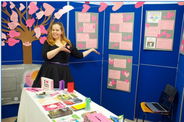
Kuva 1 Tapahtumapäivän piste