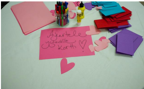
Kuva 3 Ystävänäpäiväkortin askartelupiste