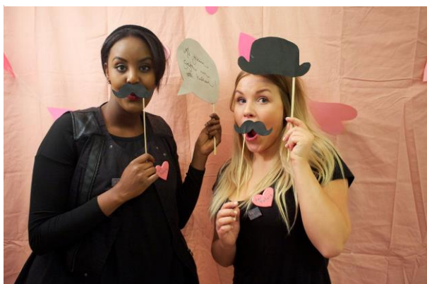
Kuva 7 Järjestäjät Photobooth- pisteessä