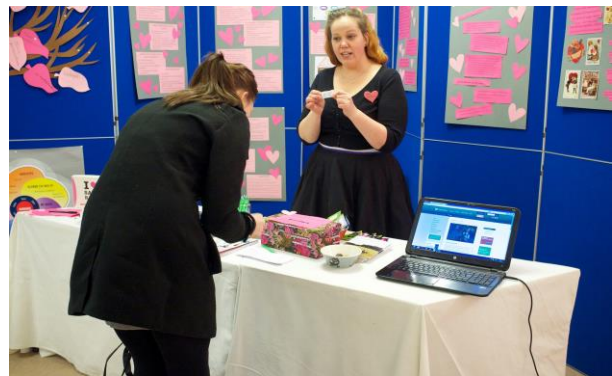
Kuva 4 Palautteen antoa