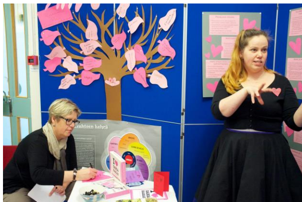
Kuva 5 Ystävä- ja rakkaudenpuu