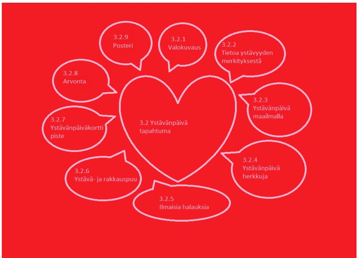
kuvio 1. Ystävänpäivän viitekehys