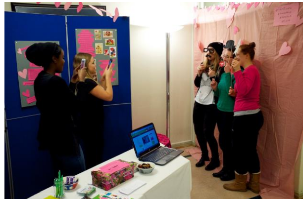
Kuva 2 Photobooth- piste