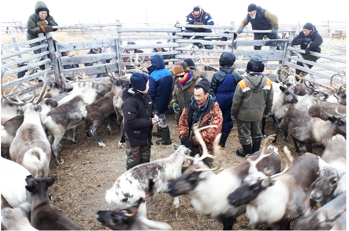
Ammattitaitoisimmat poromiehet työskentelevät kirnussa kaikki erotuspäivät. Porojen käsittely vaatii voimaa, kun kaikki vasatkin ovat lähes emiensä kokoisia.