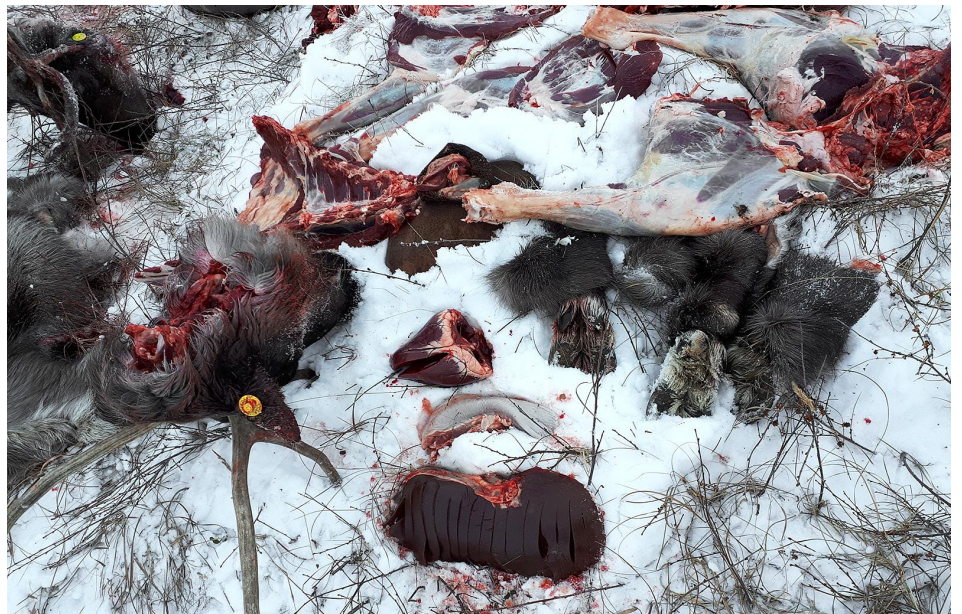
Paikallinen leikkuutyö yhdellä silmäyksellä. Korvassa näkyy etäluettava pilttä, joka ei juuri eroa tavallisesta. Huomaa myös koipinhat nätisti rullalle käärittyinä.

Vaikka poromiesten työetuja pidetään hyvinä, on uusien työntekijöiden löytäminen raskaaseen ammattiin silti vaikeaa. Työn houkuttavuutta nuorten miesten keskuudessa alentaa myös sen mukanaan tuomat haasteet työn ja perhe-elämän yhdistämiseen. Alueen yleinen ongelma on nuorten naisten hakeutuminen kaupunkeihin muka-