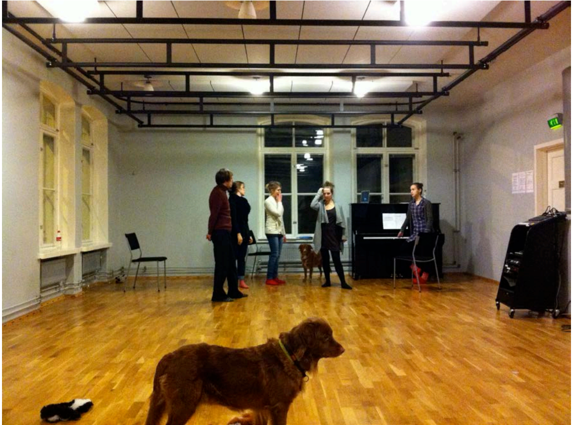
Kuvio 11. Yksi koulun harjoitustiloista.

Koululta saimme hyviä harjoitustiloja (kuvio 11). Koska mahduimme pieneenkin tilaan, kykenimme harjoittelemaan melkein missä luokassa tahansa. Emme siis tarvinneet erityistä teatteritilaa, teatterisalia tai tanssisalia harjoituksiimme, joka helpotti tilavarausten hoitamista.