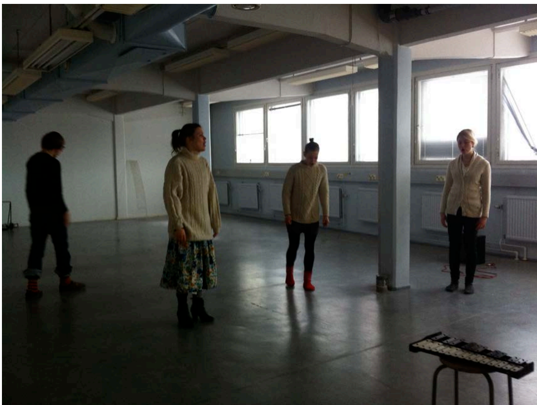
Kuvio 8. Lauttasaaren treenikämpän yleiset tilat. (Kuva: Elina Vehkaoja)

Kerrostaloasunnoissa oli otettava huomioon naapurit. Kotiharjoitukset oli siis tehtävä hieman pienemmällä volyyymilla, ja viitteellisemmin: ei voinut antaa palaa täysillä. Toisaalta kodikas tunnelma teki harjoituksista rennommat. Koti tilana luo ryhmälle paineettoman harjoituksen (kuvio 7). Tuntui siltä kuin viettäisimme muuten vaan aikaa keskenämme, että pitäisimme ainoastaan hauskaa, ajattelematta harjoittelemista sen kummemmin. Tietenkin toimimme silti määrätietoisesti, mutta rentouden kokemus on kodissa silti erilainen, kuin esimerkiksi koulussa, jossa karkeasti ajatellen ollaan aina vain työskentelemässä ja suorittamassa jotakin. Toisaalta toisen ihmisen kodissa ei kuitenkaan aina voi olla täysin rennosti. Se ei ole neutraalia maaperää, vaan jonkun toisen ihmisen yksityisaluetta. Muistot ja kuvitelmat tuovat kotiin erilaista energiaa, kuin mihin tahansa muuhun rakennukseen. Muistot tarvitsevat jonkin paikan ja suljetun tilan, jonka koti voi tarjota (Bachelard 2003, 74–81). Kokemukset kodista tai kotiin liittyvistä muistoista antavat erityisen kunnioituksen ja kodikkaan asetelman kodeissa harjoitteluun.