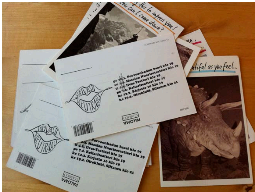
Kuvio 2. Postikorttien kääntöpuolelle tulostettuja flyereita.

Flyerit ratkaistiin keräämällä vanhoja valokuvia ja käyttämättömiä postikortteja. Työryhmä penkoi kaappiansa kätköistä valtavan määrän kortteja, joiden toiselle puolelle printtasimme esitysjankohdat ja logon (kuvio 2).