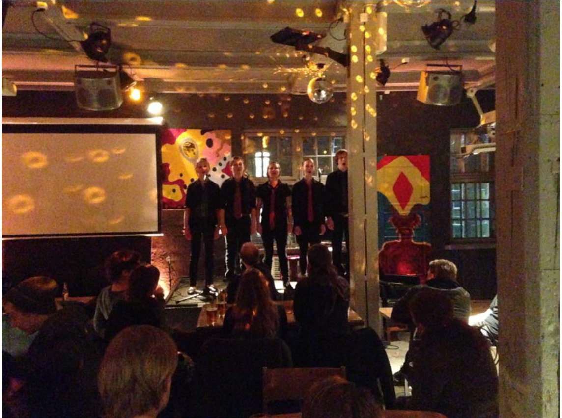
Kuvio 13. Esitys Siltasessa. Peilipallo loi tunnelmaa esitystilaan ja äänentoisto auttoi kuuluvuuteen.

Esityksemme toimi baareissa kevyen rakenteensa vuoksi (kuvio 12, 13). Ainoa ongelma tuntui olevan kuuluvuus. Kun ei ole käytettävissä äänentoistoa, niin tilavissa ravintoloissa katsojien on koettava mahtua mahdollisimman lähelle esiintyjä kuullakseen kaiken. Lisäksi ravintoloissa voi olla myös asiakkaita, jotka eivät ole tulleet katsomaan esitystä, jolloin he saattavat metelöidä aiheuttaen epämiellyttäviä tilanteita suhteessa esityksen katsojiin. Toisaalta kaikki tietävät, että ravintoloissa ja baareissa voi olla ulkopuolisia ihmisiä, jolloin siihen osataan myös kenties varautua. Yhdessä baarissa jouduimme turvautumaan äänentoistoon, sillä tilan akustiikka oli sen sorttinen, ettei ääni kuulunut muutamaa metriä kauemmas. Äänentoisto toimi hyvin, mutta se kahlitsi liikumista hyvin paljon, jolloin esityksestä jäi uupumaan teatterillinen elementti, ja esityksestä tuli enemmänkin konserttimainen.