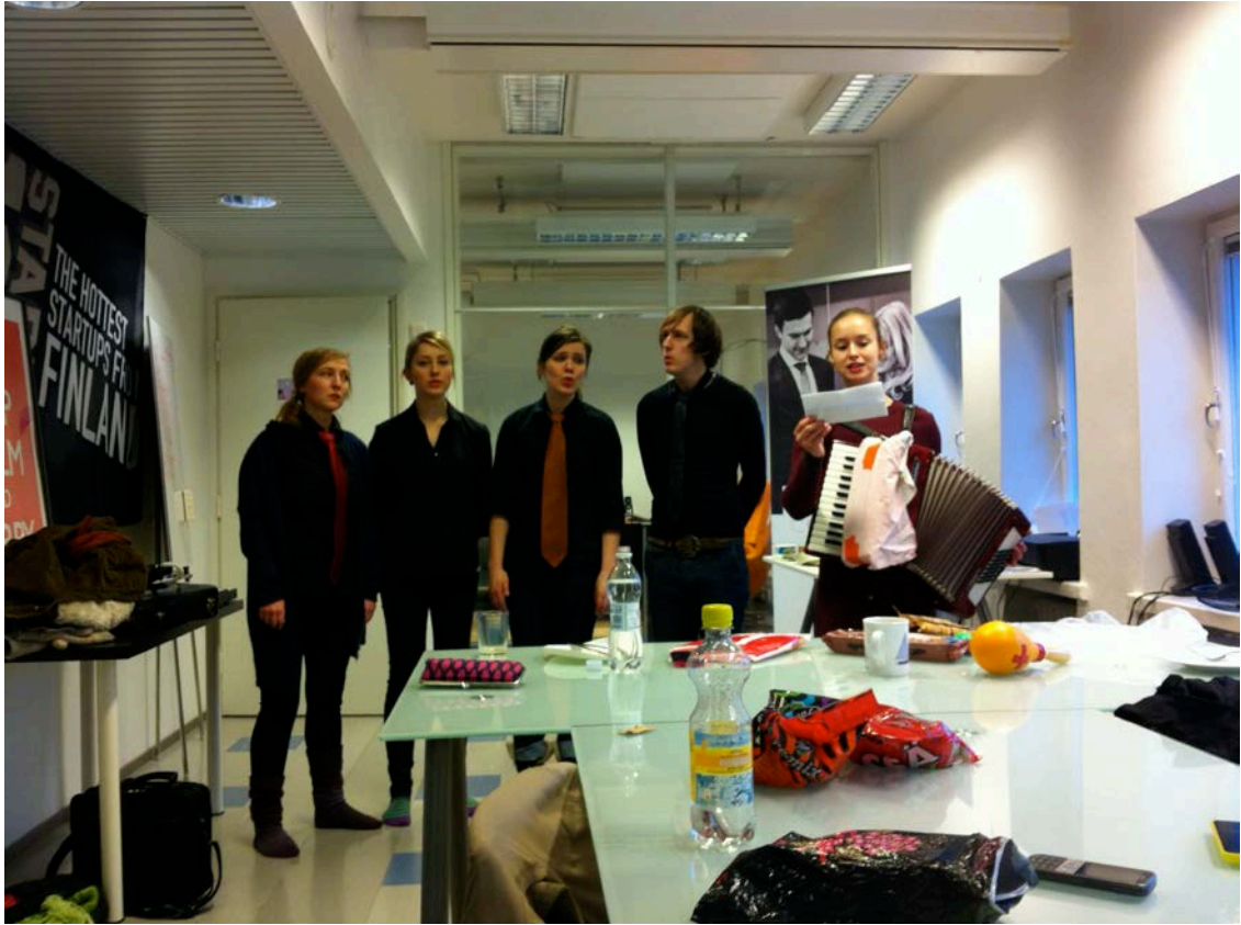
Kuvio 10. Töölön toimistotilat.

Töölön toimistotila oli erinomainen harjoitustila. Tilaa oli paljon, eikä talossa ollut naapureita, joita olisi häirinnyt meidän soittomme. Pöytiä siirtämällä huoneista tuli entistä avarammat ja eri huoneet mahdollistivat harjoittelemisen pienemmissäkin ryhmissä samanaikaisesti (kuvio 10).