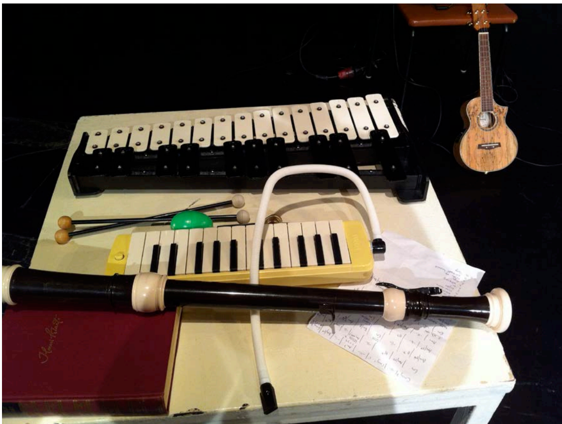
Kuvio 6. Soitinpöytä ja esityksessä käytetyt rekvisiitat.

ken. Musiikkikappaleet sävelsimme muistaen mitä soittimia meillä oli käytettävissämme, ja viimeistään harjoitusvaiheessa sovitimme kappaleet käytettävissä oleville soittimille.