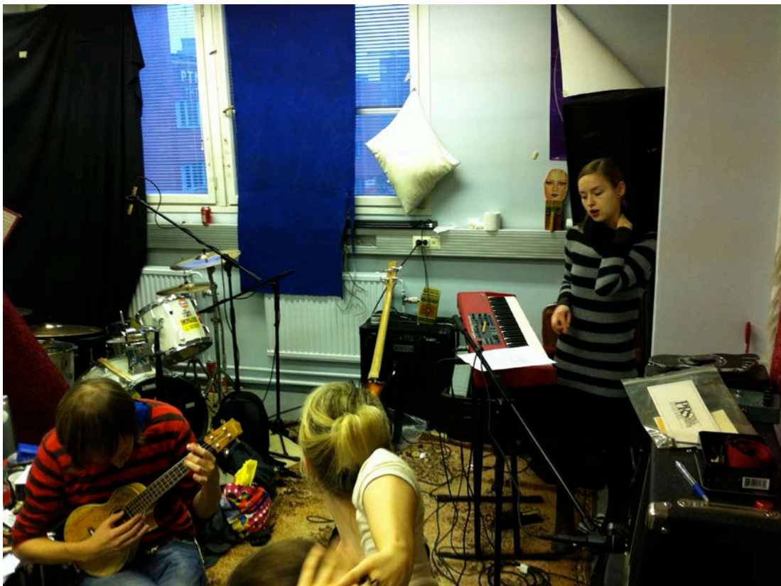
Kuvio 9. Lauttasaaren treenikämpän soittuhuone oli ahdas, mutta viihtyisä harjoitustila.

Lauttasaaren bänditilat tarjosivat meille hyvät harjoitustilat (kuvio 8, 9). Ongelmia syntyi siitä, ettei koskaan voinut tietää, tuleeko viereiseen treenihuoneeseen bändi soittamaan samaan aikaan, jolloin meidän akustinen soittomme ja laulumme eivät kuuluisi. Näin kävi muutaman kerran, mutta silloin pääsimme onneksi vaihtamaan bänditilan vapaana olevaan toiseen päätyyn, jolloin toisen bändin harjoitukset eivät kuuluneet niin häiritsevästi. Tilaa oli paljon ja monet soittimet olivat valmiiksi jo paikan päällä, jolloin kannettavaa ei ollut niin paljon.