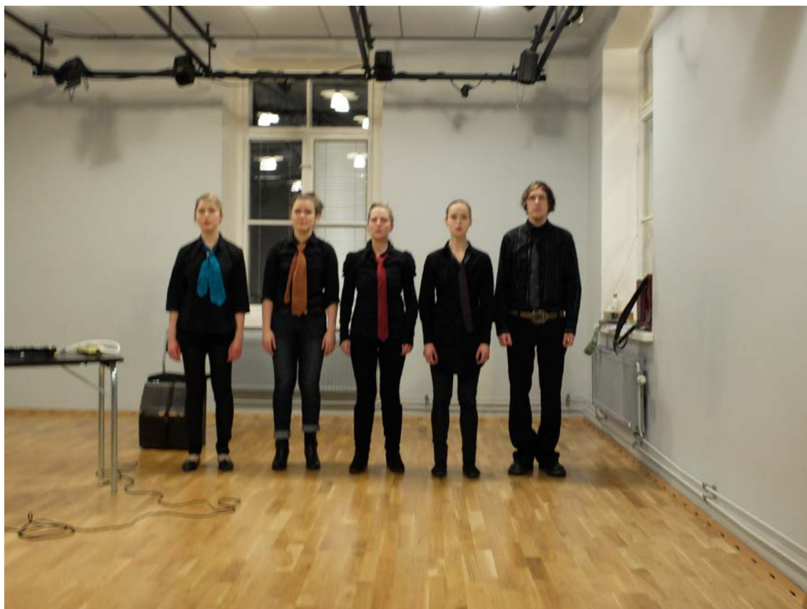
Kuvio 5. Esiintymisasut olivat yksinkertaistetut.

Puvustuksen halusin pitää mahdollisimman yksinkertaisena. Koska esityksemme käsiteli mm. neutraaliutta, korrektiutta ja tasa-arvoisuutta, päädyimme mustiin kauluspaitoihin ja värikkäisiin solmioihin (kuvio 5). Kaikki esiintyjät käyttivät omia tummia housujaan ja kenkiä. Eräs työryhmän jäsen työskenteli tarjoilijana eräässä ravintolassa, ja saimme lainata hänen työasuunsa kuuluvia mustia kauluspaitoja. Lisäksi saimme lainata ryhmän miespuolisten jäsenten ja poikaystävien solmioita. Tässä asiassa auttoi työryhmän pieni koko. Jos esiintyjä olisi ollut enemmän, olisimme joutuneet keksimään lisää tahoja, joista olisimme saaneet lainata asuja ja asusteita. Vaikkakin olen varma, että muutammat mustat kauluspaidat ja solmiot saa hyvinkin helposti lainattua kavereilta tai naapureilta, taikka löydettyä hyvin edullisesti kirpputorilta tai kierrätyskeskuksista.