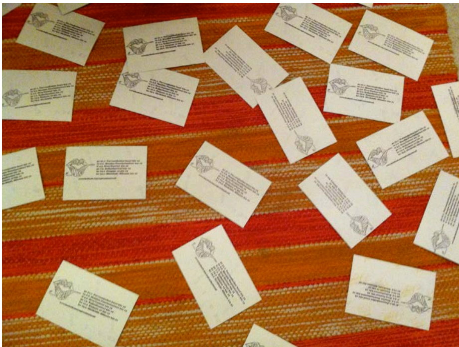
Kuvio 4. Kuivuvia flyereita.

Paperiset ja jaettavat mainokset tuovat näkyvyyttä. Mitä enemmän julisteita ja flyereitä jakaa ympäri kaupunkia, sitä enemmän esitys saa mainostusta. Kuitenkin tänä sosiaalisen median valtakautena uskon, että ainakaan meidän produktiossamme paperisten julisteiden levittäminen ei olisi tuottanut sen suurempaa eroa katsojamäärissä. Tekniikan hyödyntäminen kaikin tavoin on helppokäyttöistä ja myös edullisin vaihtoehto (Parantainen 2005, 17). Massiivisten paperijulisteiden painattamisen sijaan tuntui fiksulta viedä julisteita esille ainoastaan sellaisiin paikkoihin, joissa ne tavoittavat esityksen kohdeyleisön, mm. kouluihin ja kirjastoihin. Flyerit sen sijaan ovat hyödyllisiä muistutuksia ihmisille. Ne mahtuvat pieneen tilaan ja voivat olla visuaalisestikin miellyttäviä muistoja. Ne saattavat unohtua laukun pohjalle, mutta löytyessään muistuttavat esityksestä konkreettisesti.