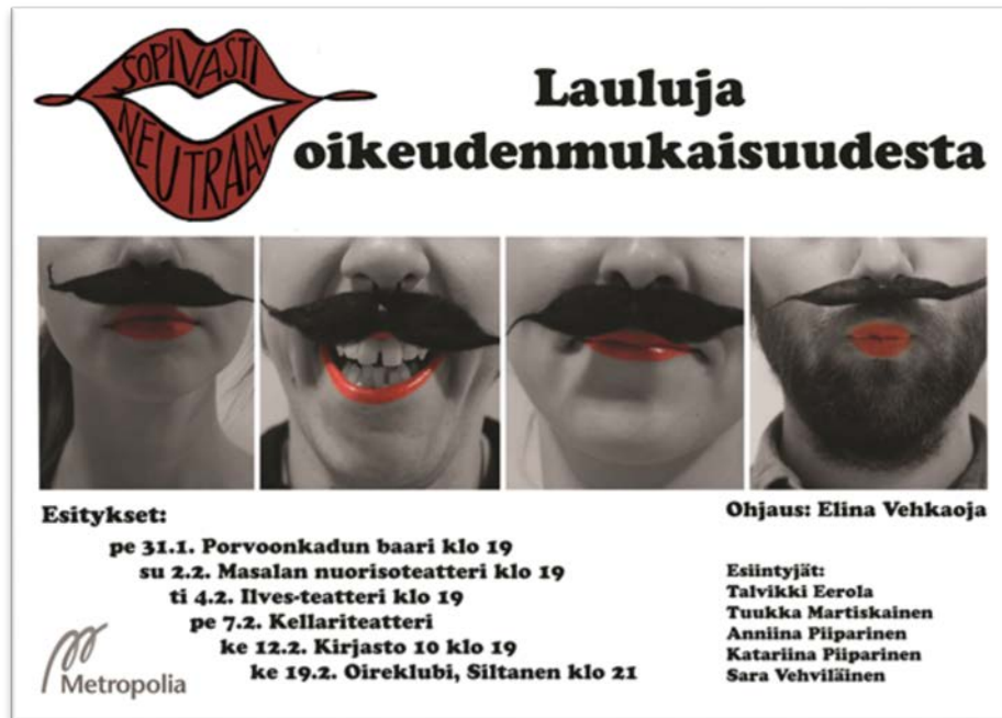
Kuvio 1. Sopivasti Neutraali - Lauluja oikeudenmukaisuudesta -esityksen julistekuva. (Juliste: Tuukka Martiskainen)

Flyerit ratkaistiin keräämällä vanhoja valokuvia ja käyttämättömiä postikortteja. Työryhmä penkoi kaappiansa kätköistä valtavan määrän kortteja, joiden toiselle puolelle printtasimme esitysjankohdat ja logon (kuvio 2).