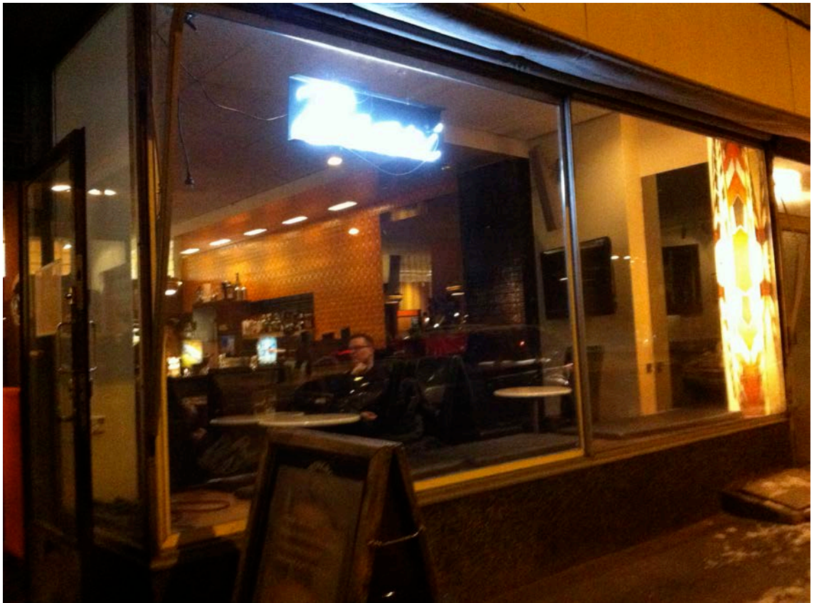
Kuvio 12. Porvoonkadun Baari. Esitystila oli ikkunan vieressä, joten kadulla kulkijat saattoivat jäädä seuraamaan esitystämme ulkopuolelta.

Ennen jokaista esitystä kävimme lava-asemoinnit läpi. Koska jokainen tila oli erilainen, oli otettava huomioon myös tilassa liikkuminen. Oli hyvin tärkeää, että koko ryhmä oli mukana rakentamassa tilaa esityskuntoon. Tällöin kaikki saivat käsityksen tilan mahdollisuuksista ja haasteista.