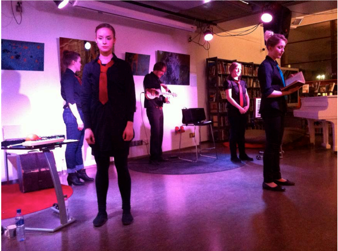
Kuvio 16. Sopivasti Neutraali -esitys esitettiin myös Kirjasto 10:ssä.

Teatteritiloissa toimii esitys kuin esitys. Kaikissa teatteritiloissa meillä oli selkeästi erikseen lava ja katsomo (kuvio 14, 15). Tätä erotusta ei ollut niin selkeästi ravintoloissa, joissa lava oli epämääräisempi ja yleisö esiintyjien ympärillä. Molemmat vaihtoehdot olivat toimivia, eikä kumpikaan aiheuttanut ongelmia, vaikka tuntuivatkin erilaisilta. Teattereilta saimme valaistuksen ja tarvittavat tekniikat käyttöömmme.