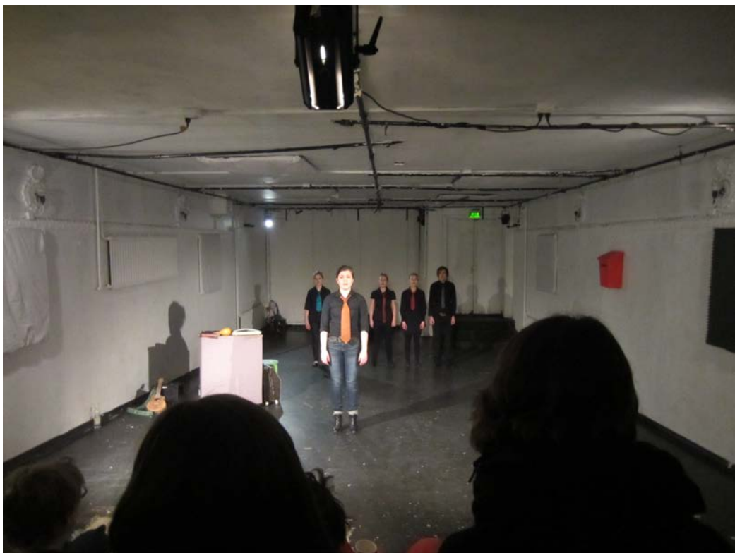
Kuvio 15. Esitys Ilves-teatterilla.