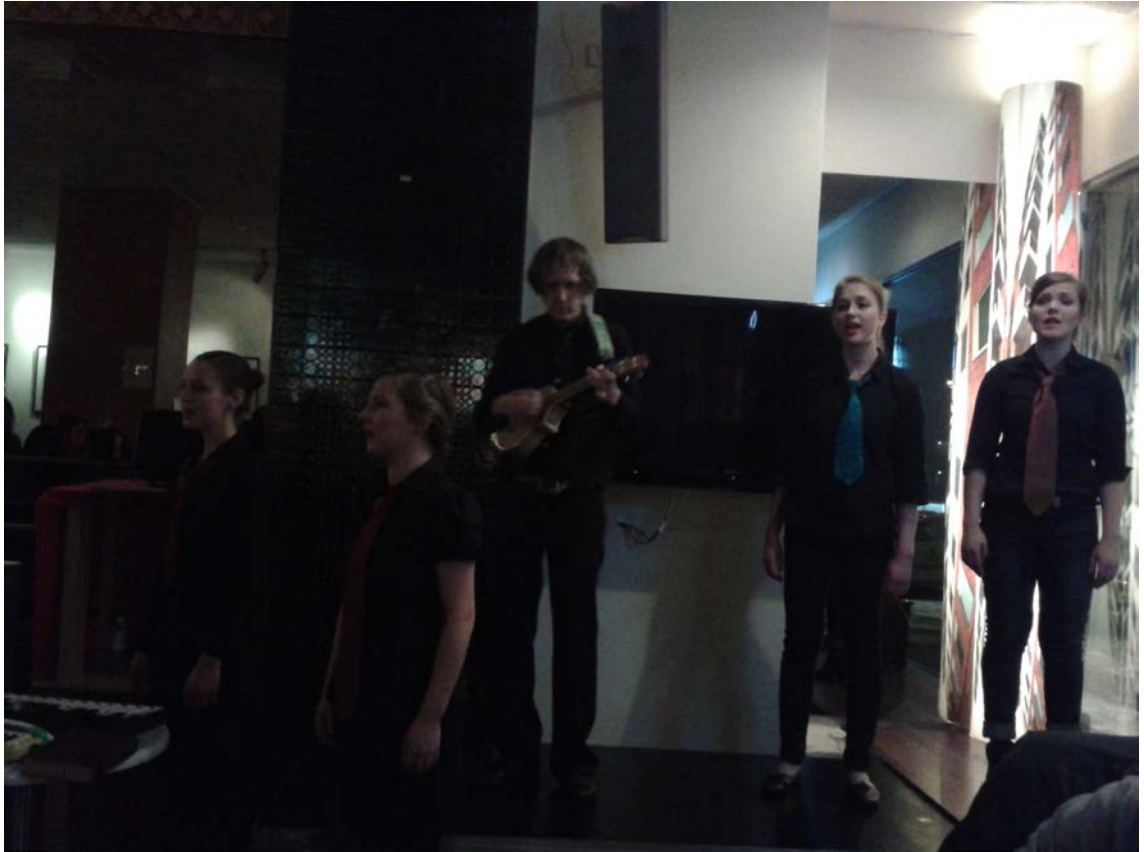
Kuvio 17. Porvoonkadun baari. Kuva toimii linkkinä videokoosteeseen esitystiloista.

Sopivasti Neutraali -esityksen pystyi esittämään näissä kaikissa tiloissa erinomaisesti. Kun alusta asti olimme keskittyneet helppoon ja avoimeen muotoon, oli mielekästä muovata esitys jokaiseen tilaan sopivaksi. Kuvio 17 toimii linkkinä videokoosteeseen esitystiloista.