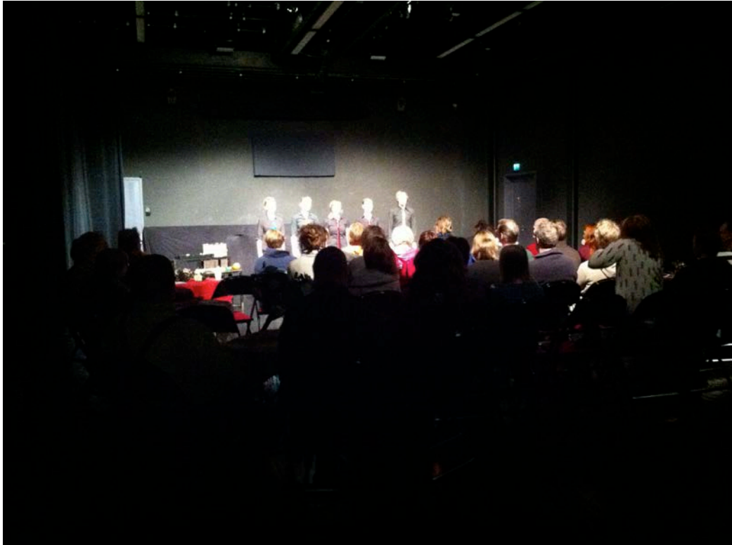
Kuvio 14. Esitys Masalan Nuorisoteatterilla.