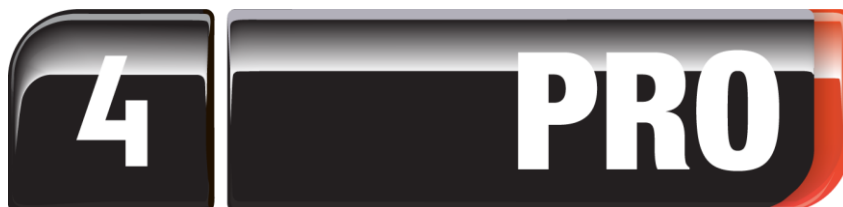
Kuva 1. Nelonen Pron virallinen logo, jossa esiintyvät verkkosivuilla käytetyt värit musta ja oranssi. (Nelonen Pro 2014)

Nelonen Pron internetsivujen värimalli tulee kanavan logon virallisista väreistä, jotka ovat musta ja oranssi (Kuva 1). Kanavan ja samalla internetsivujen värimalli perustuu näihin kahteen väriin ja niiden sävyihin. Logossa on käytetty täyttä mustaa, mutta verkkosivuilla on mustan sijaan hyödynnetty tumman harmaata, koska se ei ole niin raskas kuin täysi musta. Tekstin tausta on valkoinen, jotta se olisi helppo lukea. Fonttikan ei ole aivan täysi musta vaan tumman harmaa, mikä pienentää värien kontrastia ja helpottaa lukemista. Nelonen Pron verkkosivujen fontiksi on määrätynyt Nelonen Pron virallinen fontti, jonka yleisilme ja selkeys on otettu huomioon jo virallista fonttia suunniteltaessa.