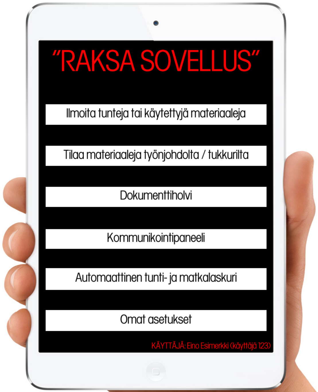
Kuva 2. Karkea kuvankäsittelyllä toteutettu luonnos, sovelluksen mahdollisesta käyttöösiittymästä (Forsberg 2014)

sissä, joissa on valtava määrä työntekijöitä ja esimerkiksi oma tietokone osasto, joka vastaa yrityksen tietoteknisistä ratkaisuista ja niiden ylläpitämisestä.