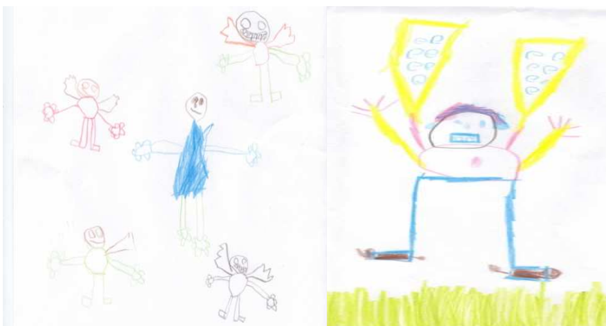
KUVIO 1. "Jumala ja enkelit" KUVIO 2. "Siivekäs Jumala"

Vain kahdessa piirustuksessa oli piirretty muutakin kuin Jumala. Toisessa piirustuksessa Jumalan seurana oli enkeleitä, joilla on siivet (kuvio 1). Toisessa kuvassa oli piirretty ruohoa ja tämä oli myös ainoa kuva, jossa Jumalalle oli piirretty siivet. Kuvassa oli havaittavissa, että siivet ovat legomaiset, mikä viittaa lapsen satu-vaiheeseen (kuvio 2).