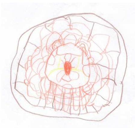
KUVIO 4. "Jumalan katse"

Päiväkodin ryhmässä yhdellä oli erilainen piirustus kuin muilla (kuvio 4). Kuva oli abstraktimpi kuin muiden ja se on moniselitteinen. Tutkija ajatteli piirustuksen esittävän Jumalan katsetta.