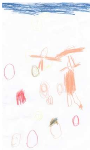
KUVIO 8.”Jumala ja Jumalan perhe”

Seurakunnan esiopetusryhmässä yksi piirustus oli erilainen (kuvio 8). Siinä oli samoja piirteitä kuin muissakin piirustuksissa; siihen oli piirretty sininen taivas ja kuvassa oli selvästi muitakin kuin Jumala, mutta tässä piirustuksessa Jumalalle ei ole piirretty kasvoja.