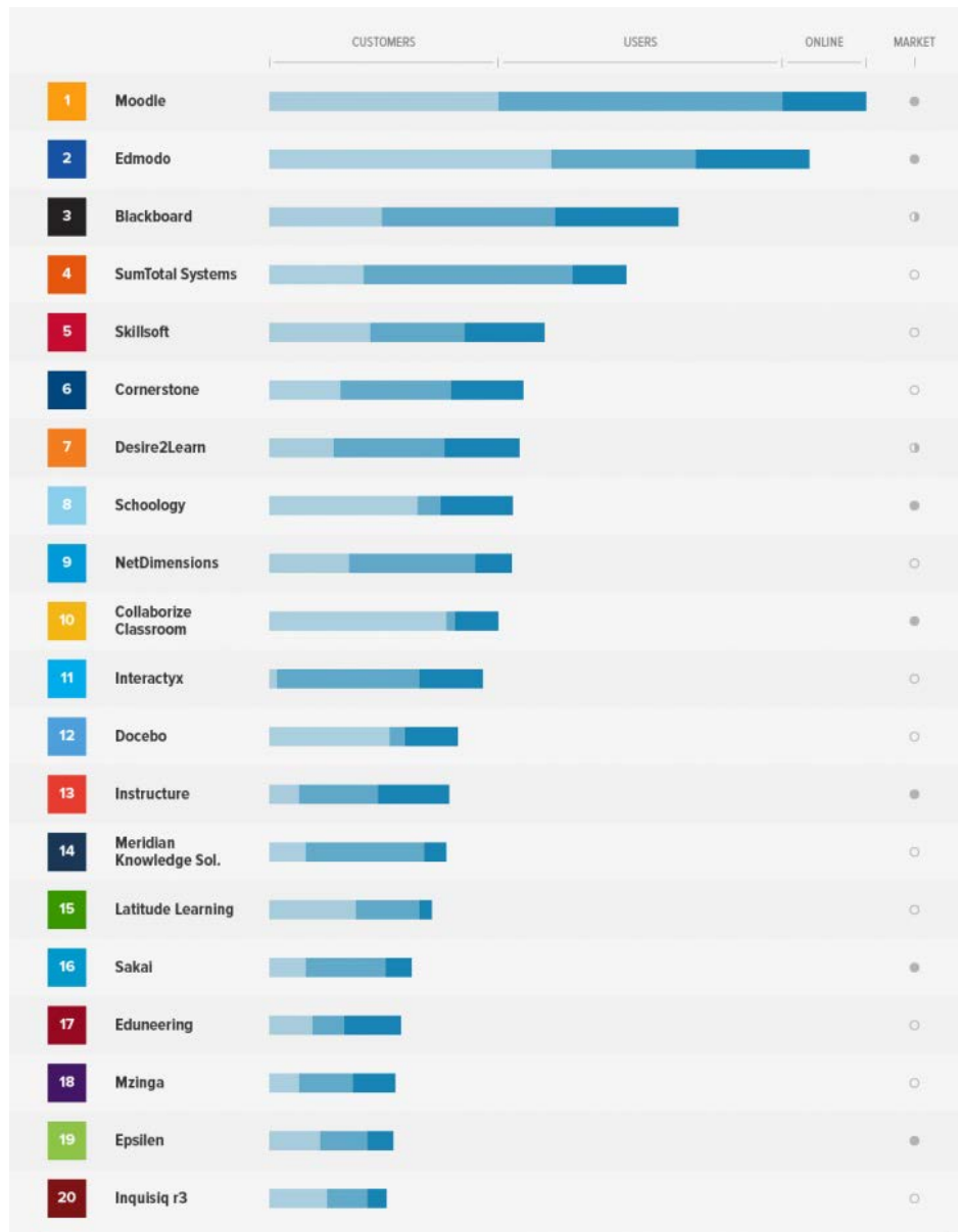
KUVA 1. 20 suosituinta LMS-järjestelmää (TeachThought LLC 2013)

Lähes kaikki Suomen yliopistot ja ammattikorkeakoulut ovat valinneet käyttöönsä Moodle-oppimisympäristön. Avoimeen lähdekoodiin pohjautuva Moodle on myös maailmanlaajuisesti käyttäjämääränä mitattuna suosituin LMS-järjestelmä jättäen taakseen muun muassa kaupallisen Blackboard-järjestelmän (kuva 1). Suomen korkeakouluista puhuttaessa Moodlen lisäksi pääasiallisena LMS-järjestelmänä käytetään Discendum Oy:n Optima-ympäristöä, jonka on valinnut ratkaisukseen alle kymmenen korkeakoulua.