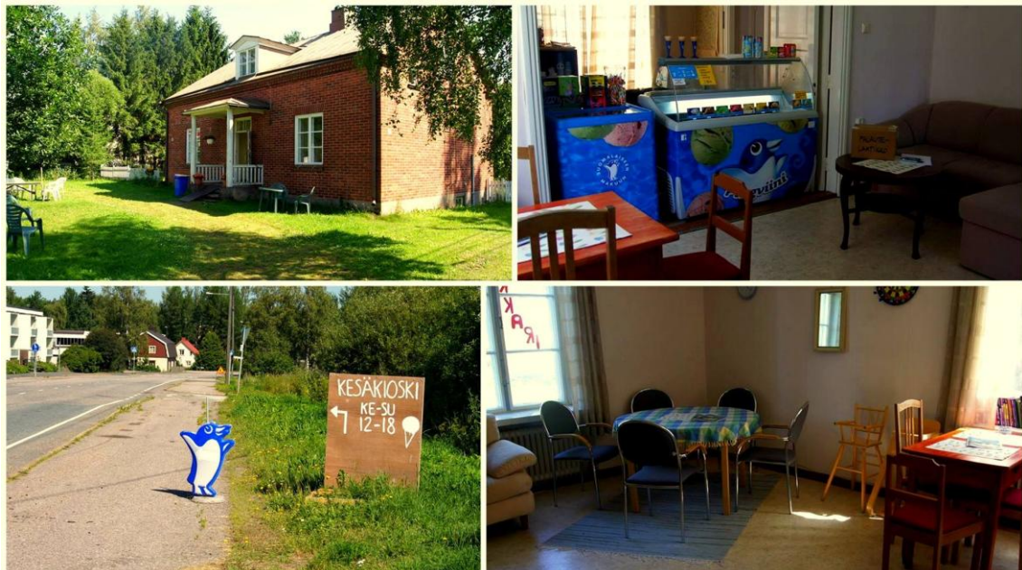
Olohuone muuntautuu moneksi! Kuvia kesäkioskilta ja kylänraitilta.

Kioskin avaaminen herätteli selkeästi kaikkia kylän väestön osia; kävijöissä oli kaikenikäisiä ja palvelulle tuntui olleen tarvetta. Haastava ikäryhmä, ikääntyneet kyläläiset, löysivät myös tiensä kioskille jäätelöostoksille ja rupattelemaan tuttavien kanssa kahvikupin äärelle.