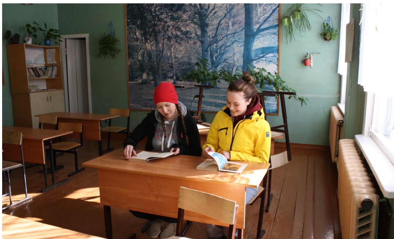
Tiksan kyläkoululla äidinkielen luokassa