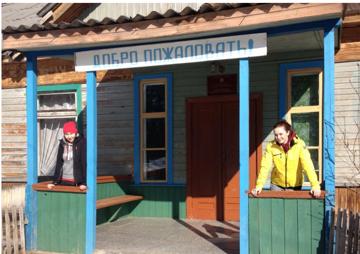
Tiksan koulun sisäänkäynti.