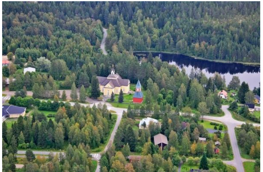
Kuva 1 Enon kirkko ja sitä ympäröivä maisema. Arto Halttunen 2012.

Kirkkoa ympäröi kaunis luonto, jossa kasvaa vanhoja havupuita. Tilaajalle Enon seurakunnalle valmistun tekstiiliteokset uuden seurakuntatalon lukupulpettiin ja alttariin luomaan tilaan esteettisyyttä. Töiden haluan sointuvan seurakuntasalin ikkunoista näkyvän maiseman kanssa, niin että kokonaisuudesta tulee ehyt.