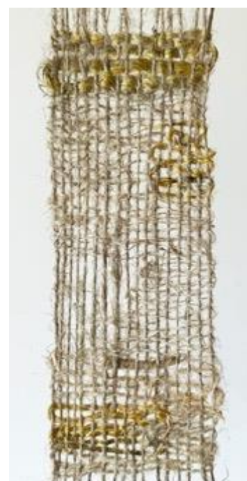
Kuva 29 Käsintehty tekstiilitilkku tekstiiliteoksia varten.

Seurakunnan hyväksytyä ehdotukseni pääsin aloittamaan kudontaprosessin. Käytin teoksien kutomiseen pystykangaspuitani (ks. kuva 31). En ollut aikaisemmin kutonut pystykangaspuilla, mutta opin niiden toiminnan nopeasti. Kudoin ensin pienempiä mallitilkkuja, ennen kuin lähdin kutomaan lopullisia teoksia. Kudoin kaksi 30 x 60 cm mallitilkkuja, joihin hahmottelin kudottavaa pintaa.