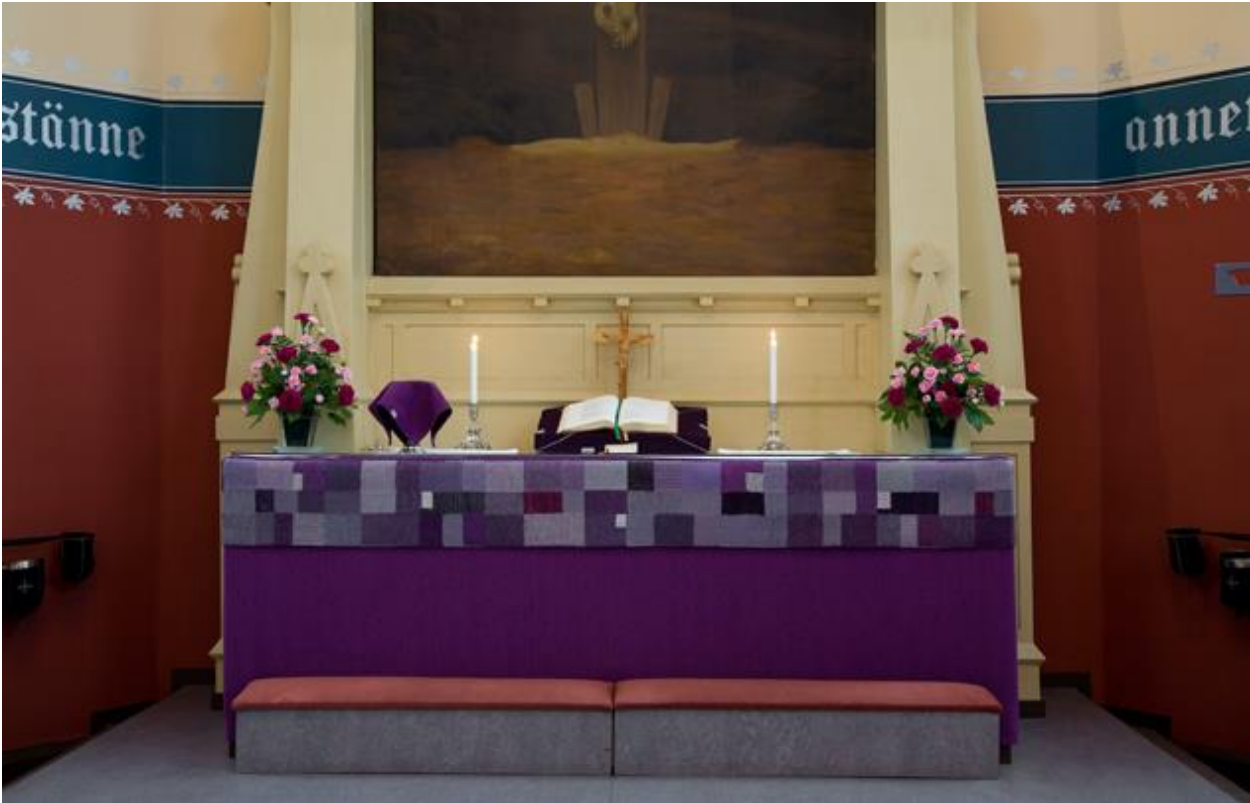
Kuva 13 Riitta Turunen: Liturgiset tekstiilit Joensuun kirkossa, alttariliina.

Kudonnan kulttuurinen historia näkyy Turusen teoksissa paljon. "Kudonta tekniikkana on niin sitä tekstiilin alkua. Sitä ei voi ohittaa", hän toteaa. Turunen pitää kudontaa yhtä merkittävänä kuin muitakin vanhoja taitoja, kuten maalaamista ja grafiikkaa: "Meidän mediamme on tuollainen, se ratkaisee mitä sillä ilmaisee." Turunen painottaa myös käsillä tekemisen tuottamaa hyvää oloa: "Ihmiselle tekee hyvää tehdä konkreettista, se on terapeutista."