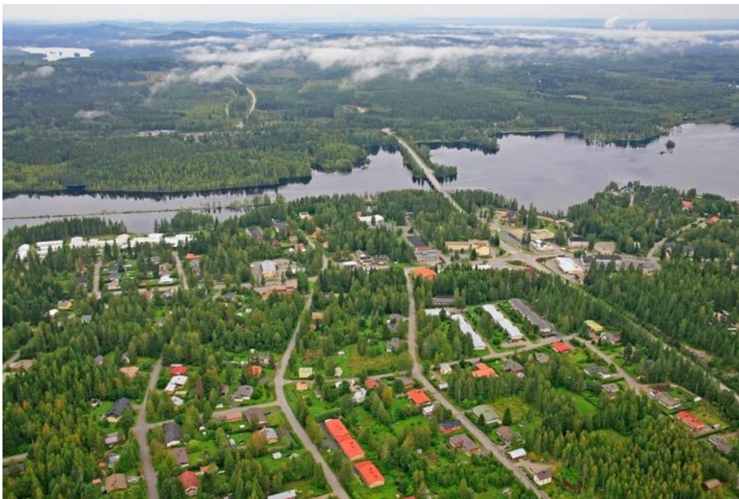
Kuva 15 Enon kirkonkylä ja sen läpi virtaava Pielisjoki. Arto Halttunen 2012.

Opinnäytetyön produktiivinen osuus sisältää kuvauksen kahden teoksen, Oksia on paljon ja Runko on yksi, suunnittelusta ja toteuttamisesta Enon seurakunnalle. Valmiit teokset ovat sijoitettuna Enon uuden seurakuntatalon saliin lukupulpetille ja alttarille. Osiossa esittelen teoksien inspiraation lähteen eli Enon ja sen luonnon, työn prosessin kuvauksen ja valmiit työt.