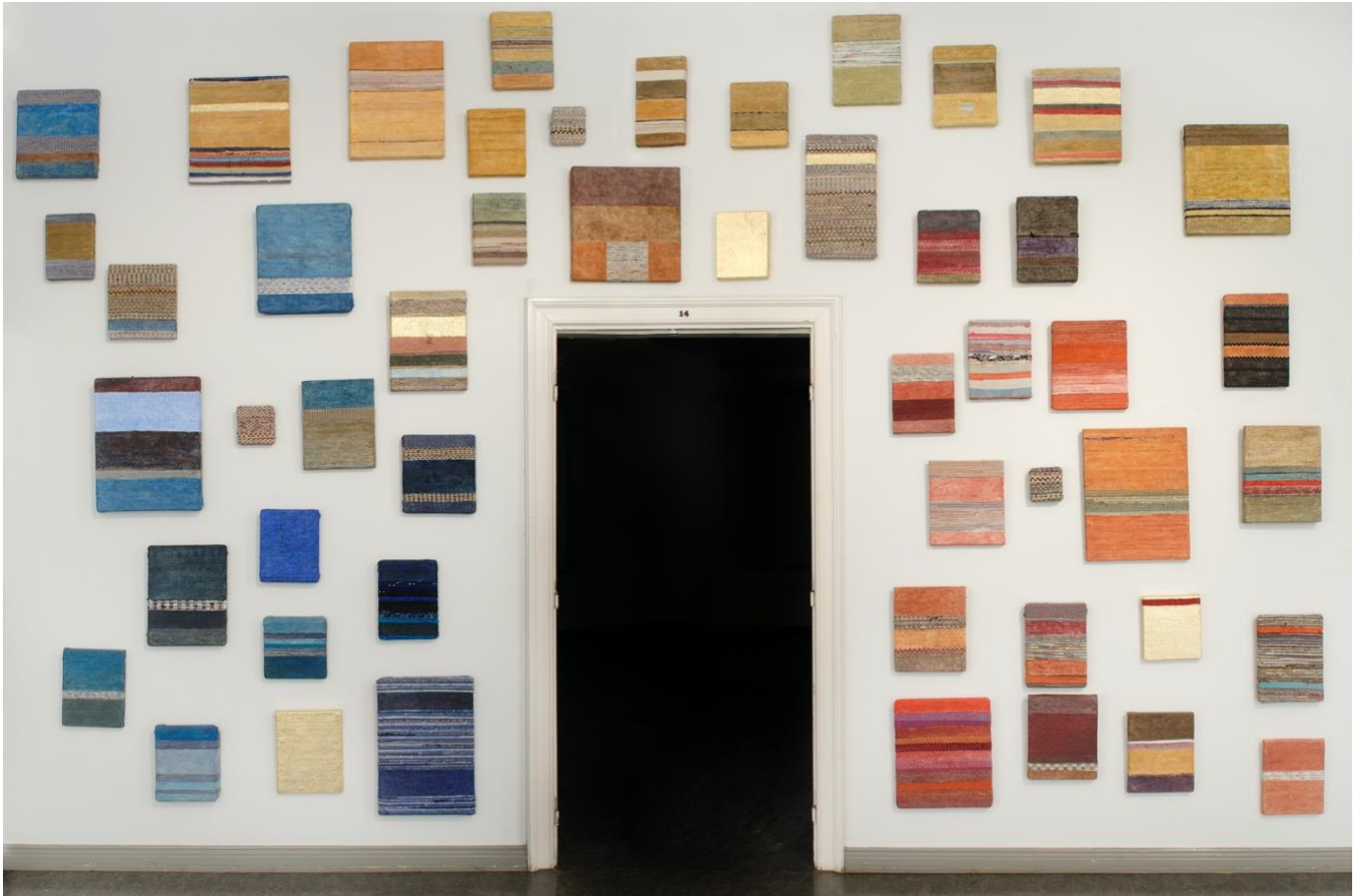
Kuva 5 Riitta Turunen & Aino Lampio: Käsintehty.

Riitta Turusen ja Aino Lampion Käsintehty-teoskokonaisuus (ks. kuva 5) sisältää usean räsymattoista kootun taulun. Taulut ovat saaneet vaikutteita ikoneista, niiden sävyistä ja asettelusta seinälle. Turunen itse kertoo, että teoksella halutaan tuoda esille räsymattojen hienoutta ja ne on haluttu kohottaa esille seinille. Koko suomalaisen räsymattojen kudonnan perinnettä on haluttu tuoda teoksilla esille. Teoksessa itseäni viehättää juuri ikoneista otetut lämpimät ja kuultavat sävyt yhdistettynä vaatimattomimpiin räsyihin. Työt ovat hyvä esimerkki kudotusta taidetekstiilistä, jossa nostetaan esille perinteet uudella omalla ilmaisulla.