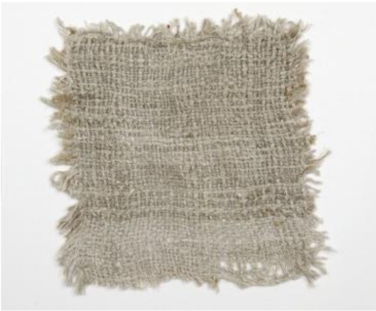
Kuva 26 Patjakangas. Suomen kansallismuseo. 1941.

Halusin visualisoida kudottua pintaa mahdollisimman tarkkaan, joten kudoin käsin pienen tilkun, johon muotoilin, kuinka tiheää kankaan tulisi olla ja millaisia lankoja voisin käyttää (ks. kuva 29). Luonnostelun tekstiilejä piirtäen ja havainnollistin, miltä ne näyttäisivät seurakuntatalon lukupulpetissa ja alttarissa. Kudottuun kankaaseen halusin saman kaltaista pintaa kuin vanhoissa yksinkertaisissa tekstiileissä ja kaarnapuun pinnassa (ks. kuvat 26 ja 27).