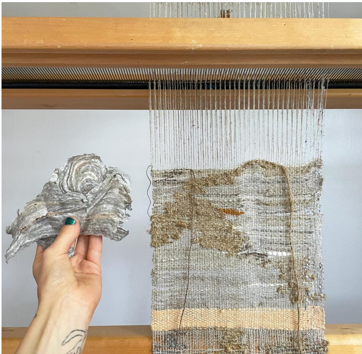
Kuva 33 Mallitilkku kangaspuissa. Sen pinta muodostui luonnollisesti, kuin metsästä löytyneen vanhan ampiasepesän kuori.

Mallitilkkuja tehdessäni havaitsin, että villalanka joustavana ei sopinut pellavaloimen kanssa. Villalankakohdat ovat löysempiä ja epätasaisempia. Kuvasta 34 voi huomata tilkun oikeasta reunasta, että se on hieman epätasainen. Tämän otin myöhemmin huomioon, kun valitsin oikeisiin teoksiin loimilankoja.