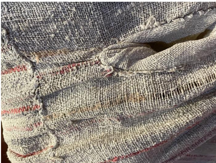
Kuva 4 Lähikuva naisen räsyhameesta. Sortavala 1800-luku. Pohjoiskarjalan museo Hilma.

YK:n kestävän kehityksen tavoiteohjelma Agenda 2030:n mukaan kulttuurinen kestävyys pitää sisällään asioiden kuten kielten, perinteiden ja tapojen säilyttämistä (Huntus 2022). Kestävää kehitystä voi edistää myös taiteen keinoilla. Osiossa selvennän kuinka kudonnan taidon ylläpito voi edistää kulttuurin jatkumoa ja kuinka se tekstiilitaiteessa näkyy.