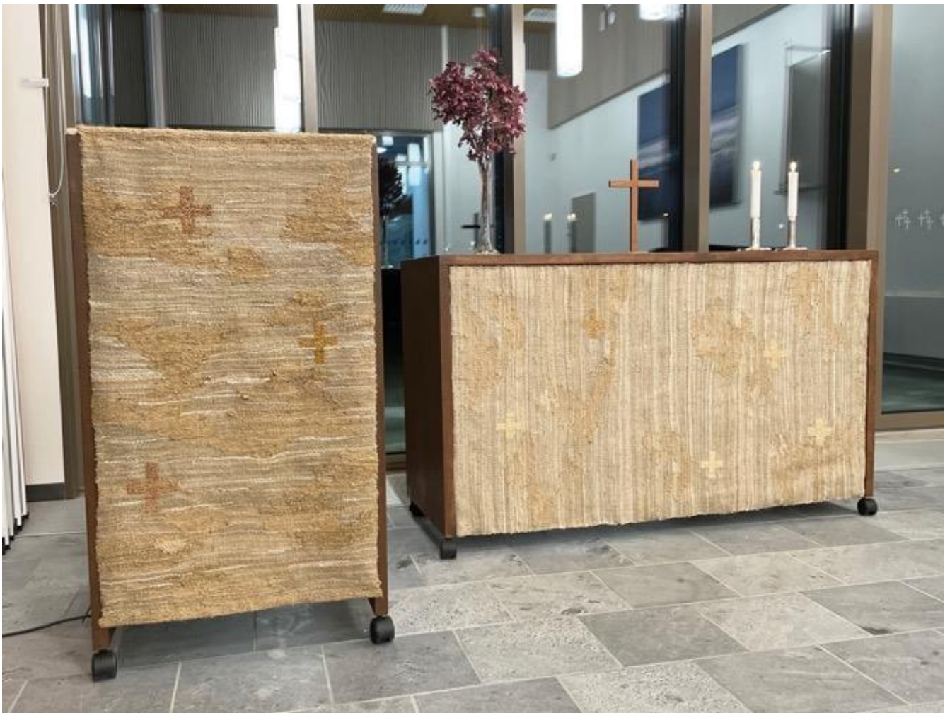
Kuva 40 Teokset asetettuina seurakuntasalin lukupulpetille ja alttarille.