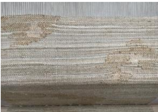
Kuva 37 Altтарin tekstiili kangaspuissa.

Alttarille tulevan teoksen kudonta sujui reippaasti (ks. kuva 37) ja valmistui nopeasti. Käytin sen kuteissa vaaleita pellava- ja puuvillalankoja ja lisäksi tein pienempiä osioita villalangoilla.