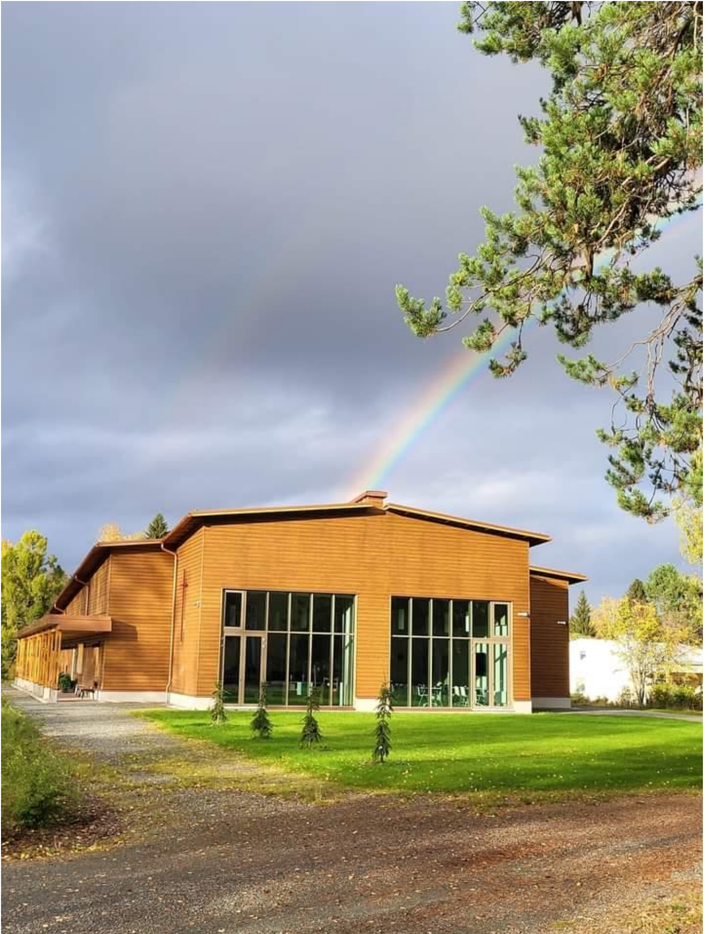
Kuva 2 Enon uusi seurakuntatalo. Aisha Jaatinen 2022.