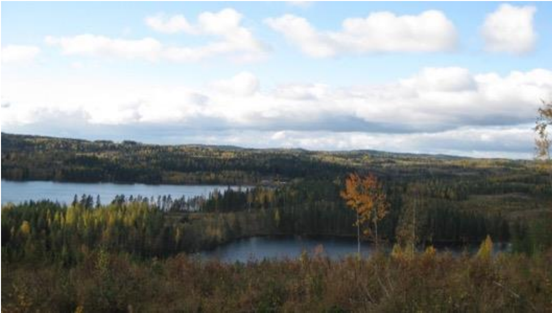
Kuva 18 Vaaramaisema Kaltimolta. Juha Koljonen.

Alueen rauha, turvallisuus ja sen luonto ovat paikan rikkaus. Nämä elementit toimivat lähteenä luovassa tekemisessä, minkä toivon näkyvän suunnittelemissani teksteissäkin.