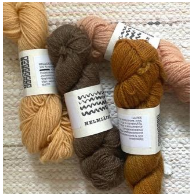
Kuva 32 Idän kehräämön villalankoja.