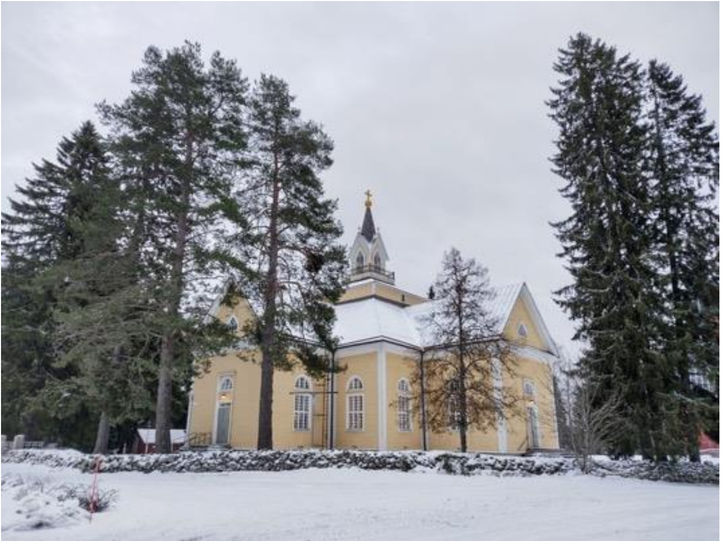
Kuva 24 Enon kirkko. Maiju Ahlholm 2023.