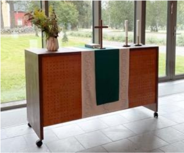
Kuva 21 Altari, johon suunnittelen tekstiilin.