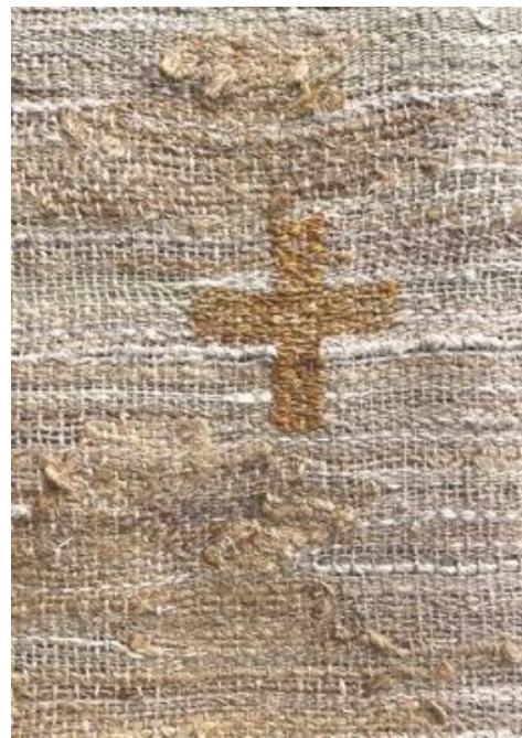
Kuva 44 Yksityiskohta lukupulpetin tekstiilin pinnasta.