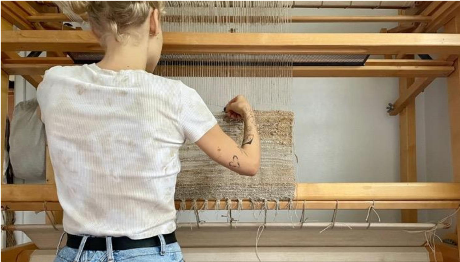
Kuva 35 Kutomassa lukupulpetin tekstiiliä.

Lokakuun puolivälissä kävin esittelemässä tilkut Joensuun seurakuntayhtymän taidetoimikunnalle. Kerroin teoksen etenemisestä ja sen hetken työvaiheesta. He pitivät ideasta, ja samalla keskustelimme töiden sisältämästä symboliikasta ja töiden asettelemisesta lukupulpettiin ja alttariin. Minulle ehdotettiin, että töissäni voisi olla kristillistä symboliikkaa, kuten ristejä. Ehdotin tekeväni mallitilkkuun esimerkkejä kirjotuista risteistä, joita voisin esitellä seuraavassa tapaamisessa. Sovimme uuden ajankohdan, jolloin esittelen lukupulpettiin tulevaa teosta ja kirjontatestauksia.