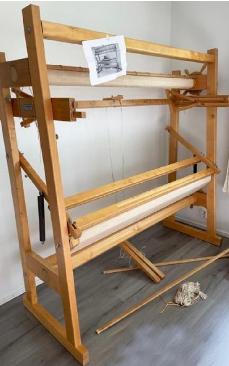
Kuva 31 Pystykangaspuut joilla kudon tekstiiliteokset.

Loimilangoissa käytin luonnonvärisiä puuvilla- ja villalankoja (ks. kuva 30). Kuteena käytin useampia erilaisia pellava-, puuvilla- ja villalankoja. Osa langoista oli luonnonvärisiä, mutta vahvemman sävyiset langat olivat nurmeslaisen Idänkehräämön kasvivärjättyä villalankaa (ks. kuva 32). Kudontaprosessi lähti nopeasti käyntiin, ja pinnan luominen sujui luontevasti.