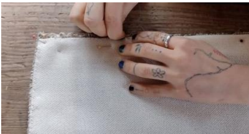
Kuva 38 Pohjakankaan ompelu.

Teoksen valmistuttua aloin viimeistellä tekstiilejä. Kirjoin tekstiileihin ristejä, lukupulpettiin tulevaan teokseen kolme ja alttarille tulevaan teokseen viisi ristiä. Kirjontalankoina käytin luonnonläheisiä ruskean ja beigen eri sävyisiä villa-, puuvilla- ja silkkilankoja. Pienempiin tekstiiliteoksen risteihin kirjoin myös kuparilankaa. Kirjottuani ristit päättelin ja silitin työt (ks. kuva 39) ja ompelin niihin pohjakankaan (ks. 38). Pohjakankaana käytin kierrätettyä valkoista puuvilla-viskoosikangasta. Pohjakangas toi töihin ryhtiä ja ne laskeutuivat paremmin. Töiden valmistuttua niille syntyi myös nimet: Oksia on paljon ja Runko on yksi. Nimet ovat virrestä ja kuvaavat hyvin inspiraation lähdettäni, luontoa, puita ja kaarnaa (ks. liite 2).