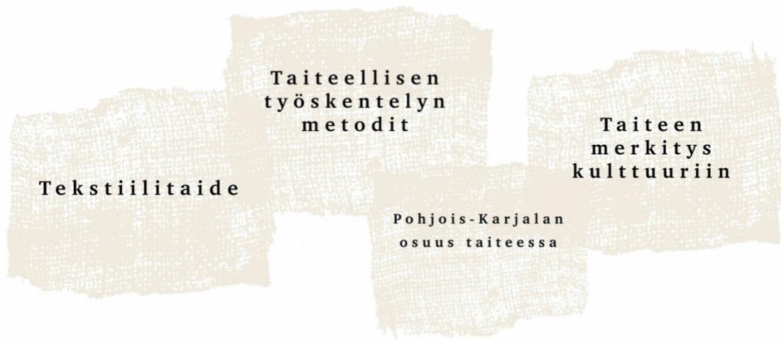
Kuva 8 Haastattelujen aiheet.