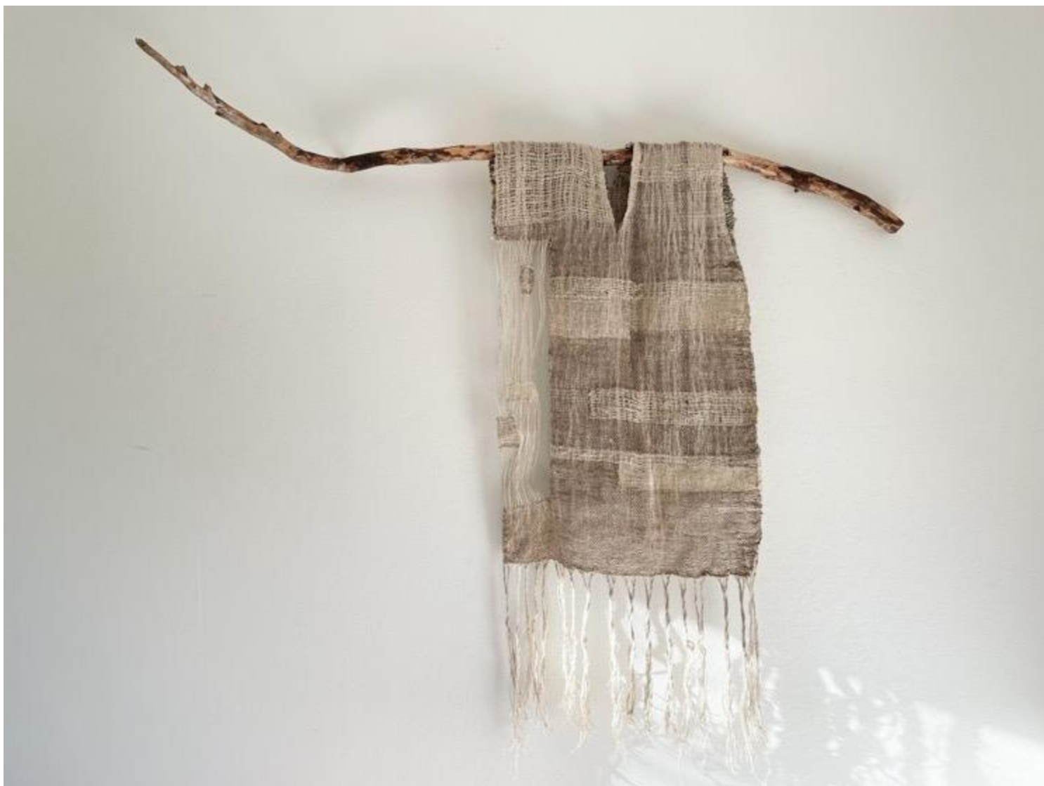
Kuva 25 Kutomani Kolttu 1 -teos 2023.