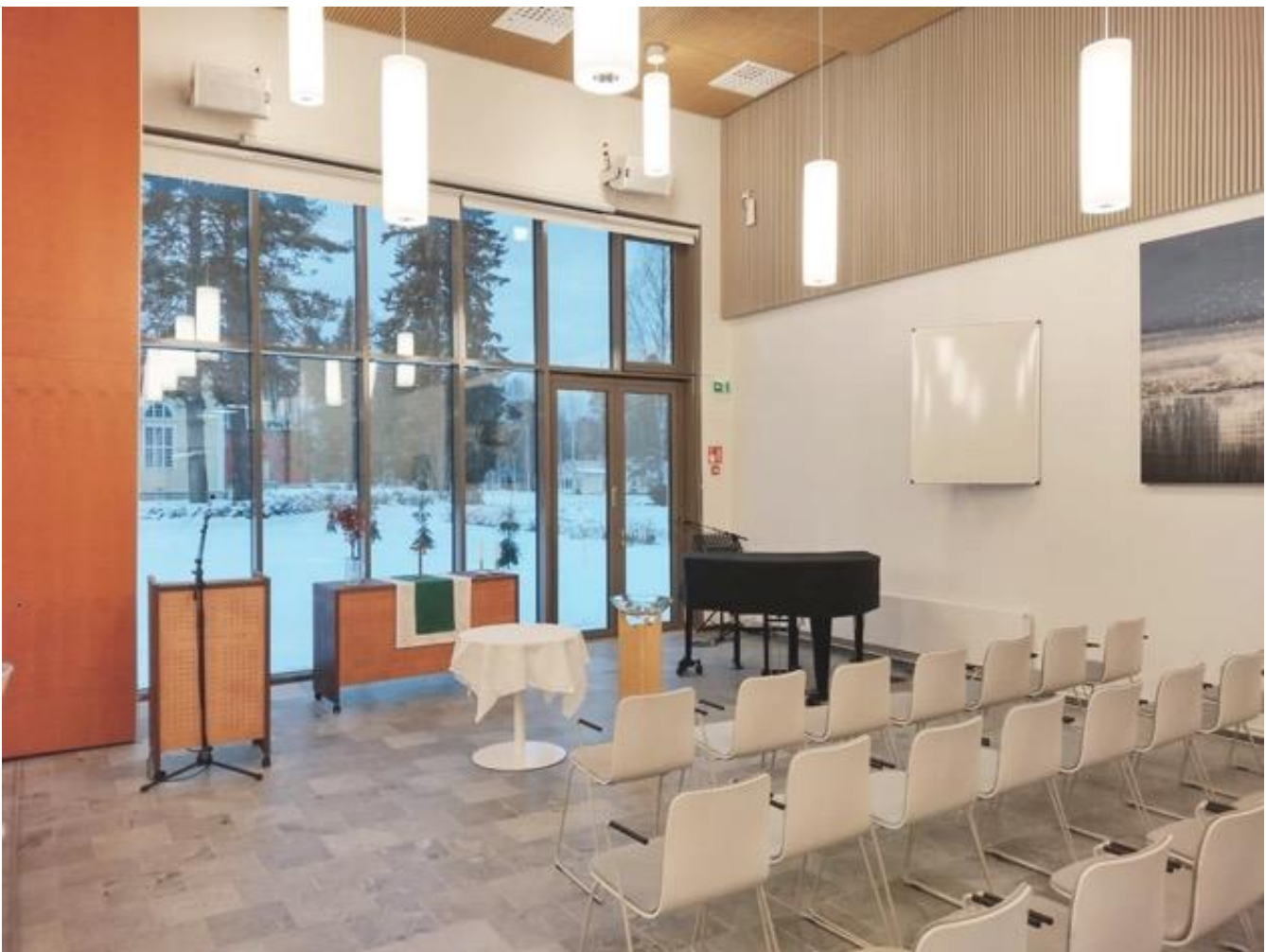
Kuva 23 Enon seurakuntatalon sali, johon tekstiilit tulevat. Maiju Ahlholm 2023.