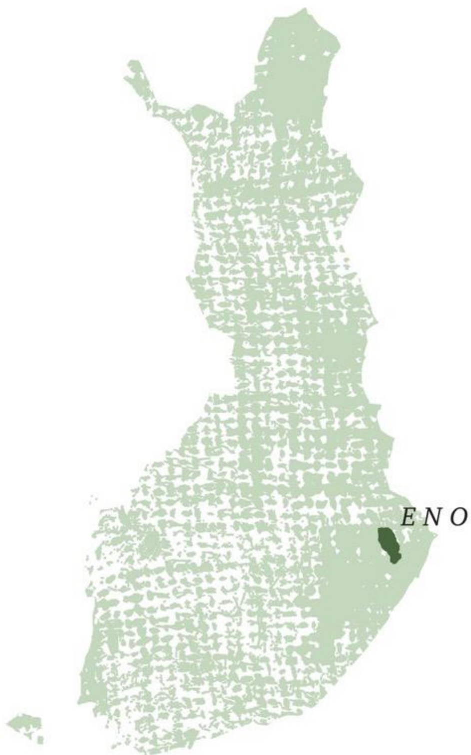
Kuva 20 Eno Suomen kartalla.