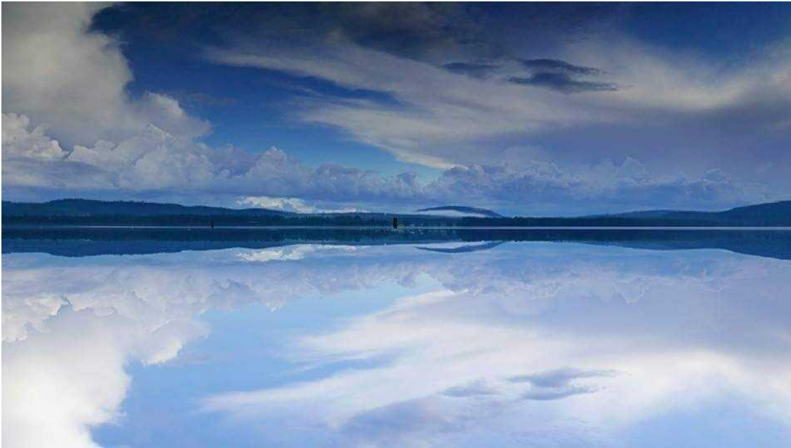
Kuva 16 Pielinen. Anu Rajamäki.