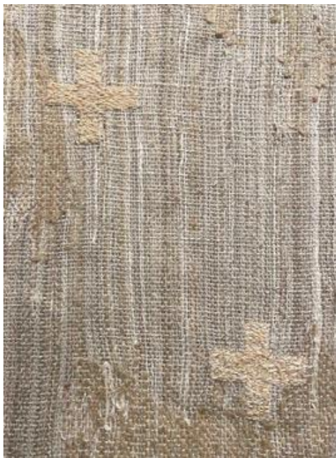
Kuva 43 Yksityiskohta alttarin tekstiilin pinnasta.