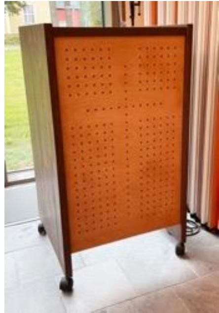
Kuva 22 Lukupulpetti, johon suunnittelen tekstiilin. .