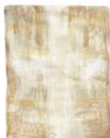
vaiktoehto, jossa ristimuoto läpikuultavaa