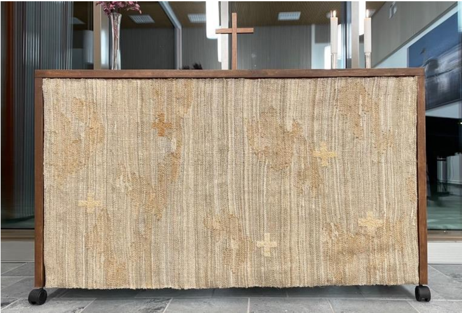
Kuva 42 Altarin tekstiili Runko on yksi.