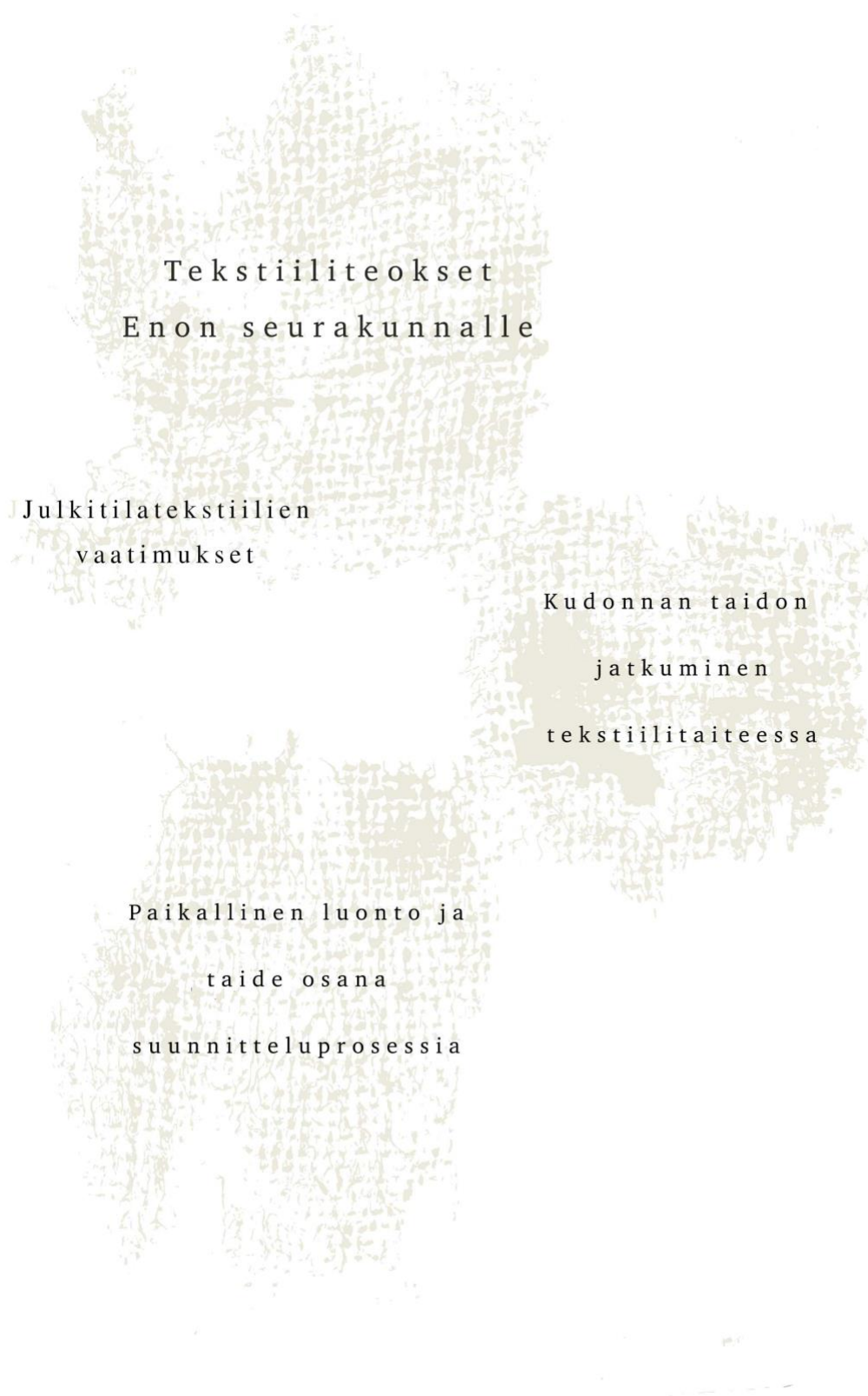
Kuva 3 Opinnäytetyön viitekehys.