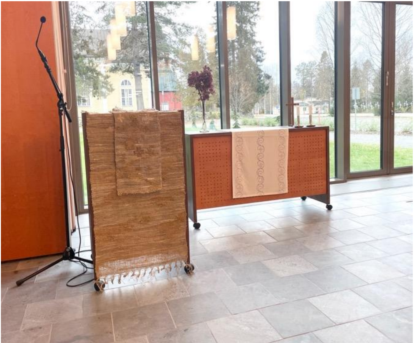
Kuva 36 Kokeilemassa tekstiilejä seurakuntatalolla.

Esittelin lukupulpetin tekstiilin myös taidetoimikunnalle ja kerroin prosessin etenemisestä. Yhdessä Nissin ja Turusen kanssa tulimme tulokseen, että kirjon ristejä kumpaankin tekstiiliin. Esittelin myös toimikunnalle kirjontamalleja ja töiden ripustustapoja.