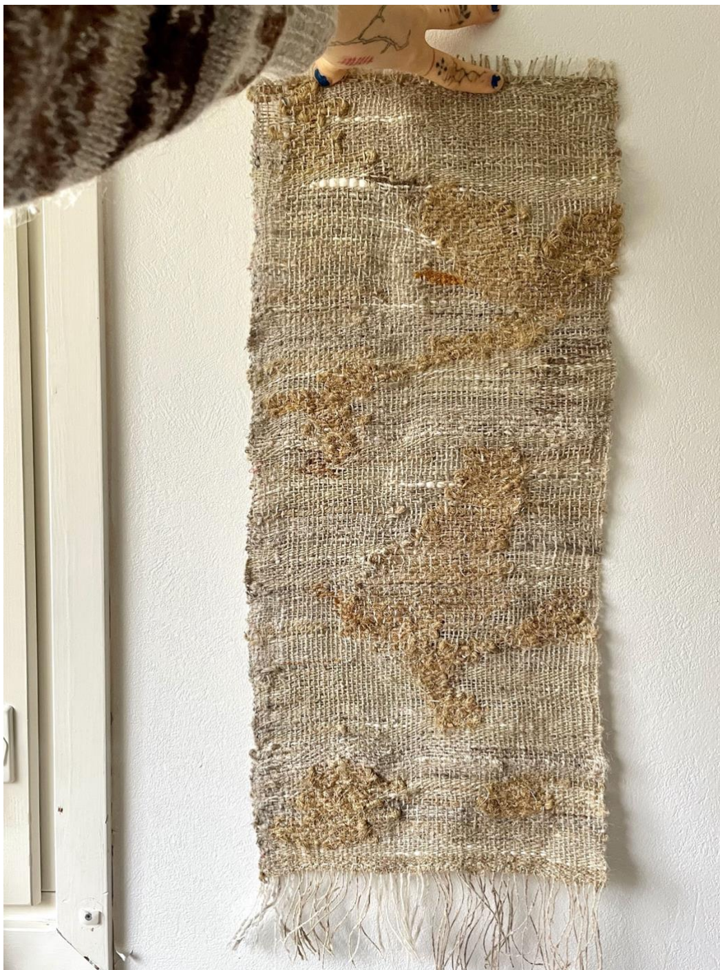
Kuva 34 Valmis mallitilkku.