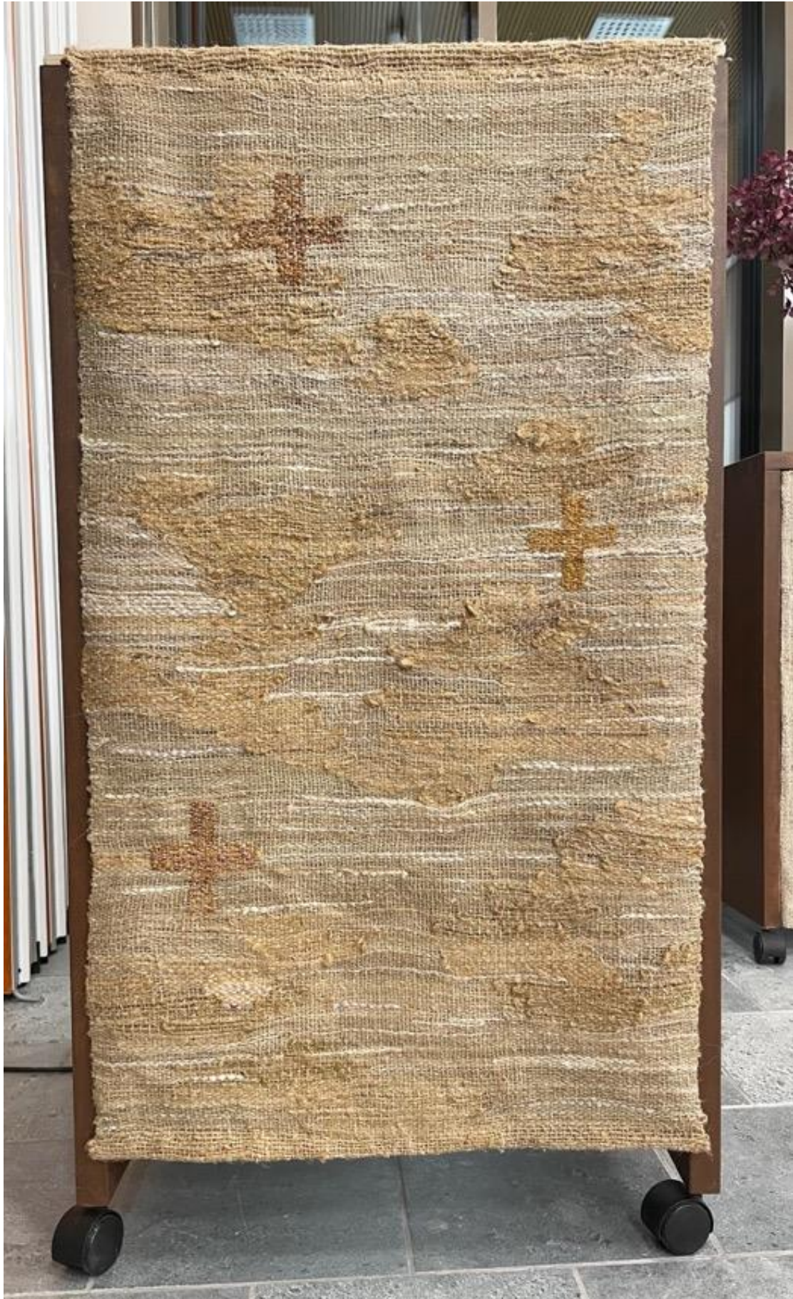
Kuva 41 Lukupulpetin tekstiili Oksia on paljon.