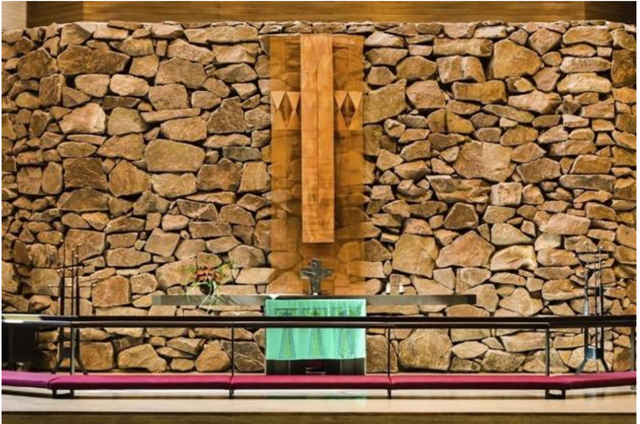
Kuva 7 Irma Kukkasjärvi: Mysterium Crusis spes Unica (Ristin salaisuus, ainoa toivo), 1999.

Espoonlahden kirkossa sijaitseva Irma Kukkasjärven laatima teos (ks. kuva 7) on asetettu kirkon alttarille alttaritaulun sijaan. Kukkasjärvi toimi tekstiilitaiteen uudistajana ja hyödynsi rohkeasti teoksissaan monenlaisia materiaaleja (Poutasuo 2001, 67), kuten yllä näkyvässä kuvassa kuparilankaa. Teos on lahjoitettu kirkolle. Tekstiili sopii tilaan ja erityisesti taustan kiviin, jotka kuultavat sen läpi. Koska olen itse suunnittelemassa seurakunnan tilaan tekstiiliteoksia, halusin valita myös kirkossa sijaitsevan teoksen. Työssä inspiroi sen geometrisuus, mutta samaan aikaan luonnollisuus. Se sopii hyvin tilaan, vaikkei sitä ole sinne varta vasten suunniteltu.