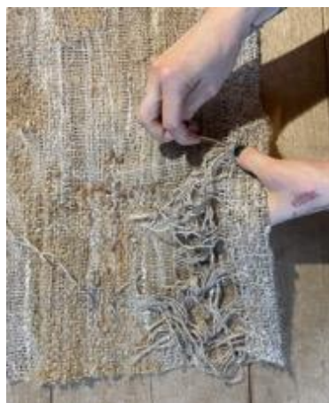
Kuva 39 Loimilankojen päättely.