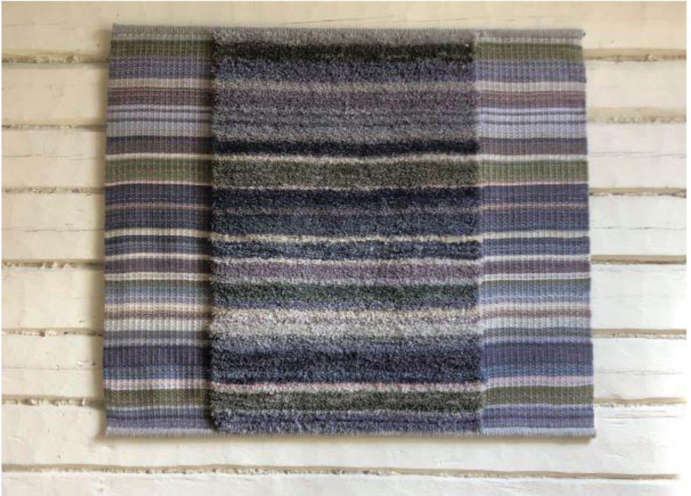
Kuva 14 Riitta Turunen: Heinävesi-ryijy.