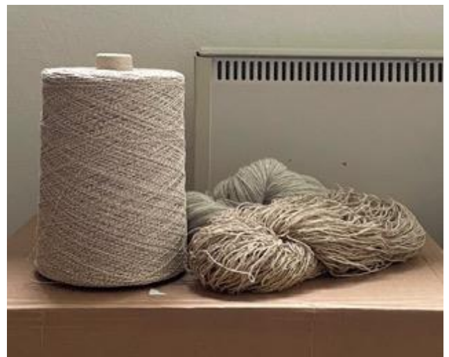
Kuva 30 Loimilankoja.