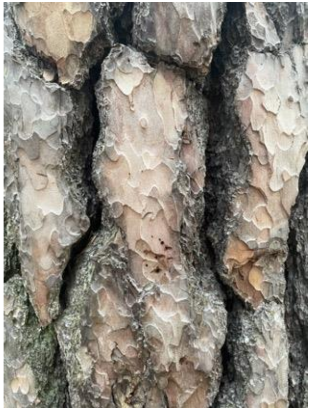
Kuva 27 Männyn kaarnaa.