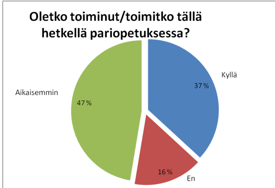
Kuvio 2 Vastaajien pariopetuskokemus

Halusimme tietää vastaajien pariopetuksesta käyttämää nimitystä. Opetusmenetelmällä näytti tutkimuksen mukaan olevan useita nimiä käytössä. Näitä olivat pariopetus, tiimiopetus, samanaikaisopetus, yhteistoiminnallinen opetus, tukioetus, samanaikaissähläys ja vertaisopetus.