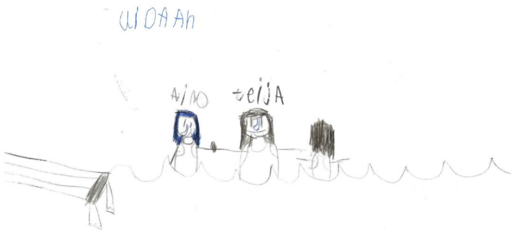
KUVIO 1. Lapsen piirros itsestään ja tukikaveristaan uimassa