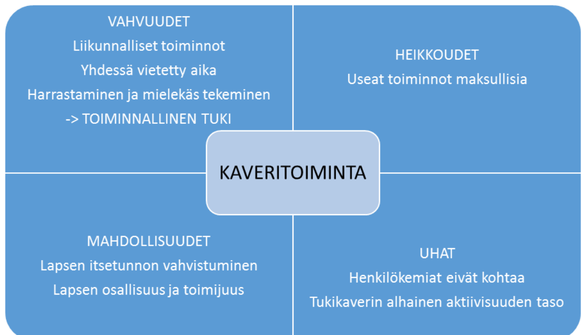
KUVIO 2. SWOT-analyysi johtopäätöksistä

ovat aikuisen huolenpito ja suotuisat kasvuolosuhteet, toteavat Nurmi ym. (2011). Nurmi ym. korostavat myös, että lapsen osallisuuden toteutuminen on aina aikuisen vastuulla. Pelkkä mielipiteen ilmaiseminen ei riitä, vaan lapsen täytyy todella kokea, että on saanut olla mukana vaikuttamassa itselle tärkeisiin asioihin. Lapsen osallisuuden toteutuminen riippuu siis tukikaverista. Lasten vastauksista tulee ilmi, että lapset ovat saaneet tehdä sellaisia toimintoja, joista ovat pitäneet. Myös vanhemmat ovat sitä mieltä, että lapset ovat saaneet tehdä itselleen mielekkäitä asioita. Yksi vanhemmista totesi, että henkilökemioilla ja aktiivisuuden tasolla on merkitystä ajatellen tukikaverin ja lapsen välistä vuorovaikutussuhdetta. Korhosen (2012) mukaan aikuisen ja lapsen välinen tukisuhde muodostuu hiljalleen tapaamisten myötä. Alussa tukihenkilön on oltava aktiivisempi osapuoli. Aito kiinnostus lapsesta, juttelu lasta kiinnostavista asioista ja aloitteiden teko edesauttavat tukisuhteen muodostumista. Alla kooste johtopäätöksistä SWOT-analyysin muodossa. (KUVIO 2.)