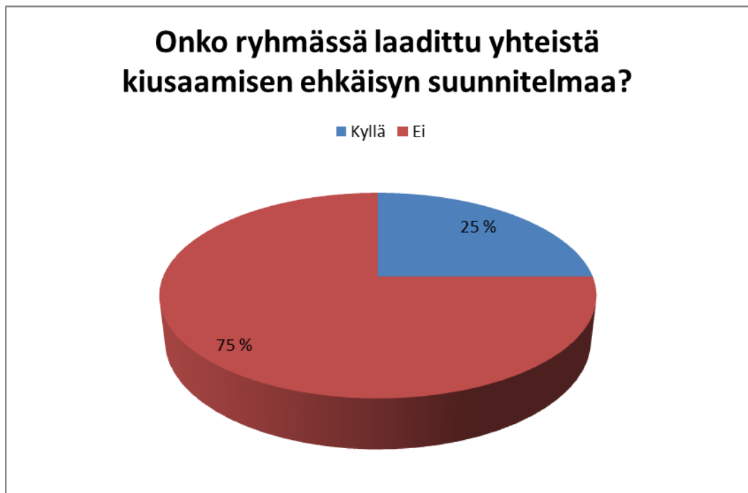
Kuva 4. Kartoitus ryhmäkohtaisten suunnitelmien laatimisesta (N = 56)

Lopuksi kysyin työntekijöiden mielipidettä siitä, onko heidän mielestä kiusaaminen yleisesti hallinnassa kunkin omassa toimintayksikössä. Vastaajista vain kolme (3) oli sitä mieltä että ei ole. Heidän mielestään esimerkiksi lasten pihavalvontaan ja leikin valvontaan yleensä tulisi panostaa ja kiinnittää huomiota enemmän. Sen lisäksi työntekijöiden tulisi vastausten mukaan laatia tarkat yhteiset pelisäännöt jota kaikki noudattaisivat. Arvokeskustelut olivat myös yksi ehdotus tilanteen korjaamiseksi.