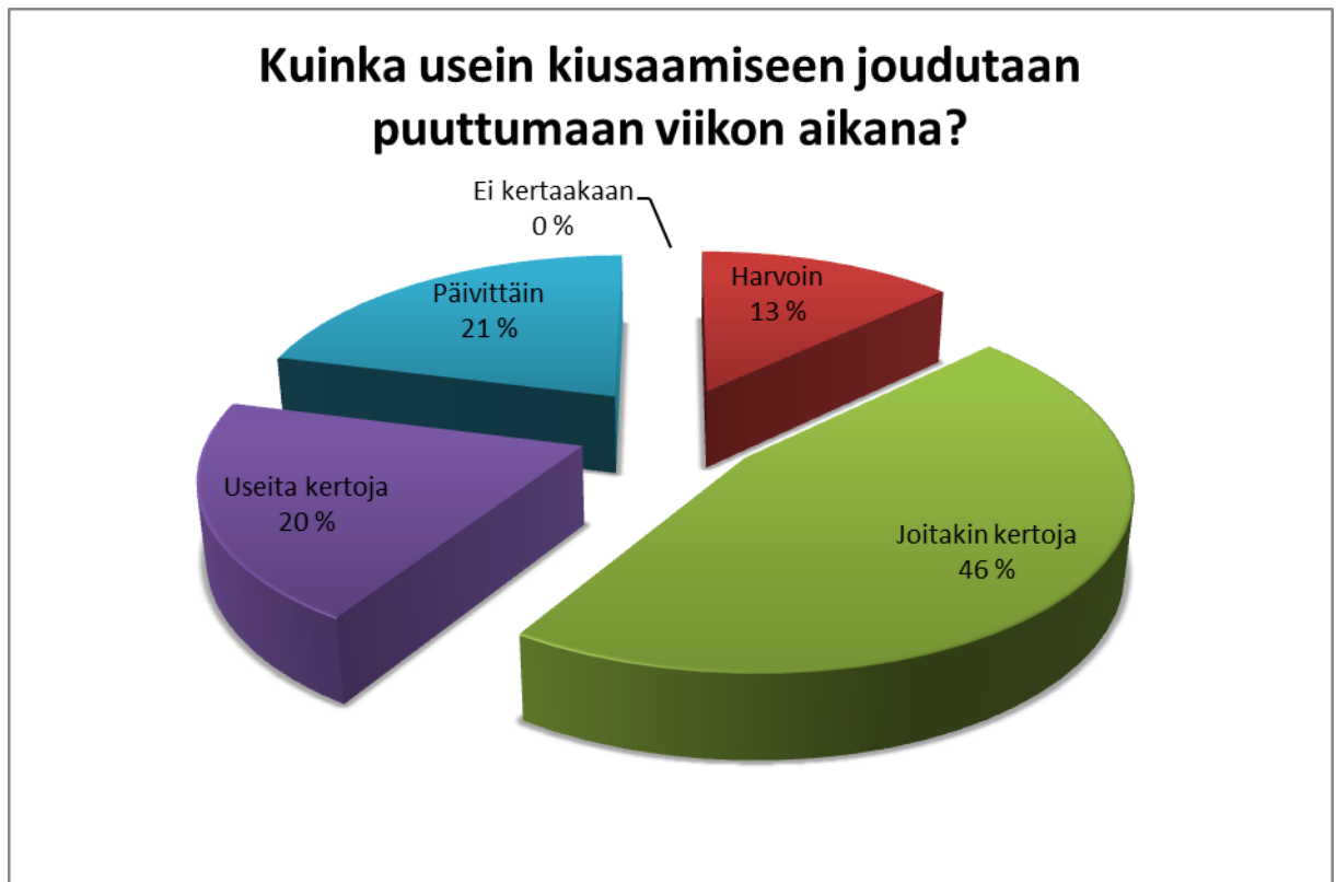
Kuva 2. Kiusaamiseen puuttuminen viikon aikana (N = 56)

Kartoitin myös sitä, ovatko työntekijät havainneet sukupuolten välisiä eroja kiusaamisen yleisyydessä. Otanta sisältää kaikki ikäryhmät. Suurin osa, 64 prosenttia kaikista vastaajista, eli 36 vastaajaa oli sitä mieltä, että kiusaaminen on yhtä yleistä niin tytöillä kuin pojilla eivätkä he ole havainneet eroja. 11 prosenttia vastaajista oli sitä mieltä, että tyttöjen keskuudessa kiusaaminen on yleisempää ja 21 prosenttia puolestaan sanoi kiusaamisen olevan yleisempää poikien keskuudessa. Vastaajista 4 prosenttia ei osannut arvioida eroja. (Kuva 3.) Odotin itse suurempaa hajontaa tyttöjen ja poikien välillä, tosin on huomattava että tyttöjen ja poikien kiusaamistavat eroavat usein paljon toisistaan.