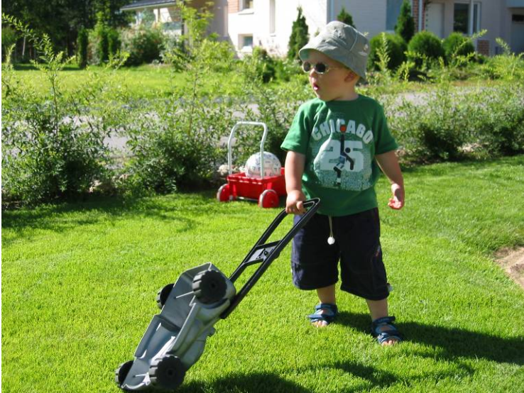
Kuva 7. Oikeat työvälineet iän ja taitojen mukaan, mahdollisesta vastustuksesta huolimatta.