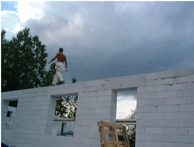
Kuva 11. Polku kohti opettajuutta rakentuu kivi kiveltä, kokemuksen kasvaessa työn ja oppimisen vuorovaikutuksessa

Nykyaikana opettaja kohtaa myös paljon haasteita työssään. Yksi vaativimmista on kasvattajana toimiminen. Kun ajattelen opettajuuttani ja rooliani kasvattajana, tuntuu siltä että sillä saralla on vielä paljon opittavaa ja tieni hyväksi kasvattajaksi on vielä alkuvaiheessa. TAOKK:n opinnoissa ei kovinkaan paljon sivuttu opettajan toimimista kasvattajan roolissa. Erityispedagogiikan ja kasvatopsykologian opintojaksoilla raapaistiin asian pintaa, mutta syventyminen jää mahdollisten jatko-opintojen ja itse opiskelun varaan. Kasvatuksellisten asioiden ja ns. elämäkatsomuksellisten asioiden opettaminen eri-ikäisille opiskelijoille vaatii kokemusta ja teoriapohjaa, jota monellakaan ammatillisen aineen opettajalla ei ole. Ja ellei ole tietoa eikä taitoa, niin em. asian opettaminen tai tarjoaminen opiskelijoille itse opiskeltavan aineen ohessa on käytännössä mahdotonta. Henkilökohtaisten kokemusten pohjalta voin sanoa että parasta opetusta olen saanut sellaisilta opettajilta jotka ovat opetettavan aineen lisäksi jollakin tavalla pystyneet sivistämään ja kehittämään minua ns. paremmaksi ja tiedostavammaksi ihmiseksi. Ihme kyllä, tällaisiakin opettajia