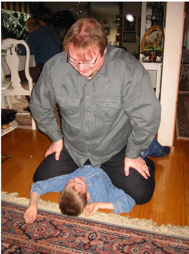
Kuva 6. Mitäs nyt sanot? Opettajalle ei pullikoida tai ottaa ohraleipä.