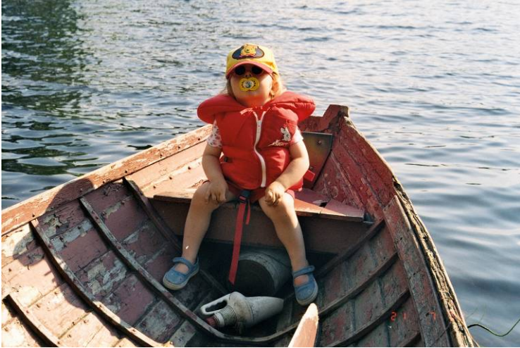
Kuva 2. Mä oon kapu ja määrään tahdin, muut saa soutaa.

Ala-asteella on opettajan jossain määrin mahdollista määrätä ja pakottaa oppilaita tekemään asioita vasten omaa tahtoaan, mutta yläasteella em. menettelytapa ei enää käy kovinkaan hyvin päinsä. Monesti oppilaiden aliarvioiminen ja vähättely osoittaa että opettajalla on ongelmia tulla toimeen itsensä, työnsä, tai/ja muiden ihmisten kanssa. Yläasteen murrosikäiset nuoret eivät tätä ymmärrä, vaan leimaavat opettajan idiootiksi tai vastenmieliseksi tyypiksi, jonka antamat tehtävät suoritetaan vastahankaisesti ”tampioaikan” pakkopullana. Hyvät tyypit ja opettajapersoonat tunnistetaan nopeasti ja heidän tunneillaan yleensä viihdytään ja opiskelu maistuu suurimmalle osalle oppilaista. Yläasteella opettajan ihmissuhdetaitojen tarpeellisuus ja osaaminen nousevat esille aivan eri tavalla kuin ala-asteella. Ala-asteella opettajan auktoriteetti riittää, tai ainakin pitäisi riittää, kurin ylläpitämiseen luokassa ja suunnitellun opetuksen läpivientiin.