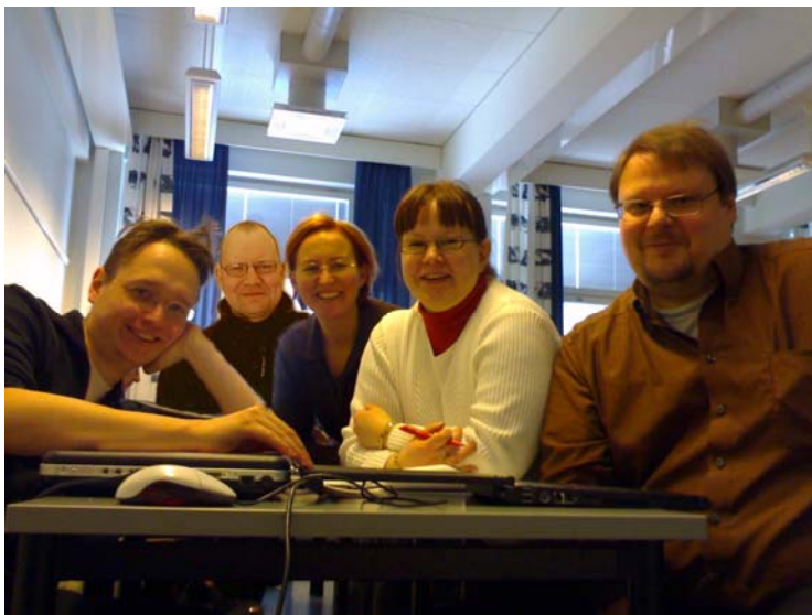
Kuva 1. OpeX-ryhmä kovan opiskeluputken runtelemana keväällä 2006.

Ryhmä OpeX perustettiin syksyllä 2004 TAOKK:n kurssin 36 opetuksen alkaessa. Ryhmämme alkuperäinen koko oli seitsemän henkeä, mutta opiskelun aikana ryhmän koko supistui viiteen opiskelijaan, jotka ovat myös tämän kirjan laatijat (Kuva 1).