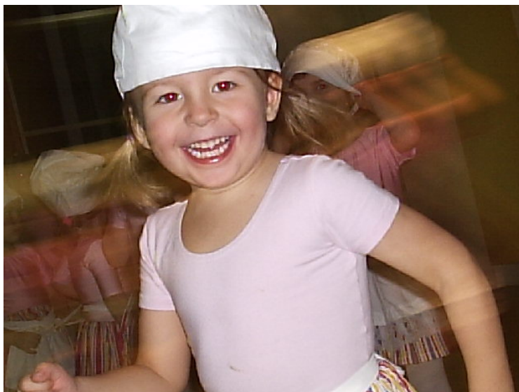
Kuva 5. Jippii, tää on kivaa...

Joka kuukausi oli luovan toiminnan tunnit, jolloin kaikki halukkaat saivat esiintyä, näytellä tms. Pidimme myös koko koululle esityksiä; iltamia. Kaikki huipentui tunnin mittaiseen Goppelia-balettiin, jossa kaikki oppilaat olivat mukana, niin esiintyjinä kuin rakentamassa lavasteita tai muuta tarvittavaa esitykseen liittyvää. Balettia esitettiin sitten moneen otteeseen suurella suosiolla. Harmi, kun silloin ei huomattu kuvata esitystä.