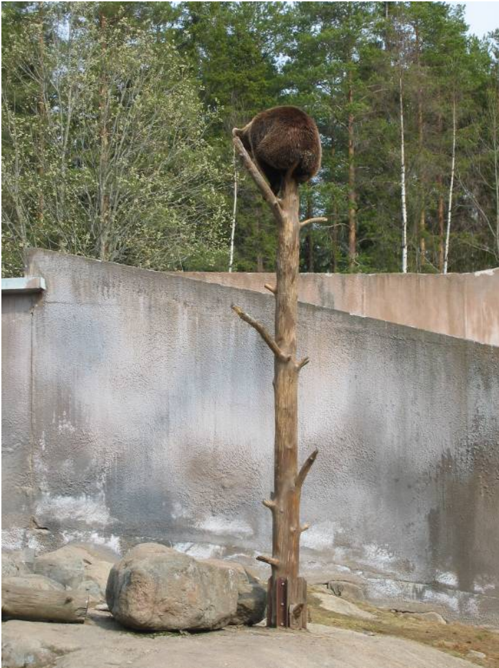
Kuva 8. Minäkö muka nostanut itseni jalustalle, ei pidä paikkaansa...Arvatkaas muuten mikä paikka tässä on kovilla?

pystyä käsittelemään asia harkitusti, oikeuden mukaisesti ja rauhallisesti läpi, jotta palaaminen normaaliin päiväjärjestykseen olisi mahdollista. Samalla hän osoittaisi hallitsevansa itsensä ja omaavansa itsekunnioitusta sekä käytöstapoja, joita hän myös odottaa omien oppilaidensa omaavan. Hieman huumoria auttaisi myös asian käsittelyssä.