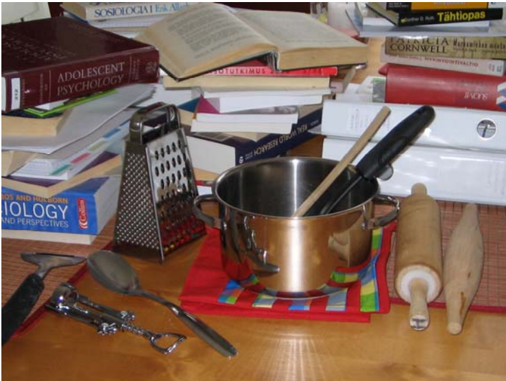
Kuva 3. Ansoituneen opettajan ja opiskelijan keittiö saattaa näyttää tältä.

Sulata vesihauteessa suklaa ja voi. Anna jäähtyä. Vaahdota munat ja sokeri. Sekoita vaahtoon jauhot, joihin leivinjauho ja vanilliinisokeri on sekoitettu. Lisää suklaavoiseos. Kaada taikina n. 2 litran vuokaan. Paista 175 asteessa n.55 min. Halkaise jäähtynyt kakku kolmeen kerrokseen. Kostuta laimentamattomalla mansikkamehulla. Levitä väliin mansikka murska. Sulata suklaa vesihauteessa, lisää kerma ja voi. Kuorruta kakku. Tarjoile kermavaahdon ja mansikoiden kera. Nauti!