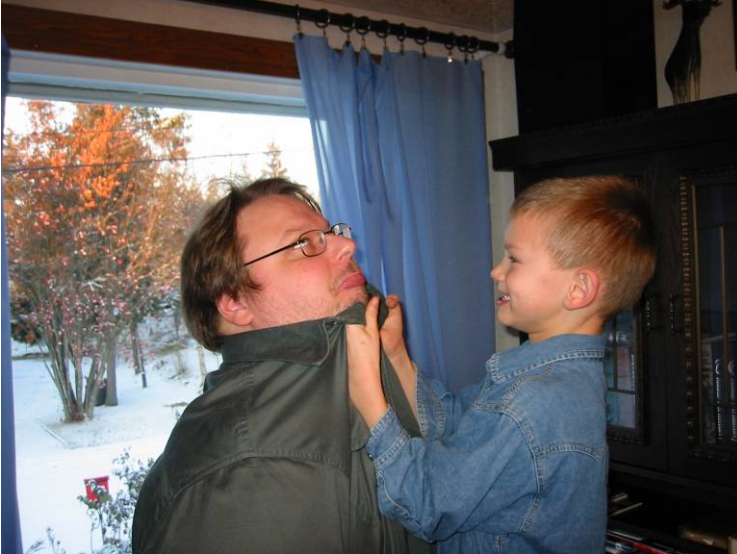
Kuva 9. Jaa kenelle se ottikaan ohraleipä? Tulevaisuuden toivot pesevät vanhat kääkät menen tullen.