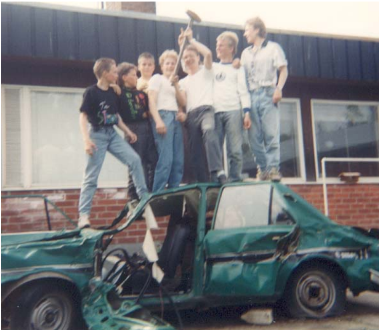
Kuva 4. Tulihan siitä Skodasta vielä riemuakin, kun saatiin porukalla rusikoida se palasiksi...Nuorison täytyy saada purkaa patoutumansa.

johtaa kiusaamiseen tai ainakin sen yrittämiseen. Oli pitkälti lapsen luonteesta kiinni, johtiko provosointi pitempiaikaiseen kiusaamiseen vai jäikö se lyhytaikaiseksi. Yleisiä syitä kiusaamisen aloittamiseen ovat esimerkiksi ulkoiset seikat, olosuhteiden tilapäinen tasapainottomuus, esimerkiksi paikkakunnalle muuton takia, tai vaikkapa kotiolosuhteet. Omalta kohdaltani muistan todella pahaksi tilanteeksi niinkin vähäpätöisen asian kuin vanhempieni auton vaihtamisen. Menivät mokomat vaihtamaan Saabin Skodaan, tuohon kummallisen näköiseen takamoottoriseen autoon, joka ei pikkupoikien arvoasteikossa kohonnut juuri polkupyörää korkeammalle. Koulussamme oli toinenkin perhe, jossa oli Skoda. Olin tätä tietenkin aiemmin avoimesti kommentoinut ja voi sitä häpeän määrää kun meille hankittiin samanlainen. Ensimmäiset ajomatkat makailin takapenkillä toivoen, että kukaan ei huomaa.