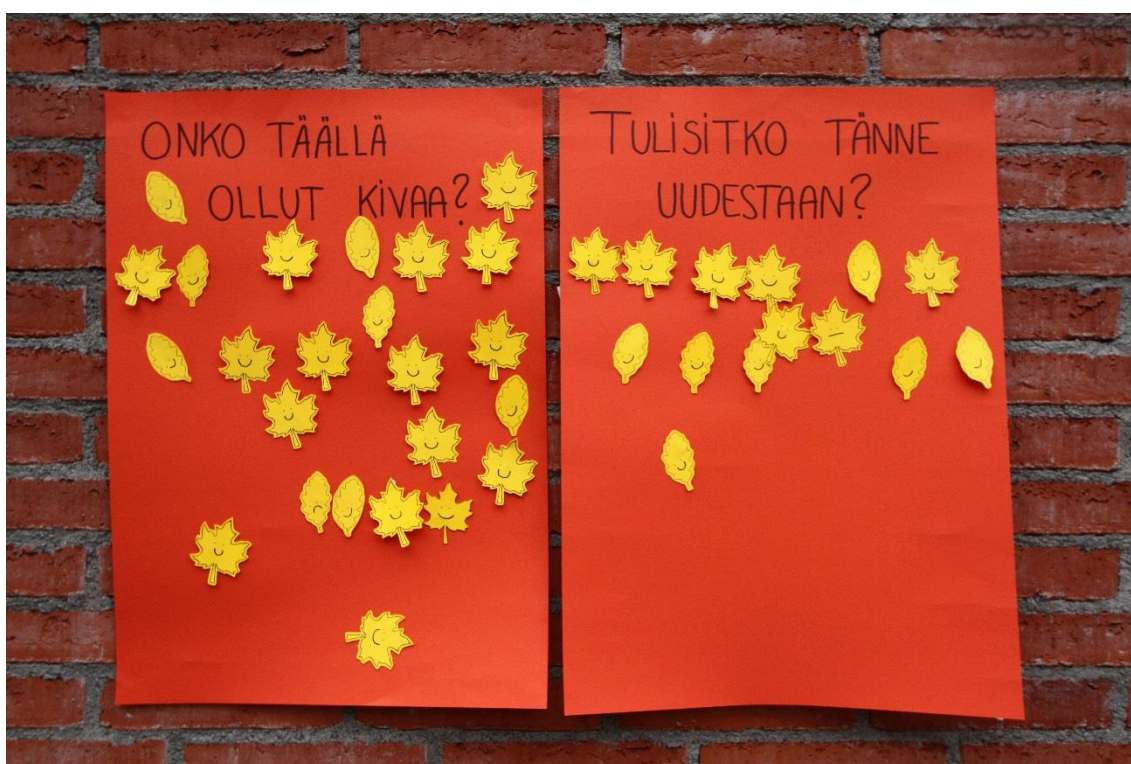
Kuva 3. Lasten palaute

kartoitimme vanhempien toiveita vastaavien tapahtumien järjestämisestä tulevaisuudessa. Vanhemmilta saatu palaute oli valtaosin positiivista, mutta kirjattuna oli myös konkreettisia kehittämissuhteita. Myös lapsilta saatu palaute (kuva 3) oli pääosin positiivista. Kysymykseen ”Onko täällä ollut kivaa?” annettiin 24 palautetta, joista 23 oli hymyileviä. Yksi hymynaama oli surullinen. Kysymykseen ”Tulisitko tänne uudestaan?” lapset antoivat vain 14 vastausta; niistä 13 oli myönteisiä ja yksi ”en tiedä”. Lasten antama palaute on samassa linjassa tekemiemme havaintojen kanssa. Lapset näyttivät viihtyvän tapahtumassa hyvin.