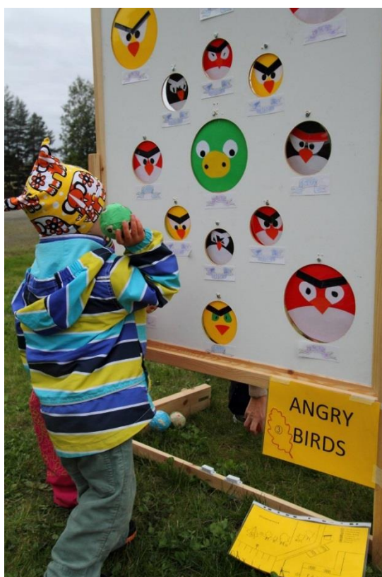
Kuva 2. Angry Birds -pallonheitto (kuva julkaistu vanhemman luvalla)

Tapahtumassa järjestäjien on tärkeää erottua vieraista myönteisesti (Vallo & Häyrinen 2012, 234). Toinen meistä valokuvasi ja huolehti pisteiden sujuvuudesta, toinen oli pukeutuneena tiikeriksi ja toivotti lapsiperheet tervetulleiksi tapahtumaan. Tiikeriksi pukeutuminen yllätti monet lapset myönteisesti, sillä he eivät osanneet odottaa eläinmaskottia. Tiikerihahmot ovat lapsille tuttuja saduista ja elokuvista ja osa lapsista halusikin valokuvan tiikerin kanssa. Vallon ja Häyrisen (2012, 193) mukaan tapahtumassa on hyvä olla yllätyksellisyyttä, sillä tavoitteena on osallistujien odotusten ylittäminen.