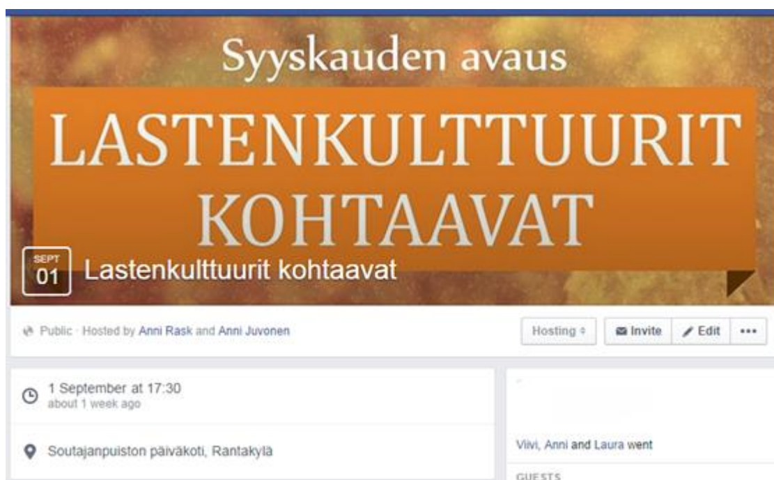
Kuva 1. Facebook-tapahtuma