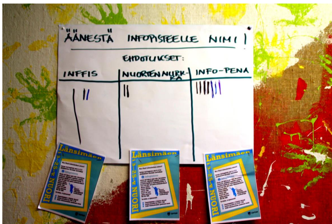
Kuva2: Infopisteen nimiäänestyksen tulokset.

Info-Penan lisäksi hanke aloitti Länsimäessä Mun elämä -kurssit, jotka ovat voimauttavaa pienryhmätoimintaa. Yksi kurssi kesti kahdeksan kertaa ja sitä järjestettiin yhdeksäsluokkalaisille tytöille ja pojille sekä Tonttulan nuorisotilan nuorille aikuisille. Kurssille osallistuvat saivat itse vaikuttaa kurssin sisältöön, ja kurssia toteutettiin yhdessä koulun ja nuorisotyöntekijöiden kanssa. Kurssi sisälsi niin sanottuja faktakertoja, joissa nuoret saivat tietoa heitä kiinnostavista asioista, sekä mukavia yhdessä tekemisen kertoja. Mun elämä -kurssilla vertaisuuden ja ryhmässä vaikuttamisen lisäksi on tärkeää, että nuori huomaa, että voi itse vaikuttaa elämäänsä ja tulevaisuuteensa. (Salmela & Tasanko 2014, 13–20.)