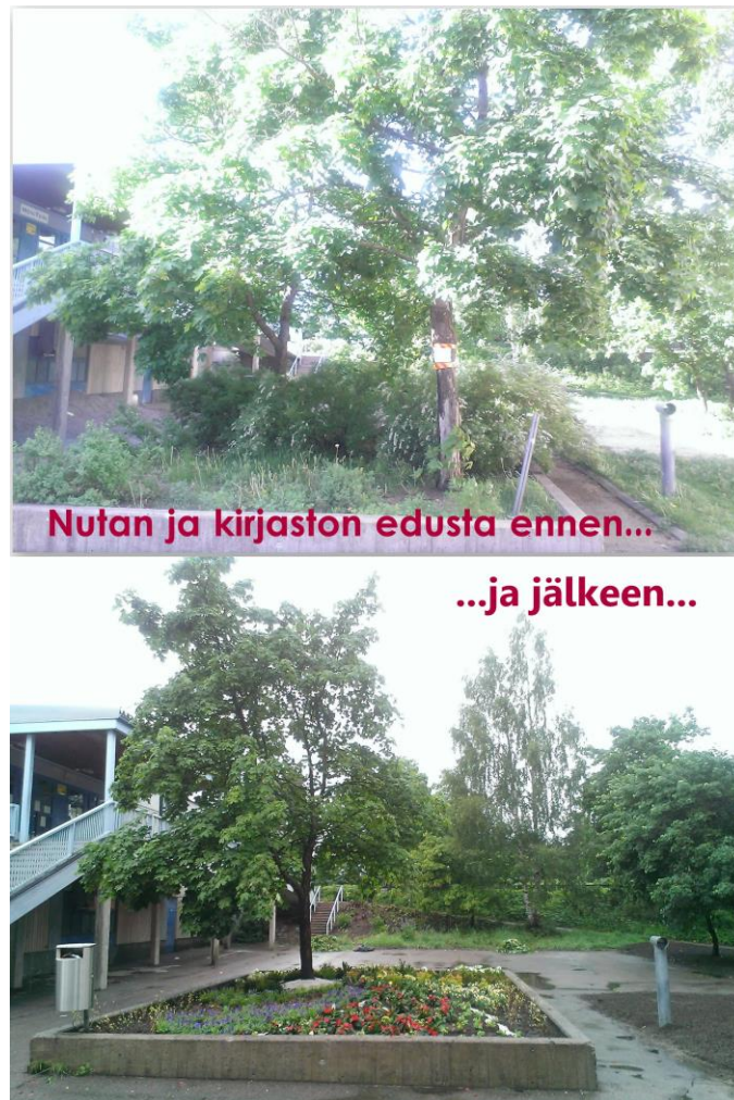
Kuva3: Nuorisotilan ja kirjaston edusta ennen vihertalkoita ja sen jälkeen.

eet kunnostettiin. Vihertalkoisiin osallistui nuorisotilan, kirjaston ja Hakunilan kansainvälisen yhdistyksen lisäksi myös alueen asukkaita ja nuoria. Nuori – omaan elämäänsä vaikuttaja -hanke vastasi mainonnasta ja tarjoiluista ja Länsimäen kiinteistöhuolto tarjosi välineet talkoisiin. Viheralueyksikkö oli myös mukana raivaamalla puita ja tuomalla kesäistutukset. (Salmela & Tasanko 2014, 49–50.)