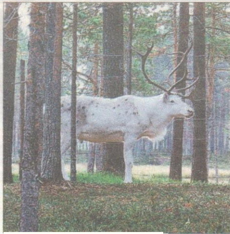
Komea valkoinen poro, untako? Ei vaan totta.